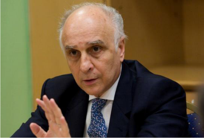
Carlos Bulgheroni ซีอีโอของ Bidas corporation บริษัทน้ำมันยักษ์ใหญ่จากประเทศอาเจนติน่า