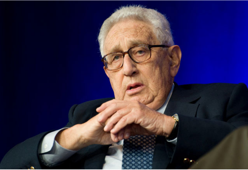
Henry Kissinger นักการเมืองชาวยิว