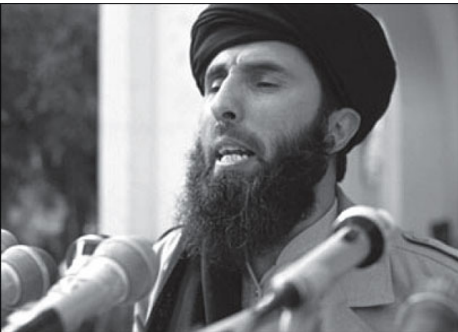
กุลบุคดิน เฮกมัทซัร ผู้นำพรรค อิซบ อี อิสลาม กล่าวคำปราศรัยเกี่ยวกับการยุติภาค ต่อต้านการรุกรานของโซเวียต ที่เปรชวา ประเทศปากีสถาน ปี ค.ศ. 1987