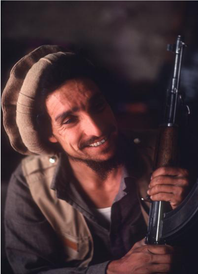
อะหมัด ชาฮู มัชฮูด ราชสีห์แห่งปัญจิริ แม่ทัพผู้มากด้วยความสามารถ มือขวาของ ดร. ร็อบบานีย์ ผู้นำพรรค พรรคญามิฮัต อี อิสลามีย์