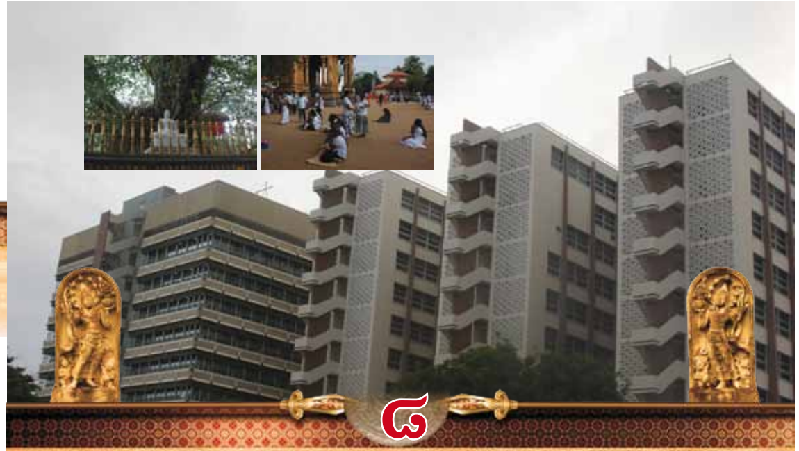
โคลัมโบ : เมืองหลวงปัจจุบัน หน้า ๓๑๓-๓๔๐ ๘ ชมภาพกิจกรรมฝ่ายนั้ดักถยานัน, ศูนย์รวมแห่งศิลปะ และวัฒนธรรมทางพระพุทธรูปศาสนา