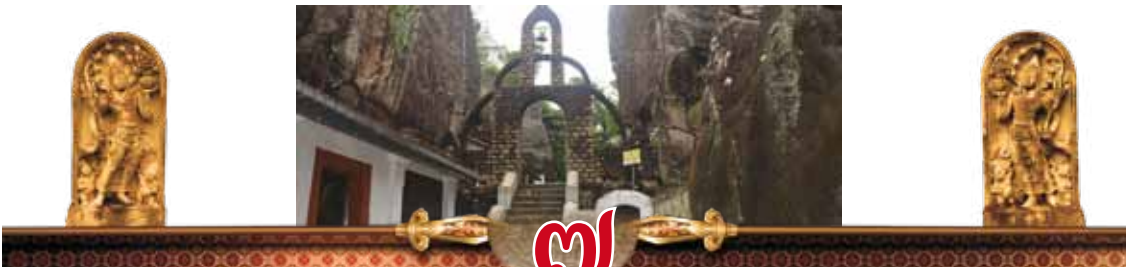
อาโโลกวิหาร : แหล่งกำเนิดพระไตรปิฎก หน้า ๓๐๑-๓๑๒ ๗ ขวต้าวพระพุทธรูปโบราณจารย์ ผู้แปลภาษาสิงหลสู่ภาษาไทย