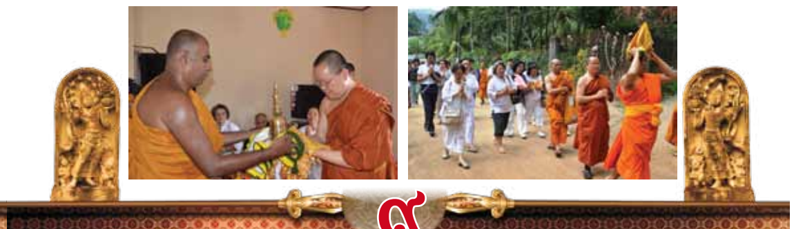
อำลาลเมืองลังกา หน้า ๓๔๑-๓๕๐ ๙ สรูปการจาริกศรีลังกา และ วัณูเข็ญพระสารีริกธาตุ