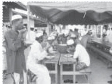
เราเสียดกันบ่อย