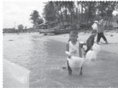
ปล่อยแล้ว...โตขึ้นทูกจะจับกิน