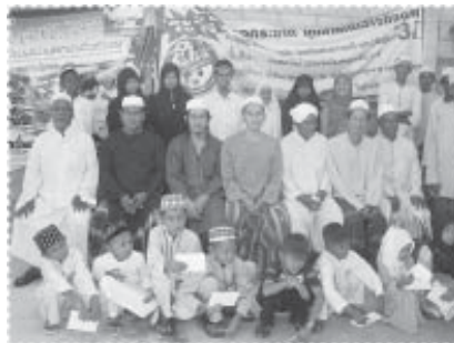
เราไม่มีพ่อแม่