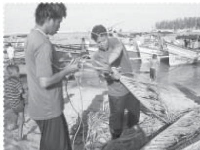
เตรียมการประกอบซั้ง