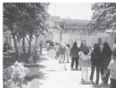
เยี่ยมชมเรือนจำกลางสงขลา

สมาชิกในครอบครัว การจัดกิจกรรมครอบครัวสัปดาห์ กิจกรรมการดูแลและให้ความ ความอนุเคราะห์เด็กกำพร้า พิการ หรือด้อยโอกาสอื่นๆ กิจกรรมการดูแล ผู้สูงอายุ กิจกรรมการจัดระบบสวัสดิการชุมชน การแก้ไขปัญหาความขัดแย้ง โดยสันติวิธี และกิจกรรมการป้องกันการเข้าสู่การติดยาเสพติดในเยาวชน โดยการจัดกิจกรรมต่างๆ เช่น ฝึกอบรมการป้องกันยาเสพติด และเข้าเยี่ยมชม เรือนจำกลางสงขลา การจัดค่ายพัฒนากีฬาฟุตบอลยุวชน พร้อมจัดส่งทีมเข้า แข่งขันระดับตำบลและอำเภอ จัดสัมมนาเชิงปฏิบัติการ เพื่อให้เชื่อมั่นในการ แก้ไขปัญหาความขัดแย้งโดยสันติวิธี จัดกิจกรรมทัศนศึกษาเพื่อให้ชุมชนเกิด ความสามัคคี และใช้การทำงานพัฒนาเป็นเครื่องมือในการแก้ไขปัญหาโดย สันติวิธีในชุมชน การมีคณะผู้อาวุโสของชุมชนที่ทำหน้าที่พยายามเชื่อมประสาน รอยร้าวที่เกิดขึ้นระหว่างแกนนำของโครงการกับผู้ใหญ่บ้านคนใหม่ การส่งตัวแทน ผู้นำชุมชนเข้าร่วมศึกษาเชิงลึกการดำเนินงาน “สภาชุมชน” เพื่อนำมาปรับใช้ใน หมู่บ้านป่าตาบาระ การเข้มงวดกับ การจำหน่ายยาเสพติดในชุมชนโดย ผู้ใหญ่บ้าน และการป้องกันการเข้าสู่ ยาเสพติดของเยาวชน โดยการเข้า เยี่ยมชมสภาพความเป็นอยู่ภายใน เรือนจำกลาง จังหวัดสงขลา การ สนับสนุนทางด้านกีฬา การจัดประชุม สัมมนา และการกระตุ้นผู้ประกอบการ เป็นต้น อย่างไรก็ตามปัญหายาเสพติด ของชุมชนยังคงปรากฏมีอยู่ โดยเฉพาะ ในหมู่วิัยรุ่น และเป็นเรื่องที่ยาก ที่สุดที่จะดำเนินการแก้ไขให้หมดสิ้น ลงได้