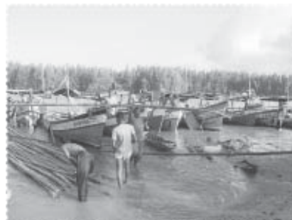
เรือพร้อมนำซั้งไปวางในทะเล