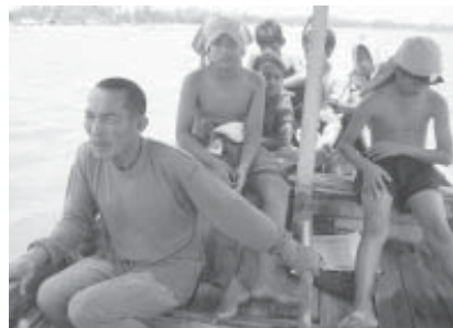
อดีตอิหม่ามมุस्ताฟาร์...เหนื่อยยากเพื่อพวกเขา

บิลาลประจำชุมชน ต่อมาได้รับการ แต่งตั้งเป็นอิหม่าม และได้ลาออกใน เวลาต่อมา คือ บุคคลสำคัญอีกคน หนึ่งที่ทำให้โครงการประสบความสำเร็จและอยู่ได้อย่างยั่งยืนจนถึง ปัจจุบัน ด้วยความมุ่งมั่นและตั้งใจจริง