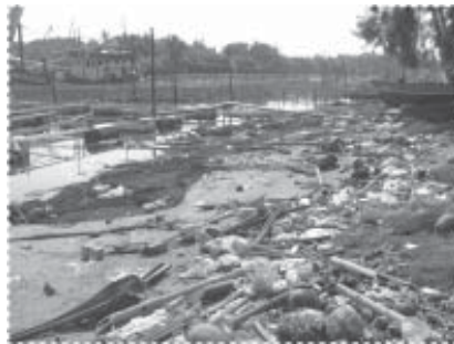
ภาพริมน้ำก่อนเริ่มโครงการ