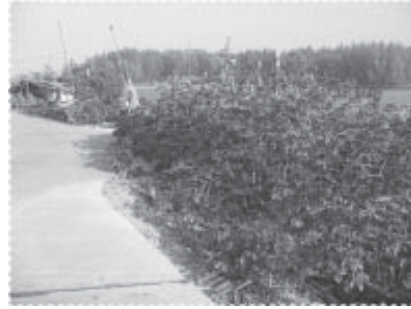
ภาพที่เดียวกัน เมื่อผ่านไป 2 ปี