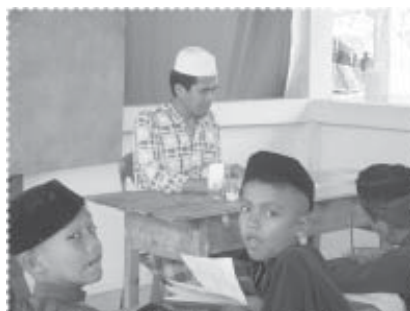
ครูสอนโรงเรียนตาดีกา