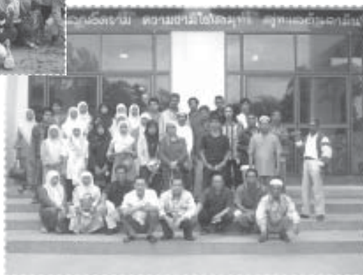
คณะศึกษาดูงาน ภูเก็ต-กระบี่ ☞