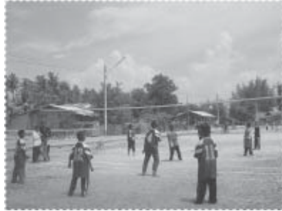
กีฬาเด็กๆ