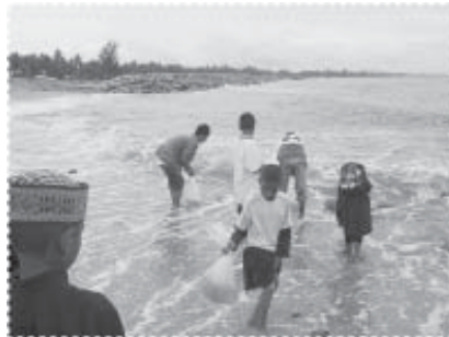
เยาวชนร่วมปล่อยลูกกุ้งลงทะเล

ครัวเรือนที่เข้าร่วมในการจัดหน้าบ้าน/หลังบ้านนามองจำนวนมาก ทำให้เกิดความรู้สึกว่าบ้านเป็นบ้านมากขึ้น และกิจกรรมการตกแต่งบริเวณบ้านดังกล่าวนี้ยังเป็นเครื่องมือที่จะสร้างความรัก และความอบอุ่นภายในครอบครัวได้อีกด้วย โครงการได้ประสานงานกับหน่วยงานของกรมประมงโดยผ่านองค์การบริหารส่วนตำบล เพื่อให้จัดกิจกรรมการปล่อยพันธุ์สัตว์น้ำลงสู่แหล่งน้ำชายฝั่ง เพื่อช่วยกระตุ้นสำนึกทางด้านการอนุรักษ์สิ่งแวดล้อม นอกจากนี้โครงการยังได้เน้นการให้ความรู้เกี่ยวกับสิ่งแวดล้อมผ่านการจัดค่ายเยาวชนรักษ์สิ่งแวดล้อม โดยร่วมมือกับนักศึกษามหาวิทยาลัยสงขลานครินทร์ ภายใต้การดูแลและสนับสนุนทางด้านต่างๆ จากโครงการ จนทำให้โครงการค่ายดังกล่าวได้รับการคัดเลือกเป็นผลงานดีเด่น และหัวหน้าโครงการย่อยดังกล่าว ได้รับการคัดเลือกให้เป็นทูตไบเออร์ด้านสิ่งแวดล้อมของประเทศไทย ประจำปี พ.ศ. 2548