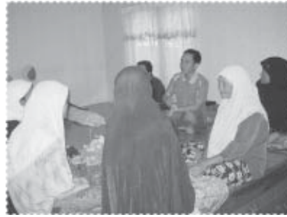
หารือกับทีมข่าวเกรียบ

ดังนั้นในปี 2551 จึงเพิ่มยอดวงเงิน สำหรับการปล่อยสินเชื่อเพื่อซื้อสินค้า เงินผ่อนเป็นเงิน 300,000 บาท สำหรับ ปล่อยกู้ให้สมาชิกจำนวน 35 ราย ใน การบริหารจัดการนั้น คณะกรรมการ กำหนดให้ผู้กู้จ่ายค่าสินค้าที่จัดซื้อ เดือนละครั้ง เป็นระยะเวลาตามที่