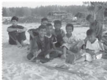
เตรียมเล่นฟุตบอล

ไม่เพียงประสงค์ การแข่งขันกีฬาประเพณีสำหรับผู้อาวุโสของหมู่บ้าน การแข่งขันกีฬาของชุมชน การร่วมสนับสนุนเพื่อปรับปรุงสนามกีฬาของหมู่บ้าน การร่วมคิดและพัฒนาโครงการเพื่อจัดสร้างสนามกีฬาฟุตบอลและลานออกกำลังกายที่มีสภาพสมบูรณ์