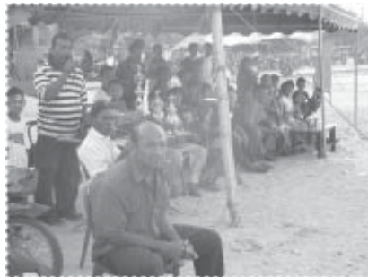
บรรยากาศการแข่งขันกีฬา