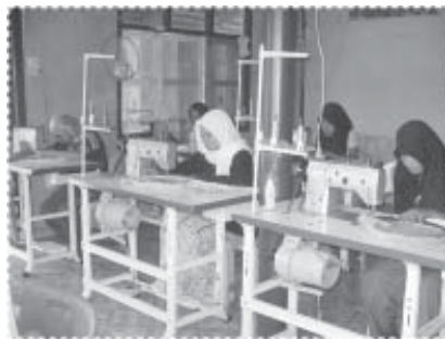
ฝึกอาชีพปักจักร...ทำผ้าคลุมพรม

ในระยะที่ 1 โครงการได้กำหนดแนวทางการพัฒนาอาชีพการทำผ้าคลุมพรมสตรี และได้นำมาดำเนินการจริงในระยะที่ 2 โดยในเดือนธันวาคม 2549 โครงการได้เลือกผู้สนใจจำนวน 15 คน เข้าร่วมฝึกอบรมเทคนิคการปักจักรเพื่อทำผ้าคลุมพรมสตรีจำนวน 45 วัน โดยเลือกเอาผู้ที่ประกอบอาชีพทางด้านนี้ของหมู่บ้านเป็นวิทยากรและประสานงานใช้จักรเย็บผ้าที่จัดซื้อโดยองค์การบริหารส่วนตำบลปะเสยะวอ ซึ่งได้จัดซื้อมาหลายปีแล้ว แต่ยังไม่มีการใช้งานแต่ประการใด จนผู้เข้ารับการอบรมจำนวน 10 ราย