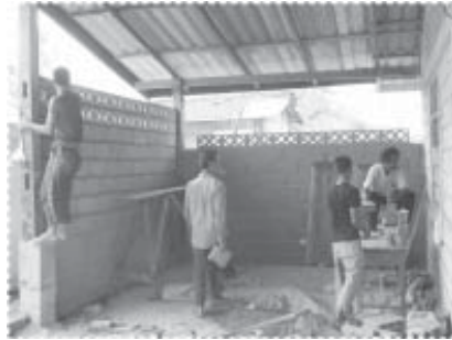
ร่วมกันสร้างห้องพัสดุและหอกระจายข่าว ของหมู่บ้าน