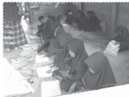
การเรียนในโรงเรียนตาดีกา ก่อนเริ่มโครงการ