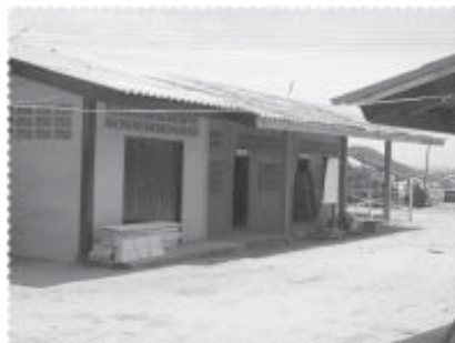
สภาพโรงเรียนตาดีกาที่เริ่มเปลี่ยนแปลง

การเพิ่มขีดความสามารถในการจัดการเรียนการสอนด้านศาสนาให้แก่ผู้สูงอายุและเด็ก จากการวิเคราะห์และประเมินว่าอะไร คือ ความต้องการสูงสุดของประชาคมในชุมชน ผลสรุป คือ การได้เรียนรู้ศาสนาและได้ปฏิบัติศาสนกิจตามที่ศาสนากำหนดอย่างถูกต้อง ซึ่งจะนำไปสู่การเป็นผู้ที่มีสภาพจิตใจที่ดีและเข้มแข็ง ทำให้โครงการให้ความสำคัญกับแผนงานนี้มากเช่นกัน โดยได้มีกิจกรรม