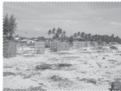
ต้นสนที่ร่วมกันปลูกตลอดแนวชายฝั่ง และรอยเหาใหม่ขังของที่ทิ้งขยะ