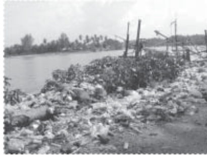
ภาพขณะสกปรกก่อนเริ่มโครงการ