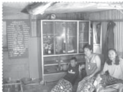
ชมรมกีฬาบ้านป่าตาวาระเกิดขึ้นแล้ว ที่กระท่อมเล็กๆ กลางหมู่บ้าน