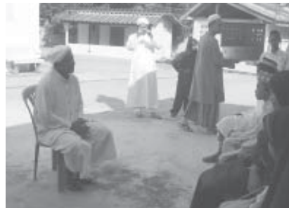
คอเต็บรอยะ กับเด็กกำพร้า

รอยะ อีเต ทุกๆ วันพี่น้องชาวปาตาบาระจะได้รับข่าวสารและความรู้ ต่างๆ ผ่านทางรอยะ อีเต คอเต็บและ ผู้อาวุโสประจำชุมชนที่มีทักษะทาง ดานวาทศิลป์ที่ดีที่สุด นอกจากทำหน้าที่ สอนอัลกุรอานให้แก่บุตรหลานและ เยาวชนในยามค่ำแล้ว รอยะ ในวัย 62 ปี จะเดินเท้าหรือไม่ก็ปั่นจักรยาน คู่ชีพไปทั่วชุมชนเพื่อพูดคุยกับชาวบ้าน