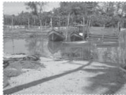
ภาพริมน้ำวันนี้ หลังจากได้รับการ ทำความสะอาดแล้ว...ดีขึ้นมาก