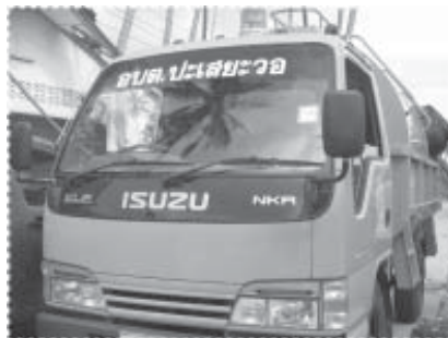
ร่วมสร้างกระแสผลักดันจนได้คันนี้สำหรับขนขยะ

เพื่อใช้ในการกำจัดขยะบางชนิดต่อไป โครงการได้ดำเนินการหาวิธีเพื่อนำ น้ำให้มีการเลิกและลดการสูบบุหรี่ ของชาวบ้าน โดยสามารถผลักดัน ให้ผู้นำศาสนาทั้งสามตำแหน่ง คือ อิหม่าม คอเต็บ และบิลาล เลิกบุหรี่ โดยเด็ดขาด นอกจากนั้น ยังมีชาวบ้าน