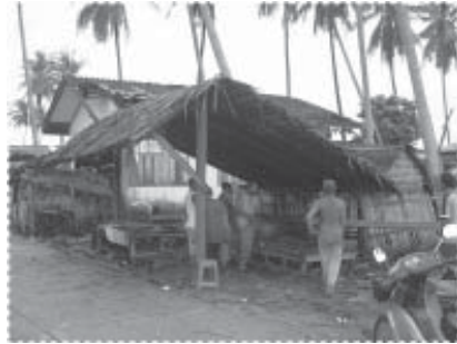
ชาวบ้านออกแรง โครงการออกทุน ช่วยกันสร้างศาลาพักพ่อนรับทาง

การมีส่วนร่วมของประชาชน นับว่าเป็นหัวใจหลักที่สำคัญที่สุดในการขับเคลื่อนโครงการ แม้ว่าจะต้องดำเนินงานภายใต้ความขัดแย้งในการนำของหมู่บ้าน แต่โครงการได้จัดวางกระบวนการมีส่วนร่วมโดยเน้นให้มีความครอบคลุมให้มากที่สุด การจัดวาง บทบาท ของผู้นำหมู่บ้านทั้งกำนัน สมาชิกองค์การบริหารส่วนตำบล และผู้นำศาสนา ให้ถูกต้องและดำเนินการในลักษณะของการให้เกียรติ ทำให้โครงการได้รับความร่วมมือจากกลุ่มผู้นำต่างๆ เป็นอย่างดี อย่างไรก็ตามกลุ่มที่มีบทบาทมากที่สุดในการขับเคลื่อนโครงการ คือ คณะกรรมการบริหารมัสยิด ผู้นำทางธรรมชาติของหมู่บ้าน กลุ่มครูสอนศาสนา กลุ่มสตรีและเยาวชน นอกจากนี้โครงการยังทำหน้าที่เป็นตัวกลางเพื่อที่จะเชื่อมประสานความไม่ลงรอยกันระหว่างกลุ่มผู้นำของหมู่บ้าน เพื่อขับเคลื่อนหมู่บ้านไปสู่เป้าหมายที่ได้วางไว้ การประชุมปรึกษาหารือ การร่วมทัศนศึกษาดูงาน แลกเปลี่ยนเรียนรู้กับพื้นที่ต่างๆ ทำให้ประชาคมเริ่มที่จะเห็นความสำคัญของการทำงานโดยกลุ่ม ที่ดำเนินงานในลักษณะของการร่วมปรึกษาหารือมากขึ้น มีการพูดคุยเกี่ยวกับปัญหาและวิธีการแก้ไขปัญหาสำหรับหมู่บ้านมากขึ้น ชาวบ้านร่วมมือในการ ปรับปรุงและก่อสร้าง อาคาร และบริเวณต่างๆ รอบมัสยิดและโรงเรียนตาดีกา เช่น การร่วมกันสร้างรั้วของโรงเรียนตาดีกา การปรับปรุงทาสีมัสยิดและโรงเรียนตาดีกา การร่วมกันสร้างห้องพัสดุและหอกระจายข่าวของหมู่บ้าน กิจกรรมต่างๆ ที่ได้ดำเนินการไปทั้งหมดนั้น โครงการเป็นเพียงแค่ผู้ทำ