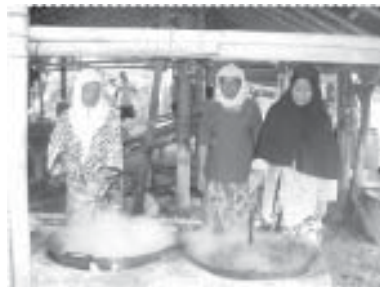
3 สาว มือปรุงอาหาร

ปะเสยะวอ อำเภอสายบุรี ซึ่งจากการดำเนินงานพบว่า ชาวบ้านจำนวนมากยังคงให้ความสนใจสุขภาพด้วยวิธีการออกกำลังกายในรูปแบบต่างๆ เช่น การเดินออกกำลังกายของผู้อาวูโส กลุ่มแม่บ้าน การจัดส่งทีมกีฬาของหมู่บ้านไปเข้าร่วมการแข่งขันยังที่ต่างๆ การแข่งขันกีฬาฟุตบอลประเพณีภายหลังวันเฉลิมฉลอง วันตรุษฮิดลฮัจญ์ การจัดกิจกรรมเชื่อมความสัมพันธ์โดยการร่วมทำอาหาร ร่วมสนับสนุนค่าใช้จ่ายและวัตถุประสงค์ และร่วมรับประทานอาหารใน