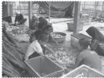
พนักงานเตรียมปลาสด

พนักงานและคณะกรรมการบริหารในแต่ละปี ปัจจุบันพบว่ารายได้จากการจำหน่ายส่วนของหัวปลา สำหรับใช้เป็นอาหารเลี้ยงปลากะพงขาวที่มีการเลี้ยงอยู่มากมายในพื้นที่นั้น สร้างรายได้ให้ระบบสวัสดิการมากกว่า 12,000-15,000 บาทต่อเดือน ซึ่งรายได้ส่วนนี้จะถูกนำไปใช้จัดสรรเป็นสวัสดิการต่างๆ มุ่งเน้นที่การบริจาคให้แก่ผู้สูงอายุและผู้ยากไร้ในชุมชน การจัดสรรเป็นทุนการศึกษาสำหรับเด็กกำพร้าและผู้ที่มีผลการเรียนดีของชุมชน การใช้เป็นเงินค่าตอบแทนครูสอนศาสนา การปรับปรุงมัสยิด โรงเรียนตาดีกา ศาลาพักผ่อนประจำหมู่บ้าน การจัดซื้ออุปกรณ์สำหรับใช้ในสนามเด็กเล่น การจัดกิจกรรมสำหรับเยาวชน เป็นต้น จนนับว่าเป็นเครื่องมือสำคัญของการสร้างความเข้มแข็งขึ้นมาในชุมชนเต็มรูปแบบร่วมกับกิจกรรมอื่นๆที่เกิดขึ้นในชุมชน เช่น กองทุนเลี้ยงปลากะพงขาว ระบบไฟแนนซ์ชุมชน เป็นต้น สิ่งต่างๆ เหล่านี้ได้นำไปสู่การแก้ไขปัญหา