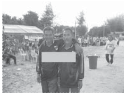
เราแฮปปี้...รุ่นนี้เล่นกีฬา