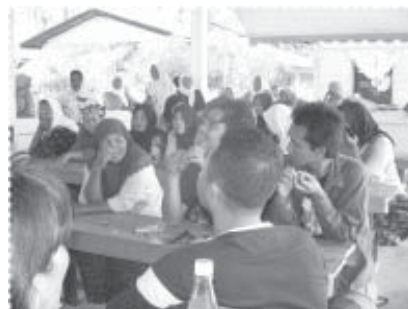
ร่วมประชุมหารือ เมื่อมีกิจกรรมที่จะต้องทำ