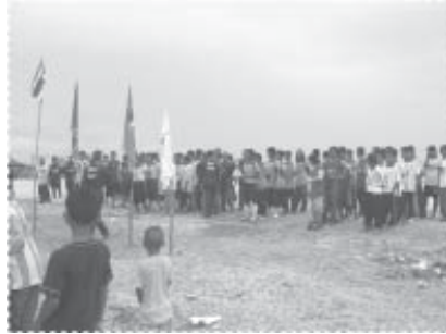
พิธีเปิดการแข่งขันกีฬาหมู่บ้าน