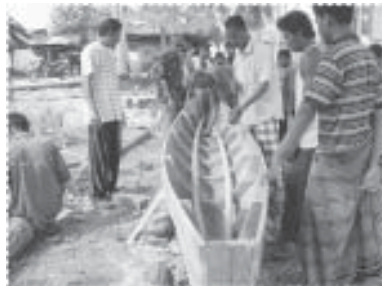
ช่วยกันสร้างเรือพาย

วันตรุษฮิดลฮัจญ์ ซึ่งดำเนินการมาอย่างต่อเนื่องจากการริเริ่มจัดเป็นครั้งแรกในโครงการระยะที่ 1 การแข่งขันกีฬาประเพณีสำหรับผู้อาวูโสของหมู่บ้าน การแข่งขันกีฬาของยุวชน การผลักดันให้องค์การบริหารส่วนตำบลปรับปรุงสนามกีฬาประจำหมู่บ้านให้มีสภาพที่ดีขึ้น การรื้อฟื้นประเพณีการแข่งขันเรือพาย โดยจัดส่งทีมของหมู่บ้านไปแข่งขันยังพื้นที่ต่างๆ จนล่าสุดได้รับรางวัลรองชนะเลิศอันดับที่ 2 จากการแข่งขันเรือพาย (เรือยอกก๊อง) ซึ่งถวายพระราชทาน