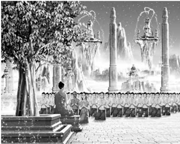
ณ สวรรค์ชั้นดาวดึงส์

“...เมื่อฉันตั้งหลายยังบังเกิดอยู่ การสมมติว่าสัตว์ก็ยังคงมีอยู่ ความจริงแล้วกองสังขารเหล่านี้ย่อมไม่ได้นามว่าสัตว์ มีแต่ทุกข์ เท่านั้นที่เกิดขึ้น มีแต่ทุกข์เท่านั้นที่ตั้งอยู่ และมีแต่ทุกข์เท่านั้นที่เสื่อมสิ้นไป นอกจากทุกข์ไม่มีอะไรเกิด นอกจากทุกข์ไม่มีอะไรดับ”