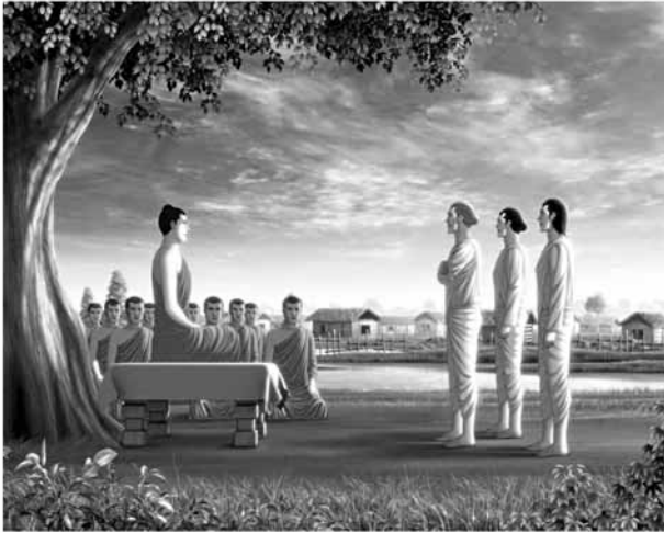
ณ กรุงเวรัญชรา

“...ท่านพรหมณ์ การส่งจิตออกไปภายนอกเพ่งโทษผู้อื่นนั้น คือเหตุ และมีทุกข์เป็นผล การพิจารณาตนเองคือ จิตตุดิตของตน เป็นมรรค มีนิโรธคือการดับทุกข์เป็นผล”