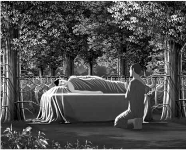
ณ สาละโนทยาน (ป่าสาละ) ของมัลลกะษัตริย์ กรุงกุสินารา แคว้นมัลละ

“อานนท์ สังฆเวชนียสถาน สถานที่อันเป็นเขตให้ระลึกถึงเรา มีอยู่ ๔ แห่ง ๑. อุทยานลุมพินี สถานที่ที่เราประสูติ ๒. พุทธคยา ในแคว้นมคธ สถานที่ที่เราตรัสรู้ ๓. ป่าอสิปตนมฤคทายวัน สถานที่ที่เราแสดงปฐมเทศนา ๔. สาละโนทยาน เมืองกุสินารา นี้ สถานที่ที่เราปรินิพพาน”