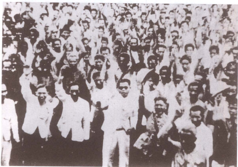
ราษฎรชุมนุมที่หน้าพระที่นั่งอนันตสมาคม