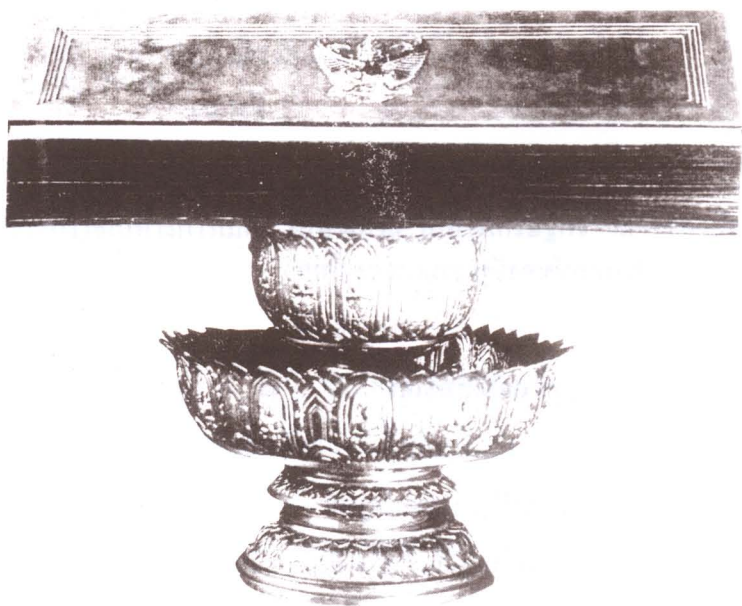
รัฐธรรมนูญแห่งราชอาณาจักรไทย ฉบับวันที่ ๕ พฤษภาคม พุทธศักราช ๒๔๘๕