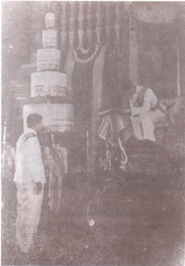
พระบาทสมเด็จพระเจ้าอยู่หัวอานันทมหิดล ทรงลงพระปรมาภิไธยในรัฐธรรมนูญแห่งราชอาณาจักรไทย ๕ พฤษภาคม ๒๔๘๕