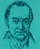
อ็อกสต์ กองต์

แนวความคิด ทฤษฎีทางสังคมวิทยา ตอน เอมิล เดอร์ไคม์ โดย ลิวอิส เอ. โคเซอร์ แปลโดย นฤจร อธิธิจักระจรัส