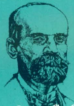
เอมิล เดอร์ไคม์