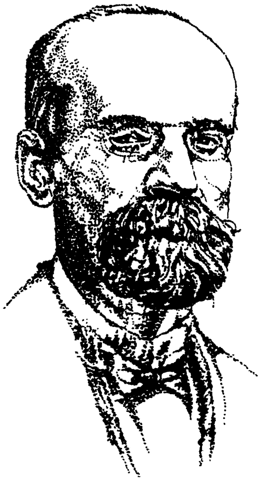
เอมิล เดอร์ไคม์