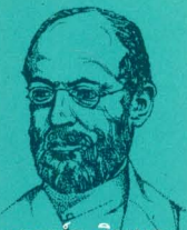
เกออร์ก ซิมเมล