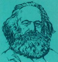
คาร์ล มาร์กซ์