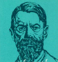
แมกซ์ เวเบอร์