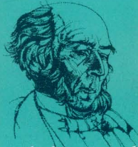
เฮอริเบิร์ต สเปนเซอร์