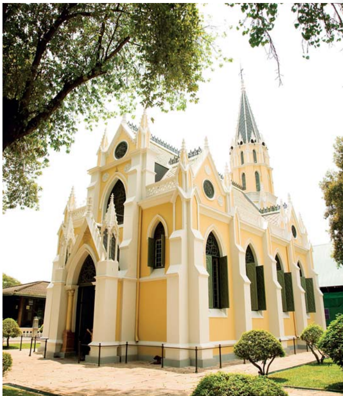
วัดนิเวศธรรมประวัติ

พระที่นั่งวโรภาสพิमान อยู่ทางตอนเหนือของ "สะพานเสด็จ" รัชกาลที่ ๕ ทรงพระกรุณาโปรดเกล้าฯ ให้สร้างขึ้นเมื่อปีพ.ศ.๒๔๑๙ เดิมเป็นเรือนไม้สองชั้นใช้เป็นที่ตั้งประทับและท้องพระโรงร่วมกันต่อมาโปรดเกล้าฯ ให้รื้อสร้างใหม่ตามแบบสถาปัตยกรรมตะวันตก ก่อด้วยอิฐ ทรงวิหารกรีกแบบคอรินเธียรอร์เดอร์ มีมุขตอนหน้า ใช้เป็นท้องพระโรงสำหรับเสด็จออกขุนนางในงานพระราชพิธี และเคยเป็นที่รับรองแขกเมืองหลายครั้ง สิ่งที่น่าชมภายในพระที่นั่งวโรภาสพิमानได้แก่ อารุโฆธาภิเศก ตึกดาหินสลักด้วยฝีมือประณีตและภาพเขียนสีน้ำมันเป็นเรื่องราวภาพชุดพระราชพงศาวดาร อีกทั้งภาพวรรณคดีไทยเรื่องอิเหนา พระอภัยมณี สังข์ทอง และจันทรถิภพ ตลอดจนเป็นที่เก็บเครื่องราชบรรณาการต่างๆ