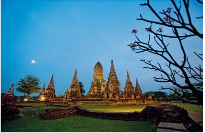
วัดไชยวัฒนาราม

ตลาดน้ำอยุธยาคลองสระบัว จัดเป็นแหล่งท่องเที่ยวใหม่ท่ามกลางธรรมชาติ ริมน้ำอาหารพื้นบ้านหลากหลายชนิด พร้อมทั้งชมการแสดงทางวัฒนธรรม โดยมีรอบการแสดง เวลา ๑๒.๓๐ น./๑๔.๐๐ น./๑๕.๓๐ น. และ ๑๗.๐๐ น. ตลาดน้ำอยุธยาคลองสระบัว เปิดบริการ วันเสาร์และวันอาทิตย์ และวันหยุดนักขัตฤกษ์