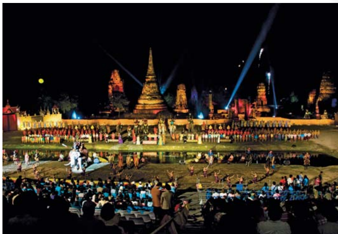
งานยอยศยั้งฟ้าอยุธยาจรดกโลก