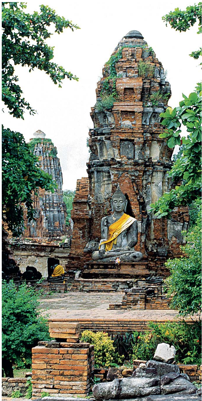
วัดมหาธาตุ