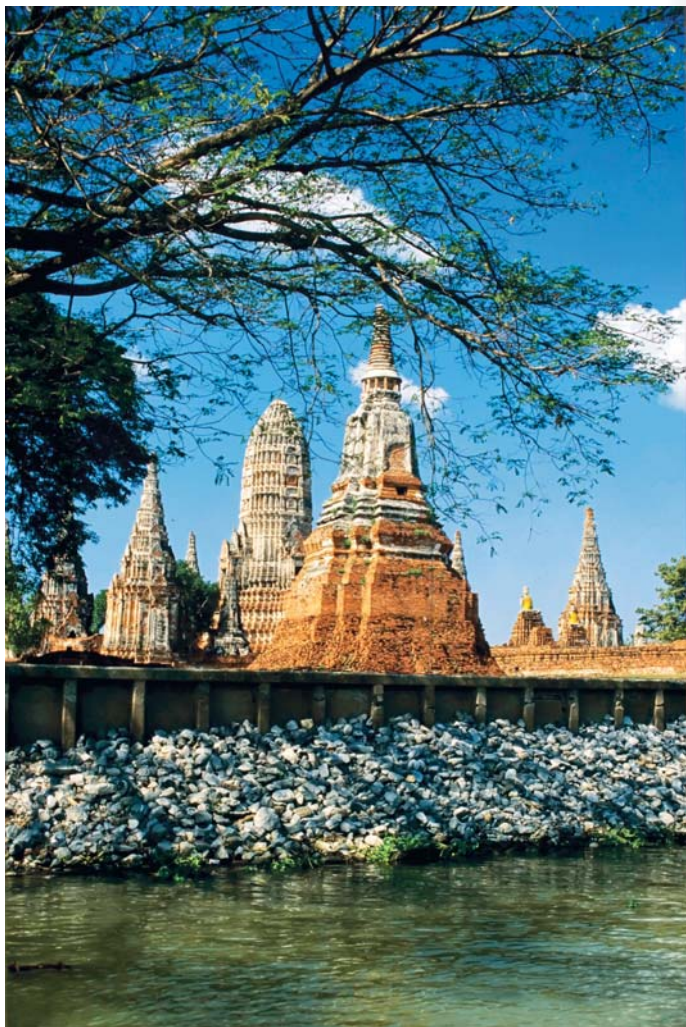
วัดไชยวัฒนาราม