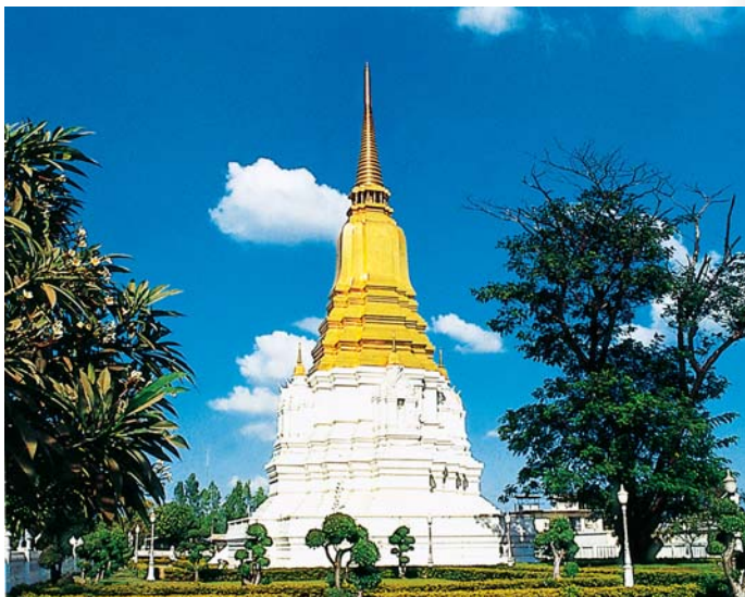
เจดีย์พระศรีสุริโยทัย

สมเด็จพระมหาจักรพรรดิพระราชสวามีจะเป็นอันตราย จนถูกพระแสงของเจ้าพันพระอภัยมณีสังหารและสิ้นพระชนม์อยู่บนคอช้าง เมื่อสงครามยุติลงสมเด็จพระมหาจักรพรรดิทรงปลงพระศพของพระนาง และสถาปนาวัดที่ปลงพระศพขึ้นเป็นวัดสวนหลวงสบสวรรค์ (เดิมชื่อ วัดสบสวรรค์ซึ่งตั้งอยู่ในเขตสวนหลวงของวังหลังสมัยนั้น) ต่อมาในรัชสมัยพระบาทสมเด็จพระจุลจอมเกล้าเจ้าอยู่หัว ได้มีการสอบสวนหาตำแหน่งสถานที่ต่างๆ ที่กล่าวถึงในพระราชพงศาวดารเพื่อเรียบเรียงเป็นหนังสือประชุมพงศาวดารขึ้นทูลเกล้าฯ ถวาย จึงเป็นเหตุให้ทราบตำแหน่งของวัดสบสวรรค์ ซึ่งยังคงพบเจดีย์แบบย่อไม้สิบสองสูงใหญ่ปรากฏตามที่ตั้งในปัจจุบันนี้ ต่อมาพระบาทสมเด็จพระมงกุฎเกล้าเจ้าอยู่หัวได้ทรงขนานนามเรียกชื่อเจดีย์ว่า "เจดีย์พระศรีสุริโยทัย"