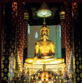
วัดหน้าพระเมรุ

ข้อมูล : ททท. สำนักงานพระนครศรีอยุธยา กองข่าวสารท่องเที่ยว (โทร. ๐ ๒๒๕๐ ๕๕๐๐ ต่อ ๒๑๔๑ - ๕) ออกแบบและจัดพิมพ์ : กองผลิตอุปกรณ์เผยแพร่ ฝ่ายบริการการตลาด ข้อมูลรายละเอียดที่ระบุในเอกสารนี้อาจมีการเปลี่ยนแปลงได้ ลิขสิทธิ์ของการท่องเที่ยวแห่งประเทศไทย ธันวาคม ๒๕๕๒ ห้ามจำหน่าย