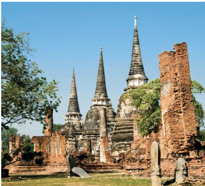
วัดพระศรีสรรเพชญ์

ให้เข้าชมทุกวันเวลา ๐๘.๐๐-๑๘.๐๐ น. ค่าเข้าชม ชาวไทย ๑๐ บาท ชาวต่างชาติ ๕๐ บาท หรือสามารถซื้อบัตรรวมได้ ชาวไทย ๕๐ บาท ชาวต่างชาติ ๒๒๐ บาท โดยบัตรนี้สามารถเข้าชมวัดบริเวณอุทยานประวัติศาสตร์ในจังหวัดพระนครศรีอยุธยาได้ ภายในระยะเวลา ๓๐ วัน สอบถามรายละเอียดที่สำนักงาน อุทยานประวัติศาสตร์พระนครศรีอยุธยา โทร. ๐ ๓๕๒๔ ๒๒๘๔, ๐ ๓๕๒๔ ๒๒๘๖ หมายเหตุ ตั้งแต่เวลาประมาณ ๑๙.๓๐-๒๑.๐๐ น. จะมีการส่องไฟชมโบราณสถาน