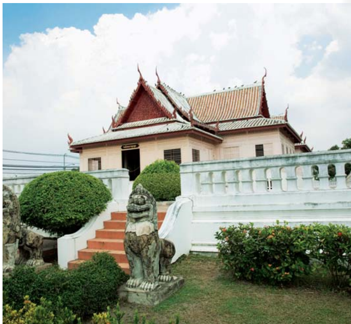
พิพิธภัณฑ์สถานแห่งชาติ จันทรเกษม

มีภาพจิตรกรรมฝาผนังเลื่อนกลาง ชั้นล่างซึ่งเคยเป็นที่เก็บเครื่องทอง มีภาพจิตรกรรมเขียนด้วยสีแดงชาดปิดทองเป็นรูปพระพุทธรูปปางลีลาและปางสมาธิ รวมทั้งรูปเทวดาและรูปดอกไม้ เมื่อพ.ศ.๒๕๐๐ คนร้ายได้ลักลอบขุดโบราณวัตถุที่ฝังไว้ในกรุปรารงค์ประธานวัดราชบูรณะ โดยขุดเจาะจากพื้นคูหาเรือนธาตุลงไปพบห้องที่ฝังโบราณวัตถุ ๒ ห้อง ต่อมาทางราชการติดตามจับคนร้ายและยึดโบราณวัตถุได้เพียงบางส่วน โบราณวัตถุในกรุ พระปรารงค์วัดราชบูรณะทำด้วยทองคำ สำริด หิน ดินเผาและอัญมณี เมื่อกรมศิลปากรขุดแต่งพระปรารงค์วัดราชบูรณะต่อ ได้นำโบราณวัตถุที่มีค่าไปเก็บรักษาไว้ในพิพิธภัณฑ์สถานแห่งชาติ เจ้าสามพระยา ซึ่งสร้างโดยเงินบริจาคจากการนำพระพิมพ์ขนาดเล็กที่ได้จากกรุนี้มาจำหน่ายเป็นของชำร่วย วัดนี้เปิดให้เข้าชมทุกวัน เวลา ๐๘.๓๐-๑๖.๓๐ น. ค่าเข้าชม ชาวไทย ๑๐ บาท ชาวต่างชาติ ๕๐ บาท หรือสามารถซื้อบัตรรวมได้ ชาวไทย ๕๐ บาท ชาวต่างชาติ ๒๒๐ บาท บัตรนี้สามารถเข้าชมวัดต่างๆ ในจังหวัดพระนครศรีอยุธยาได้ ภายในระยะเวลา ๓๐ วัน ได้แก่ วัดพระศรีสรรเพชญ์และพระราชวังหลวง วัดมหาธาตุ วัดราชบูรณะ วัดพระราม วัดไชยวัฒนาราม หมายเหตุ ตั้งแต่เวลาประมาณ ๑๙.๓๐-๒๑.๐๐ น. จะมีการส่องไฟชมโบราณสถาน