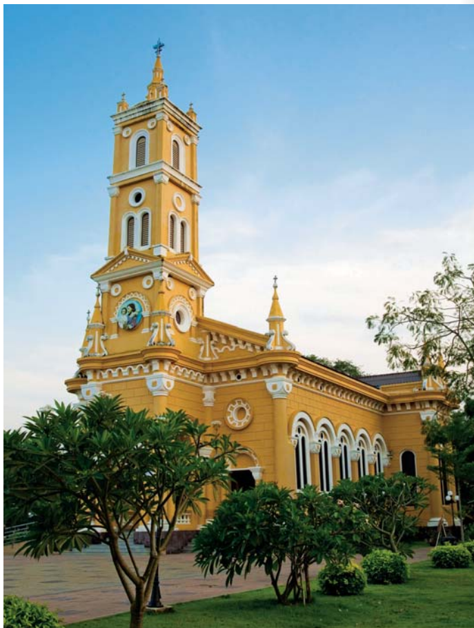
วัดนักบุญยอแซฟ

แห่งกรุงศรีอยุธยา หลังจากคณะธรรมทูตรุ่นแรกแห่งปารีส คือ ฯพณฯ ท่าน ลอมแบร์ต เดอ ลาม็องต์กับพระสงฆ์อีก ๒ รูป ได้เดินทางมากรุงศรีอยุธยา เมื่อวันที่ ๒๒ สิงหาคม พ.ศ.๒๒๐๕ ท่านและคณะได้ทำประโยชน์ต่อ ชาวกรุงศรีอยุธยา เป็นที่พอพระทัย พร้อมกันนั้นท่านได้เข้าเฝ้า สมเด็จพระนารายณ์มหาราช เพื่อทูลขอสถานที่สร้างวัดและโรงเรียน เพื่อประกอบ พิธีกรรมทางศาสนาและให้การศึกษาแก่เด็ก พระองค์ท่านจึงได้พระราชทาน ที่ดินแปลงหนึ่งริมน้ำ เพื่อสร้างวัดและโรงเรียนซึ่งเรียกชื่อในสมัยนั้นว่า "ค้ายนักบุญยอแซฟ" คนไทยได้อาศัยวัดนี้เป็นป้อมต่อสู้กับพม่าจนกระทั่ง ถึงวันที่ ๒๓ มีนาคม พ.ศ.๒๓๑๐ ก่อนกรุงศรีอยุธยาจะเสียแก่พม่า