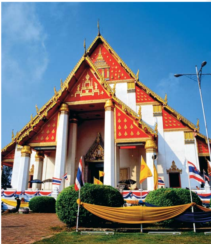
วัดมงคลพิตร

วิหารพระมงคลพิตร ตั้งอยู่ทางด้านทิศใต้ของวัดพระศรีสรรเพชญ์ ใช้เส้นทางเดียวกับทางไปคุ้มขุนแผน วิหารพระมงคลพิตรจะอยู่ถัดไปไม่ไกลนัก พระมงคลพิตรเป็นพระพุทธรูปบุสัมฤทธิ์ปางมารวิชัย มีขนาดหน้าตักกว้าง ๙.๕๕ เมตรและสูง ๑๒.๔๕ เมตร นับเป็นพระพุทธรูปขนาดใหญ่องค์หนึ่งในประเทศไทย ไม่มีหลักฐานแน่ชัดว่าสร้าง