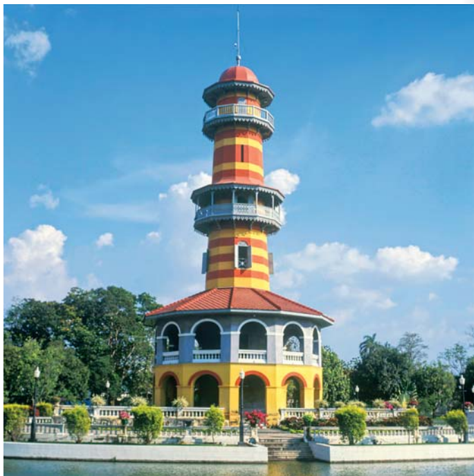
พระราชวังบางปะอิน

๑๐.๐๐-๑๗.๐๐ น. วันเสาร์-อาทิตย์และวันหยุดราชการ เวลา ๐๙.๐๐-๑๘.๐๐ น. สอบถามข้อมูลเพิ่มเติมโทร. ๐ ๓๕๓๖ ๗๐๕๔-๙ โทรสาร ๐ ๓๕๓๖ ๗๐๕๑