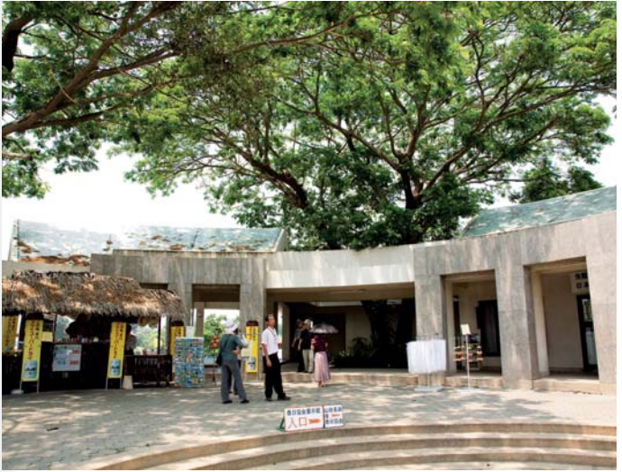
หมู่บ้านญี่ปุ่น

ญี่ปุ่นได้สร้างหุ่นจำลอง นากามาซะ ยามาตะ และจารึกประวัติศาสตร์ความเป็นมาของหมู่บ้านญี่ปุ่นในสมัยกรุงศรีอยุธยาที่ตั้งไว้ในหมู่บ้าน มีอาคารจัดแสดงเรื่องความสัมพันธ์ระหว่างอยุธยากับต่างประเทศ เปิดเวลา ๐๘.๐๐-๑๗.๐๐ น. ค่าเข้าชมชาวไทยและชาวต่างชาติ ราคา ๕๐ บาท สอบถามรายละเอียดได้ที่ สมาคมไทย-ญี่ปุ่น โทร. ๐ ๒๒๕๑ ๕๘๕๒ หรือ www.thai-japanasso.or.th