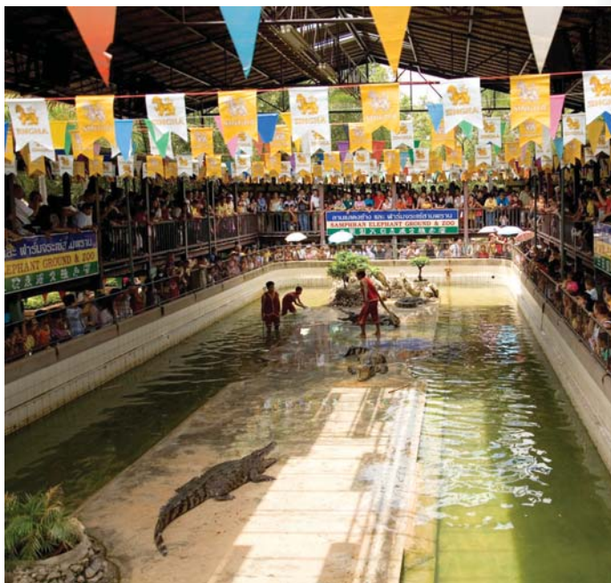
ลานแสดงช้างและฟาร์มจระเข้สามพราน

เส้นทางที่สอง จากวัดดอนหวาย ผ่านวัดไร่ขิง วังปลา ลอดใต้สะพาน โปธิ์แก้ว ร.ร.ภปร.ราชวิทยาลัย วัดสรรเพชร วัดเดชานุสรณ์และสวนสามพราน ใช้เวลา ๒ ชั่วโมง แบ่งออกเป็นรอบๆ สอบถามรายละเอียดได้ที่ ศรีสวัสดิ์ย้อนยุค อาจารย์สวัสดิ์ ไทร. ๐ ๓๔๓๙ ๓๖๓๙, ๐๘ ๑๔๔๘ ๘๘๙๖, ๐๘ ๑๖๕๙ ๕๘๐๕ มิตรสายชล ไทร. ๐๘ ๑๔๔๖ ๘๕๕๖, ๐๘ ๔๑๔๖ ๕๖๑๖, ๐๘ ๑๔๘๒ ๑๑๐๙ เรือรุ่งฟ้า ไทร.๐๘ ๑๒๔๑ ๘๐๒๙, ๐๘ ๑๑๙๖ ๓๓๙๒