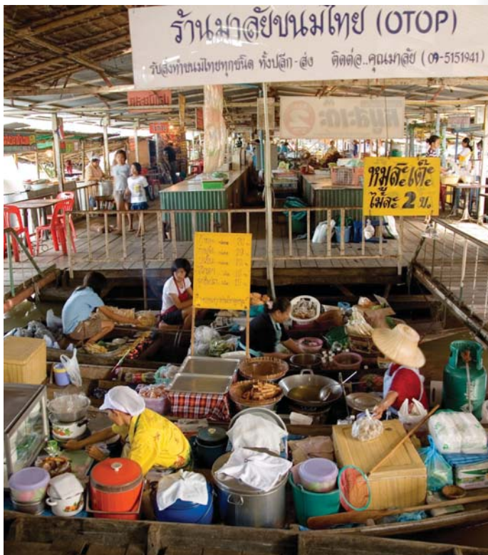
ตลาดน้ำวัดลำพญา

สอบถามรายละเอียดเพิ่มเติมได้ที่ ประชาสัมพันธ์ตลาดน้ำวัดลำพญา โทร. ๐๘ ๑๗๖๓ ๔๑๗๙, ๐๘ ๑๖๕๙ ๗๓๗๑, ๐๘ ๑๗๒๑ ๔๘๗๔, ๐๘ ๑๕๗๒ ๑๑๔๓ สภาวัฒนธรรมตำบลลำพญา โทร. ๐ ๓๔๓๙ ๑๖๒๖ วัดลำพญา โทร. ๐ ๓๔๓๙ ๑๙๘๕ โรงเรียนวัดลำพญา โทร. ๐ ๓๔๓๙ ๒๐๒๒