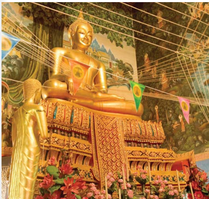
หลวงพ่อวัดไร่ขิง

บาท เด็ก ๒๐ บาท ค่าบัตรผ่านประตูรวมค่าเข้าชมการแสดงต่างๆ ๔๘๐ บาท สอบถามรายละเอียดได้ที่ โทร. ๐ ๒๒๙๕ ๓๒๖๑-๔, ๐ ๓๔๓๒ ๒๕๔๔-๗ www.rosegardenriverside.com