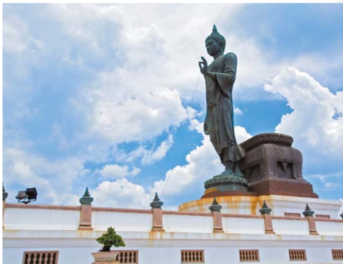
พุทธมณฑล