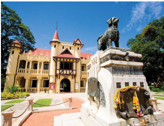
พระราชวังสนามจันทร์

ประมาณเดือนพฤศจิกายนของทุกปีจะมีงานนมัสการองค์พระปฐมเจดีย์ สอบถามรายละเอียดได้ที่ สำนักงานจัดประโยชน์และรักษาองค์พระปฐมเจดีย์ โทร. ๐ ๓๔๒๔ ๒๑๔๓ และภายในวัดพระปฐมเจดีย์ยังมีสิ่งที่น่าสนใจต่าง ๆ ให้ชม เช่น