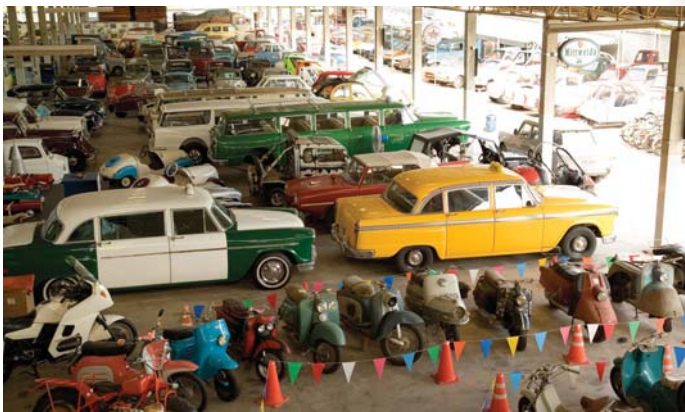
เจษฎา เทคนิค มิวเซียม

ไปยังองค์พระปฐมเจดีย์เพื่อสะดวกในการเสด็จพระราชดำเนินไปนมัสการองค์พระปฐมเจดีย์ คลองนี้ผ่านพื้นที่ทางตอนใต้ของวัดหัวทองและหมู่บ้านชาวบ้านจึงอพยพมาอยู่ใกล้คลองเพราะสะดวกในการคมนาคม วัดนี้จึงย้ายจากที่เดิมมาอยู่ใกล้คลองเจดีย์บูชาและเปลี่ยนชื่อเป็น "วัดศีรษะทอง" ต่อมาทางราชการได้ยกขึ้นเป็นตำบลศีรษะทองสืบมาจนถึงทุกวันนี้ ที่วัดแห่งนี้ประชาชนจำนวนมากนิยมมานมัสการพระราหูเพื่อความเป็นสิริมงคล เปิดเวลา ๐๙.๐๐-๑๗.๐๐ น. เฉพาะวันพุธเปิดเวลา ๐๙.๐๐-๒๑.๐๐ น.