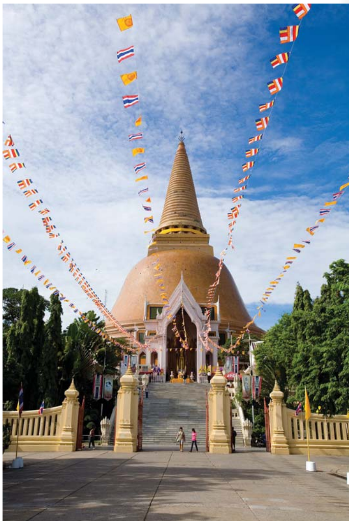
องค์พระปฐมเจดีย์