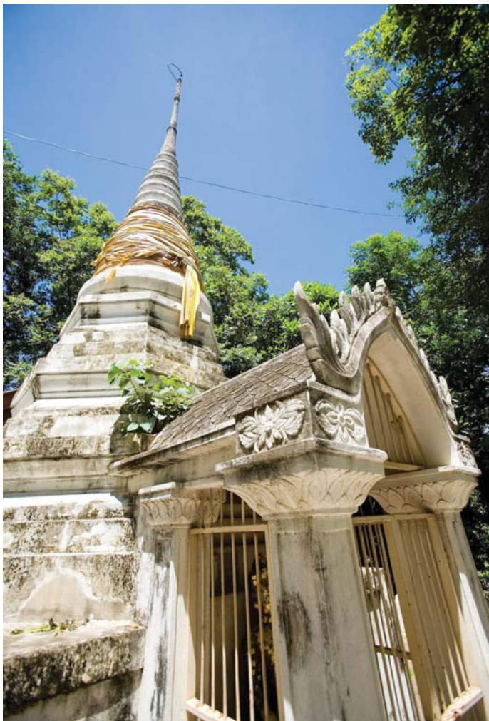
วัดพระงาม

สะดวก ต้องค้ำคินกลางทางหนึ่งคิน จำเป็นต้องสร้างที่ประทับแรมขึ้นในบริเวณนั้น พระบาทสมเด็จพระจอมเกล้าเจ้าอยู่หัวโปรดเกล้าฯ ให้สร้างพระราชวังขึ้นที่บริเวณพระปฐมเจดีย์ทำนองเดียวกับพระราชวังที่พระมหากษัตริย์สมัยอยุธยาทรงสร้างบริเวณริมพระพุทธรบาท และทรงพระราชทานนามว่า "พระนครปฐม" และโปรดเกล้าฯ ให้ขุดคลองมหาสวัสดิ์และคลองเจดีย์บูชา ทำให้การคมนาคมระหว่างกรุงเทพฯ ไปยังนครปฐมสะดวกขึ้น