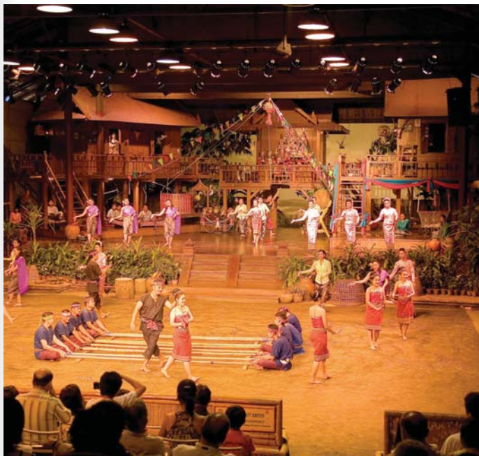
สวนสามพราน

รถโดยสารประจำทาง นั่งรถโดยสารประจำทางปรับอากาศชั้น ๒ จากสถานีขนส่งสายใต้ สายเก่า (กรุงเทพฯ-อ้อมใหญ่-สามพราน-นครปฐม) กรุงเทพฯ-ราชบุรี กรุงเทพฯ-บางลี่ กรุงเทพฯ-สุพรรณบุรี ลงปากทางเข้าวัดไร่ขิงแล้วต่อรถโดยสารประจำทางเข้าไป ตลาดดอนหวายจะอยู่เลยวัดไร่ขิงไปประมาณ ๑๐ กิโลเมตร