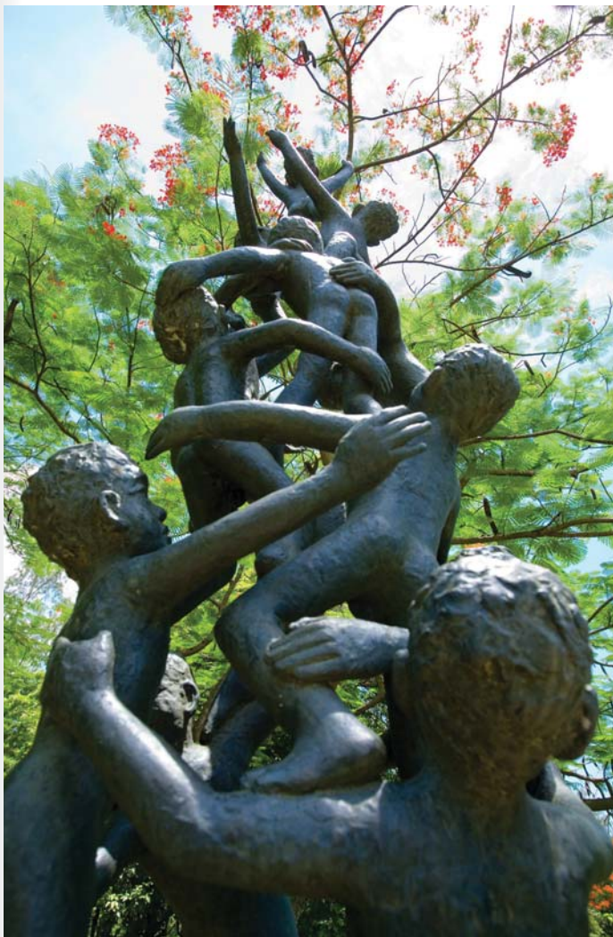
สวนศิลป์ มีเซียม ยิบอินซอย

กระจ่าง ผู้สร้างภาพยนตร์การ์ตูนเรื่องแรกของไทยคือเรื่องสุดสาคร เปิดวันเสาร์และวันอาทิตย์ เวลา ๑๐.๐๐-๑๖.๐๐ น. เข้าชมเป็นรอบๆ ละ ๑๐ คน มีรอบ ๑๐.๐๐ น., ๑๓.๐๐ น., ๑๕.๐๐ น. ฉายหนึ่งเวลา ๑๖.๓๐ น. (เข้าชมวันจันทร์-ศุกร์ กรุณาติดต่อล่วงหน้าก่อนเข้าชม) ไม่เสียค่าเข้าชม สอบถามรายละเอียด โทร. ๐ ๒๕๘๒ ๒๐๑๓-๕, ๐ ๒๕๘๒ ๑๐๘๗-๘ ต่อ ๑๐๓ หรือ www.fapot.org/