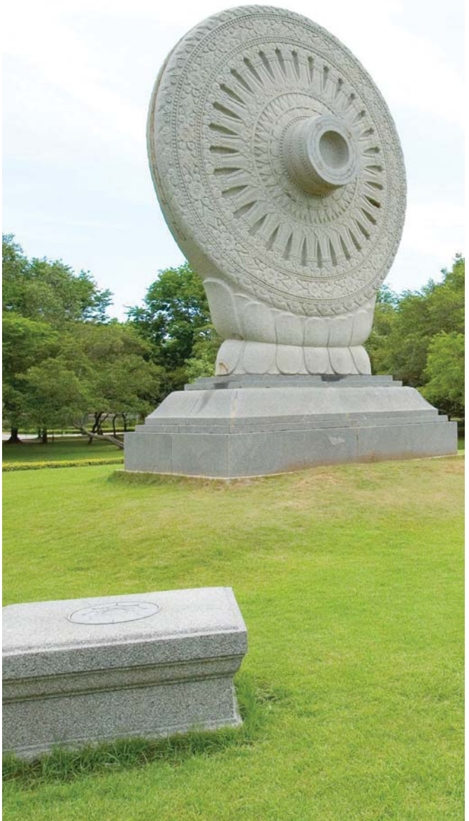
พุทธมณฑล