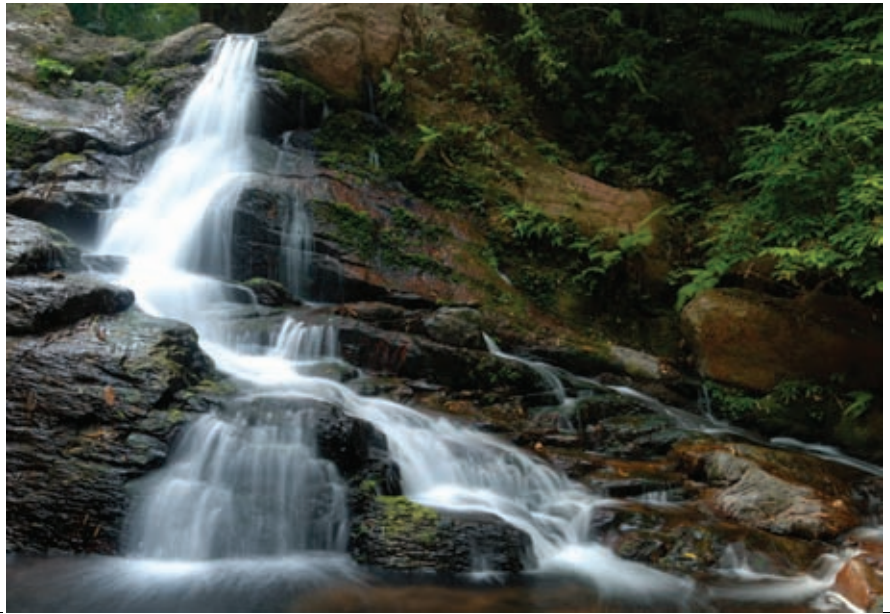
น้ำตกหัวห้า Huay Ha Waterfall

น้ำตกสะปัน หมู่ ๑ บ้านสะปัน ตำบลงพงญา ห่างจากที่ทำการอุทยานฯ ๑ กิโลเมตร บนทางหลวงหมายเลข ๑๐๘๑ เลี้ยวขวาเข้าไปประมาณ ๒ กิโลเมตร เป็นน้ำตกขนาดกลางสูง ๓ ชั้น มีน้ำตลอดปี สภาพร่มรื่นป่าไม้สมบูรณ์สวยงาม อยู่ห่างจากที่ว่าการอำเภอบ่อเกลือ ๑๐ กิโลเมตร รถยนต์เข้าถึงสะดวก แล้วเดินต่อไปอีก ๘๐๐ เมตร