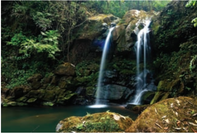
น้ำตกสะปัน Sapan Waterfall

Khun Nan National Park is within the compound of the Doi Phu Kha and Doi Pha Daeng National Forest Reserves, Phu Fa sub-district, Bo Kluea Tai sub-district and Dong Phraya sub-district, covering important mountain ranges such as Phu Fa, Khun Nam Wa Noi, Nam Wa Klang and Phi Pan Nam mountain ranges.