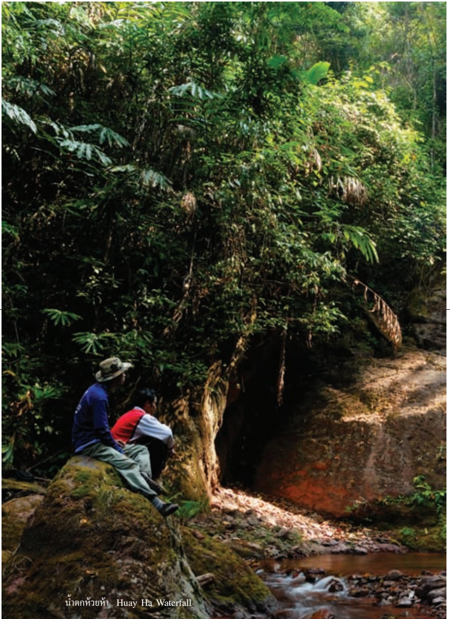
น้ำตกหัวท่า Huay Ha Waterfall