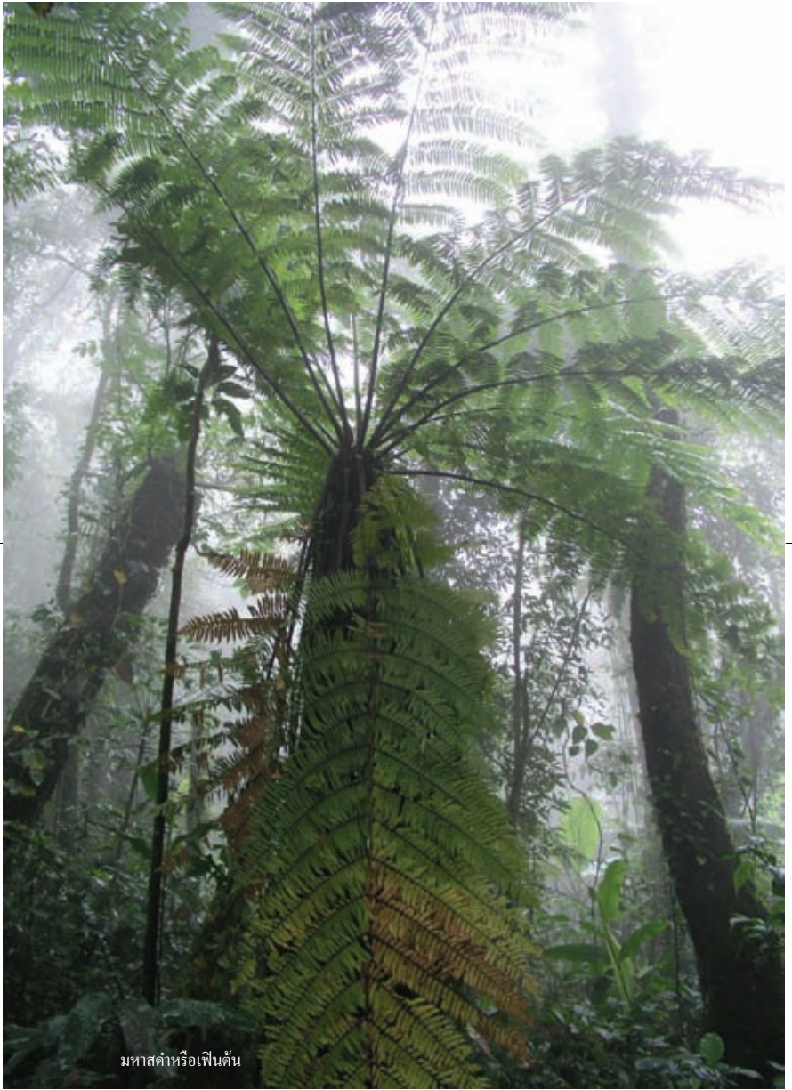
มหาสด้าหรือเฟินต้น