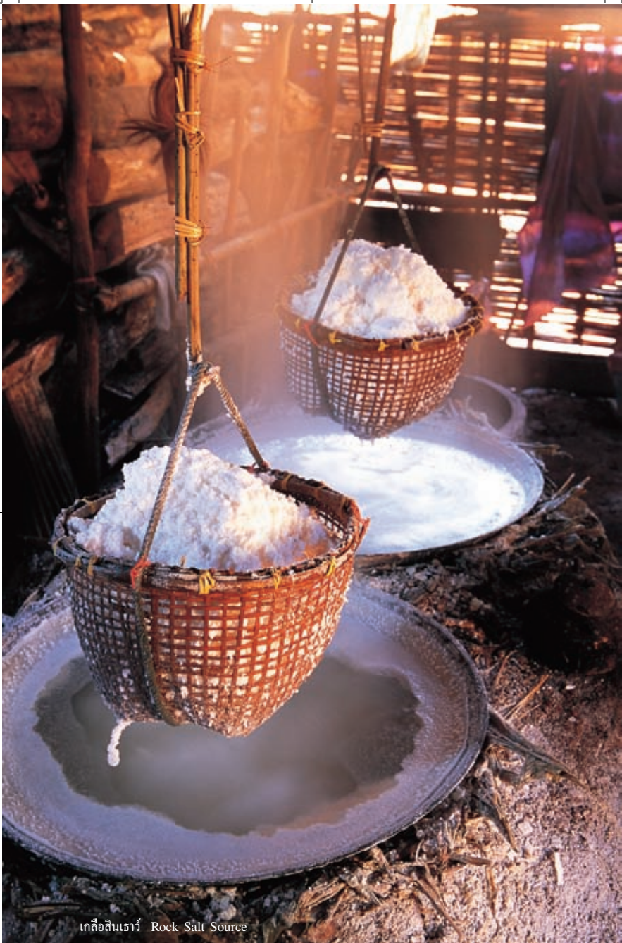
เกลือสินเธาว์ Rock Salt Source