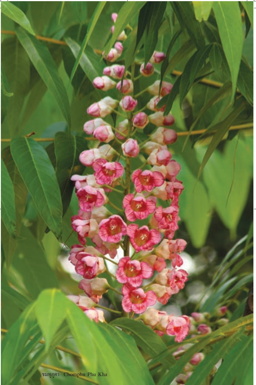
ชมพู่ลา Chomphu Phu Kha