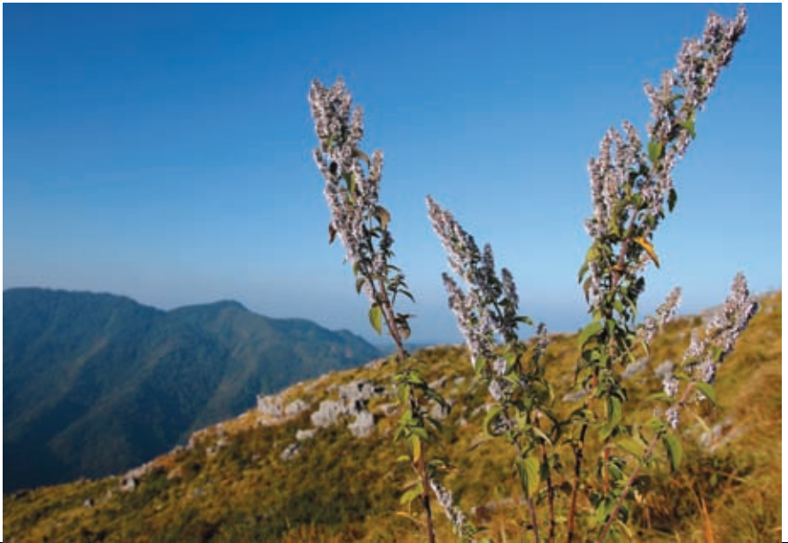
ดอยภูแว Doi Pha Wae

ยอดดอยภูแว เป็นยอดดอยที่มีความสูงชัน สูงจากระดับน้ำทะเล ๑,๘๓๗ เมตร เป็นเทือกเขาเดียวกับภูเขาลูไต มีลักษณะโดดเด่น คือ ปราศจากต้นไม้ใหญ่ เป็นทุ่งหญ้าบนดอย อีกทั้งยังมีลานหินและหน้าผาสูงชัน เช่น ผาแอ่น ผาฝั่ง ดอยภูแวค้นพบอุทยานหายซึ่งเป็นหายทะเลอายุประมาณ ๒๑๘ ล้านปี ที่บริเวณบ้านค้ำฮ่อ อำเภอทุ่งช้าง การเดินทางโดยรถยนต์จากที่ทำการอุทยานฯ ไปถึงหน่วยพิทักษ์อุทยานแห่งชาติดอยภูคาที่ ๙ (บ้านด่าน) ระยะทางประมาณ ๖๓ กิโลเมตร และเดินทางเท้าขึ้นยอดดอยภูแวประมาณ ๘ กิโลเมตร และมีลูกหาบให้บริการ