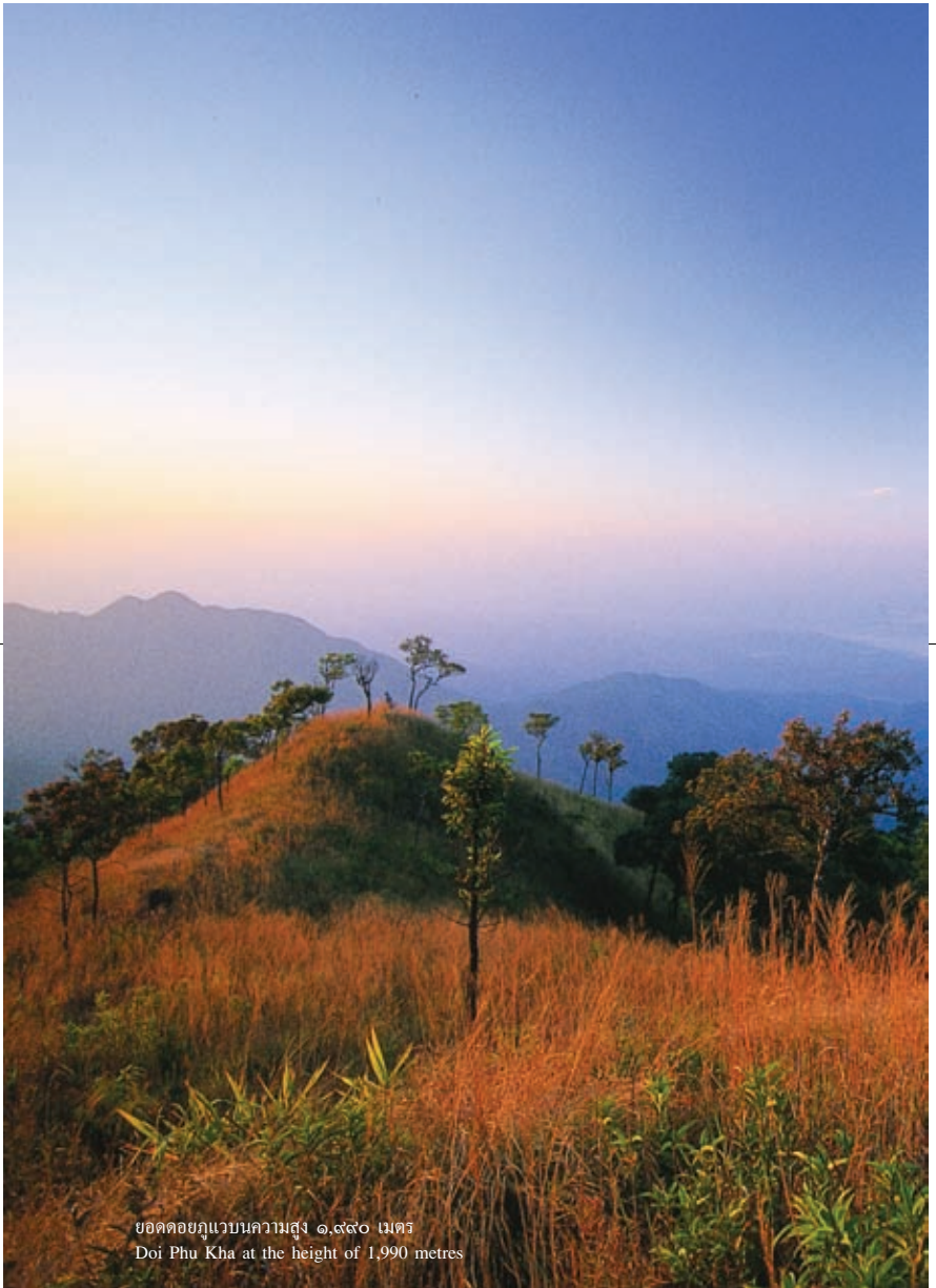
ยอดตอขลุ่ยแวนความสูง ๑,๙๙๐ เมตร Doi Phu Kha at the height of 1,990 metres