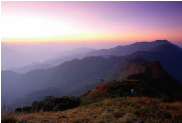
ดอยภูแก้ว Doi Pha Wae

On the top tier, the 12th, tremendous water thunders down from sky-high cliff. The waterfall is accessible by foot and there is a jungle tour that takes 4 days and 3 nights. Alternately the walk can be combined with boat trip and it only take 3 days and 2 nights. Please contact Doi Phu Kha National Park or Travel Agencies in Nan Town for more information.