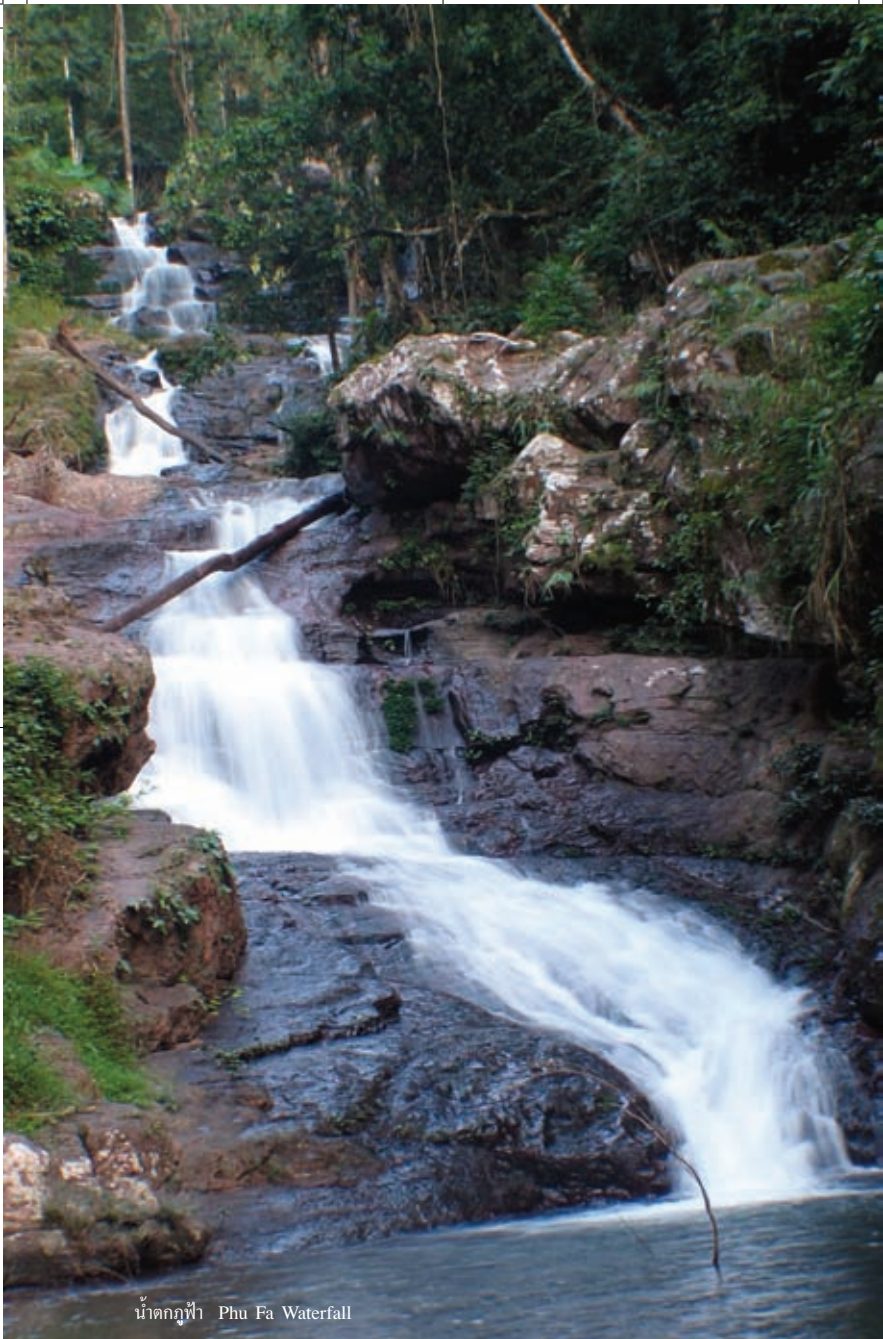
น้ำตกภูฟ้า Phu Fa Waterfall