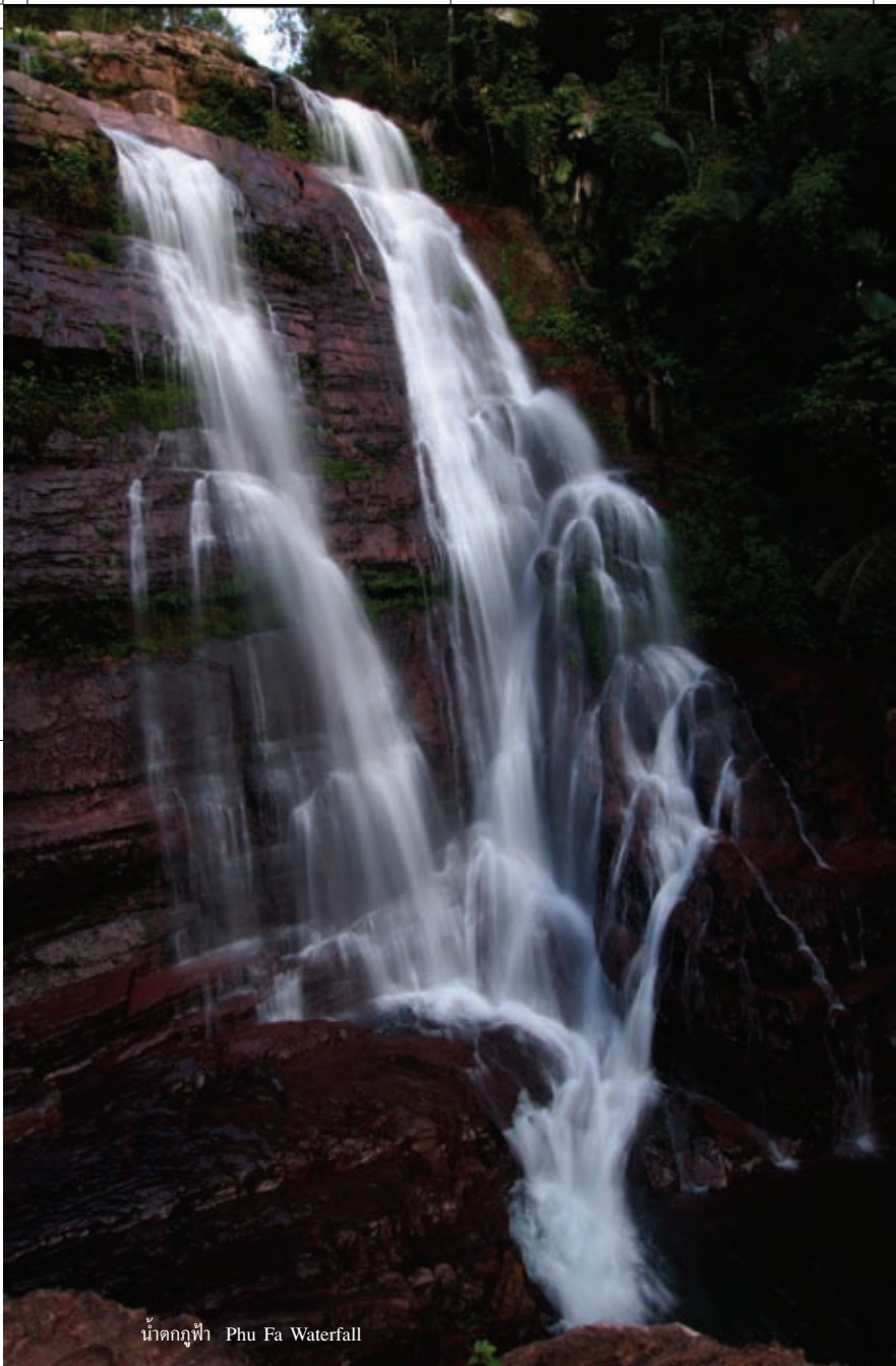
น้ำตกภูฟ้า Phu Fa Waterfall