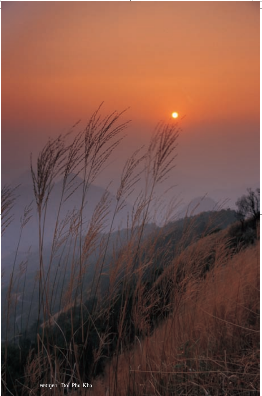
ดอยภูกา Doi Phu Kha