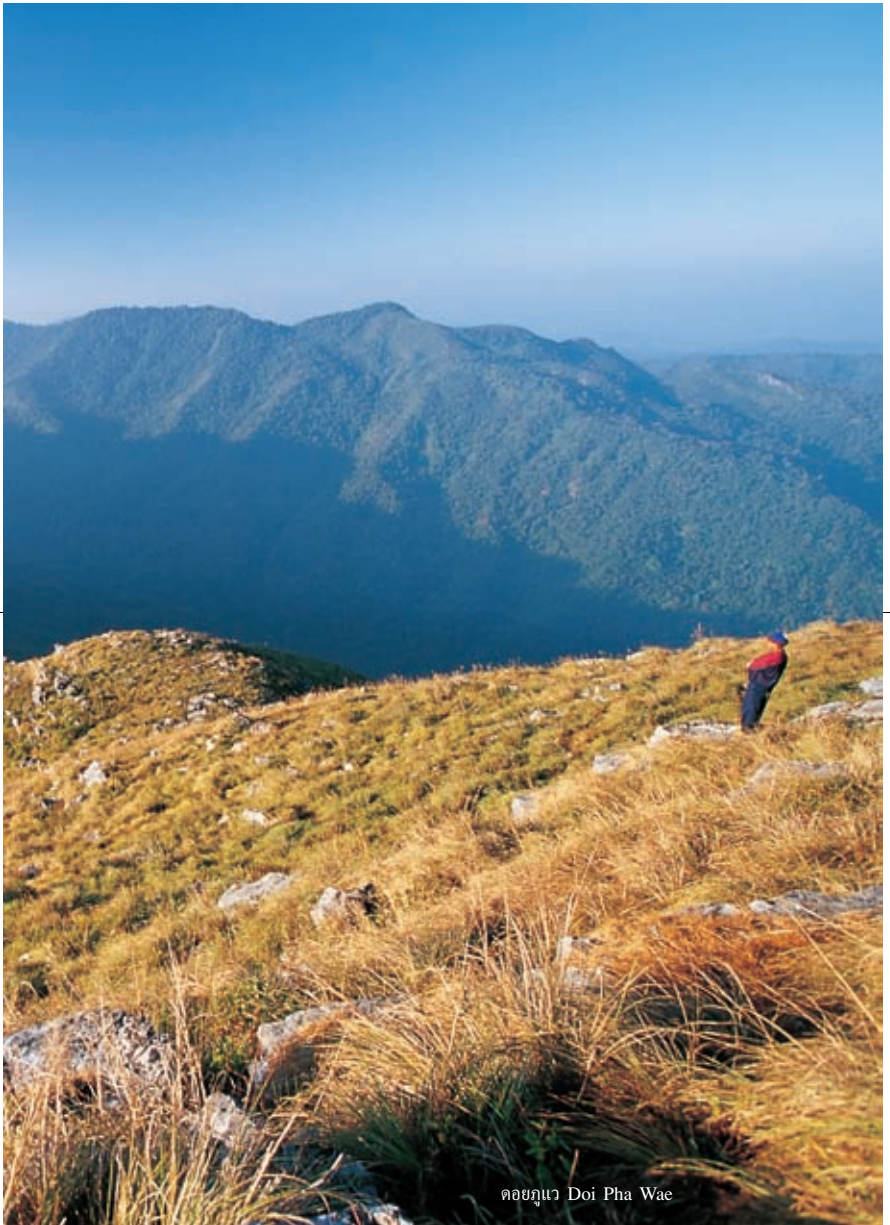
ดอยภูหนาว Doi Pha Wae