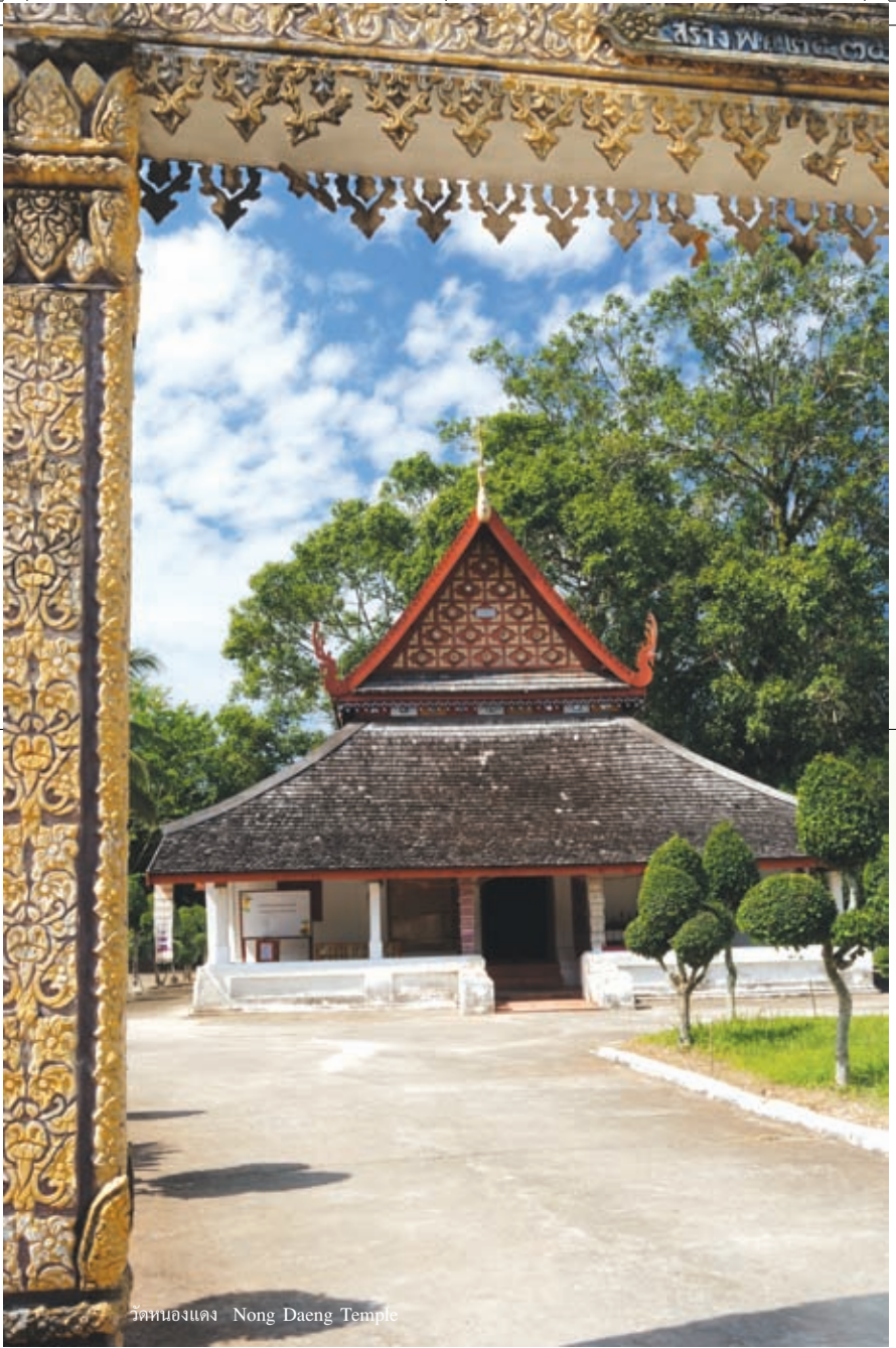
วัดหนองแดง Nong Daeng Temple