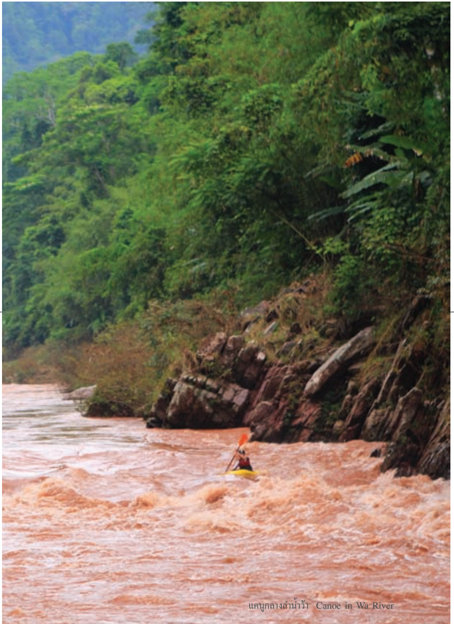
แคนูกลางถ้ำน้ำว้า Canoe in Wa River