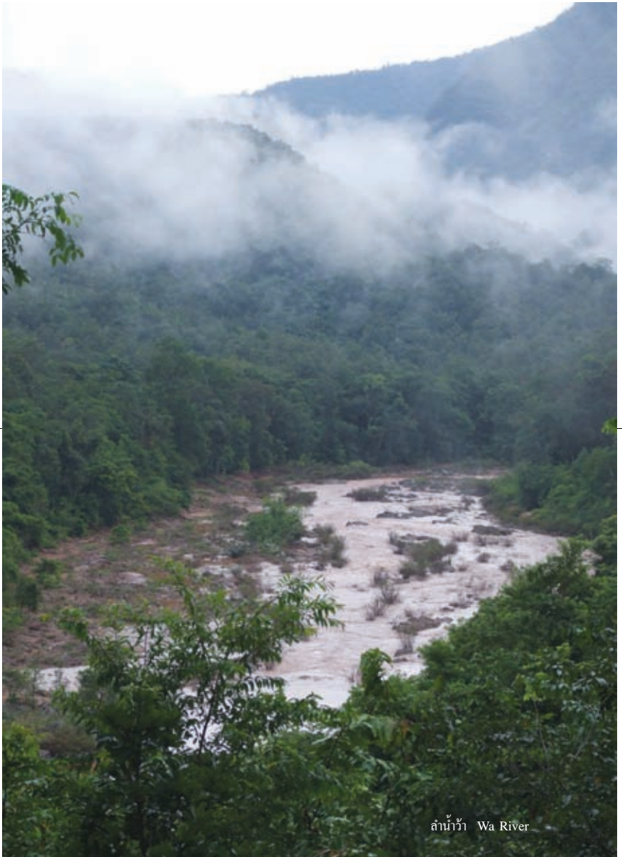
ลำน้ำว้า Wa River