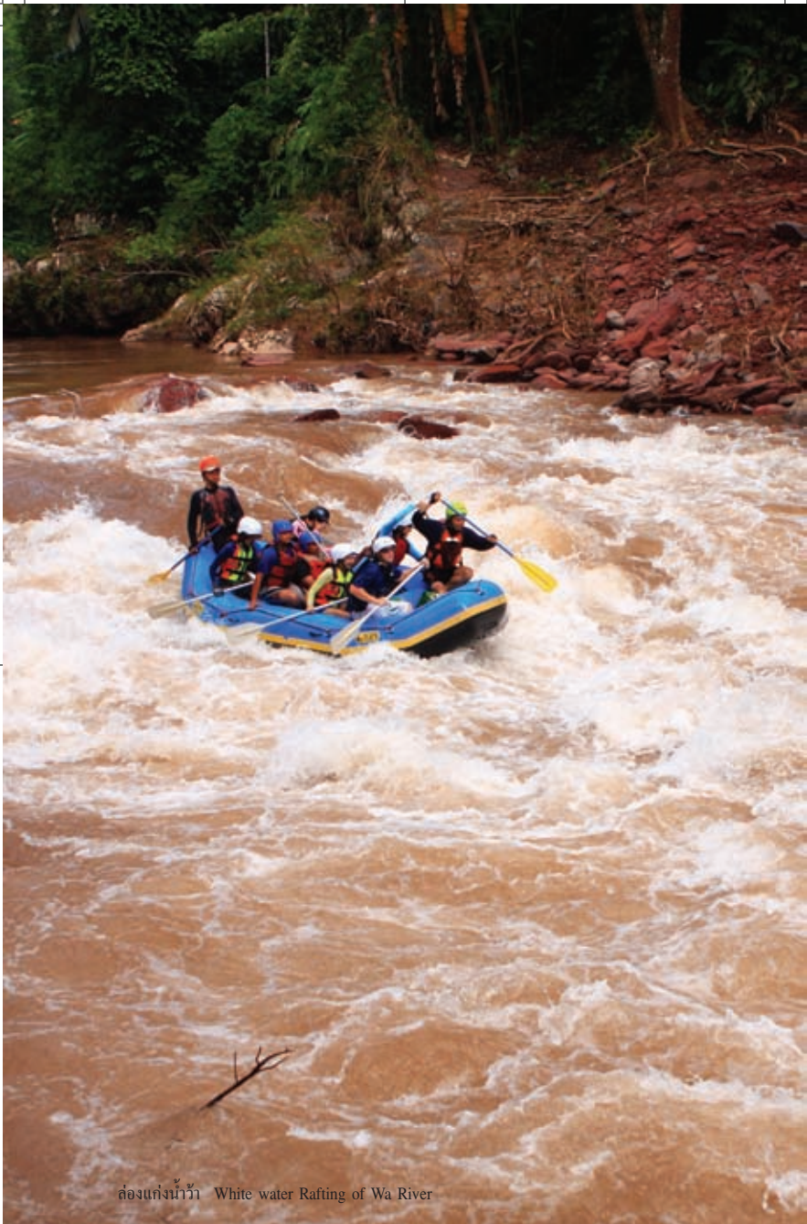
ท่องเที่ยวที่น้ำว้า White water Rafting of Wa River