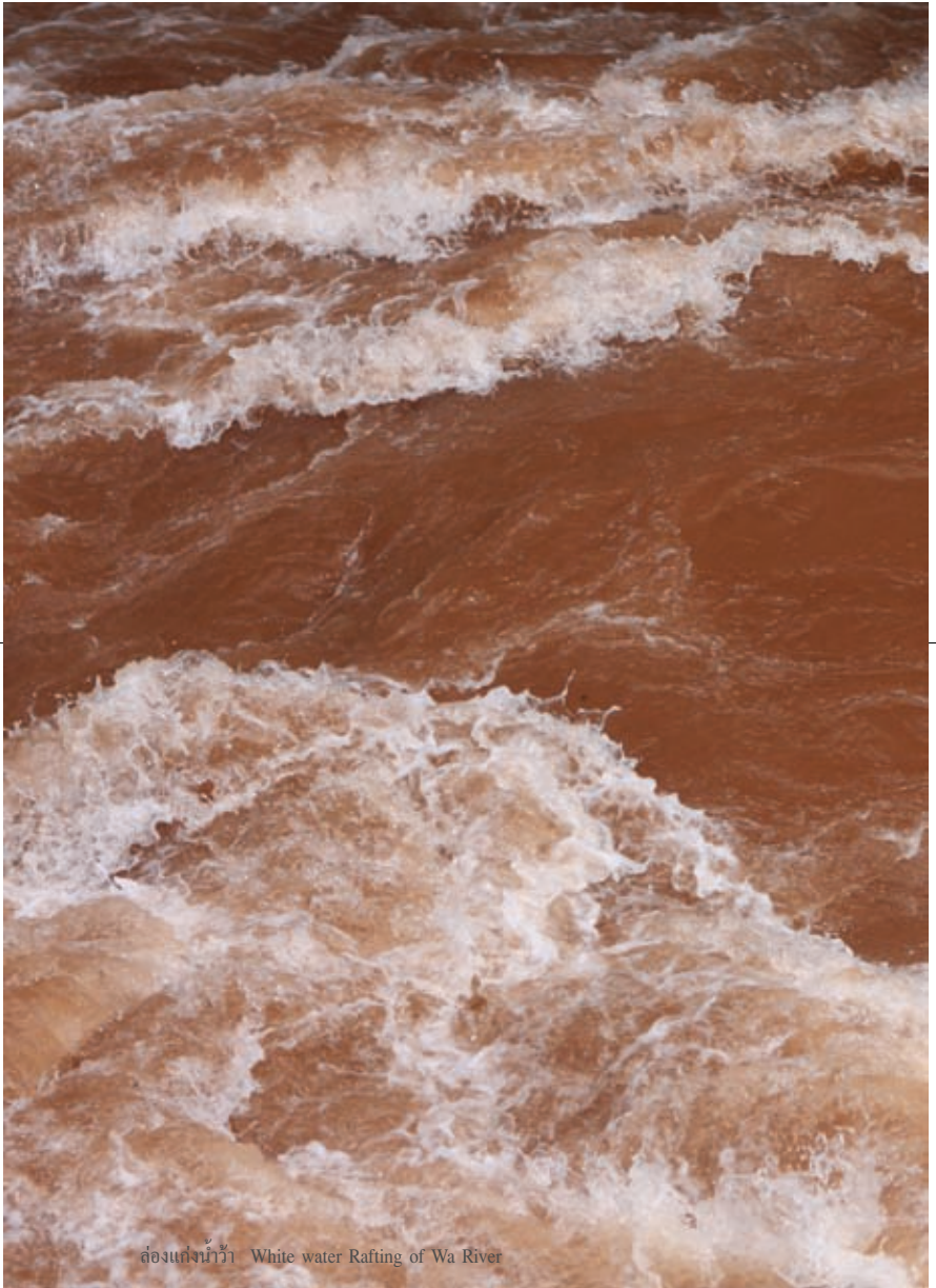
ท่องถ้ำน้ำว้า White water Rafting of Wa River