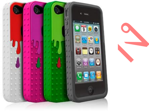
รูปแสดงเคสไอโฟน 4 ซึ่งมีให้เลือกหลายแบบ หลายราคา