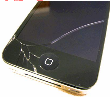
รูปแสดงรอยแตก ที่เกิดจากการตก