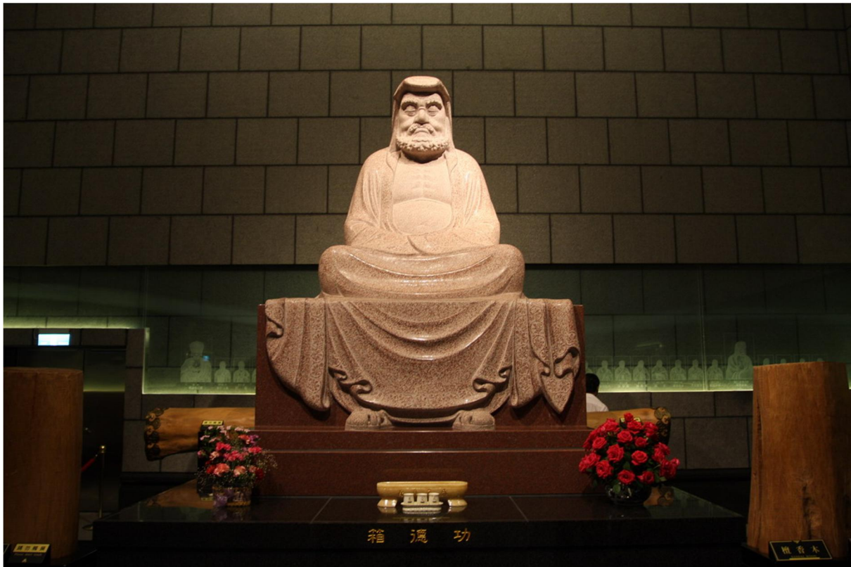
พระโพธิธรรม

นิกายเซ็นเข้ามาในญี่ปุ่นในสมัยของสังฆปริณายกองค์ที่สามตามการนับทางฝั่งจีน คำว่าเซ็นนี้ก็เป็นการเพี้ยนเสียงต่อกันมาเรื่อยๆ จากคำว่า "ฉาน" ในอินเดีย เมื่อสืบทอดไปที่จีนก็เรียกเพี้ยนเสียงเป็น "ฉาน" และเมื่อมาถึงญี่ปุ่นจึงเรียกเพี้ยนเสียงเป็น "เซ็น"