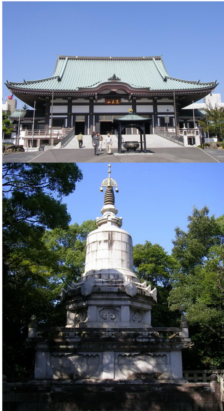
วัดนิตไทยจิ

อาจารย์ก็ตั้งใจเด็ดเดี่ยวที่จะมาเดินจุดศรัทธาแล้วก็จะไม่ยอมแพ้กระแสน ไม่ยอมแพ้กระแสลม คือไม่ย่อ ท้อต่ออุปสรรคทั้งปวงเหมือนกัน