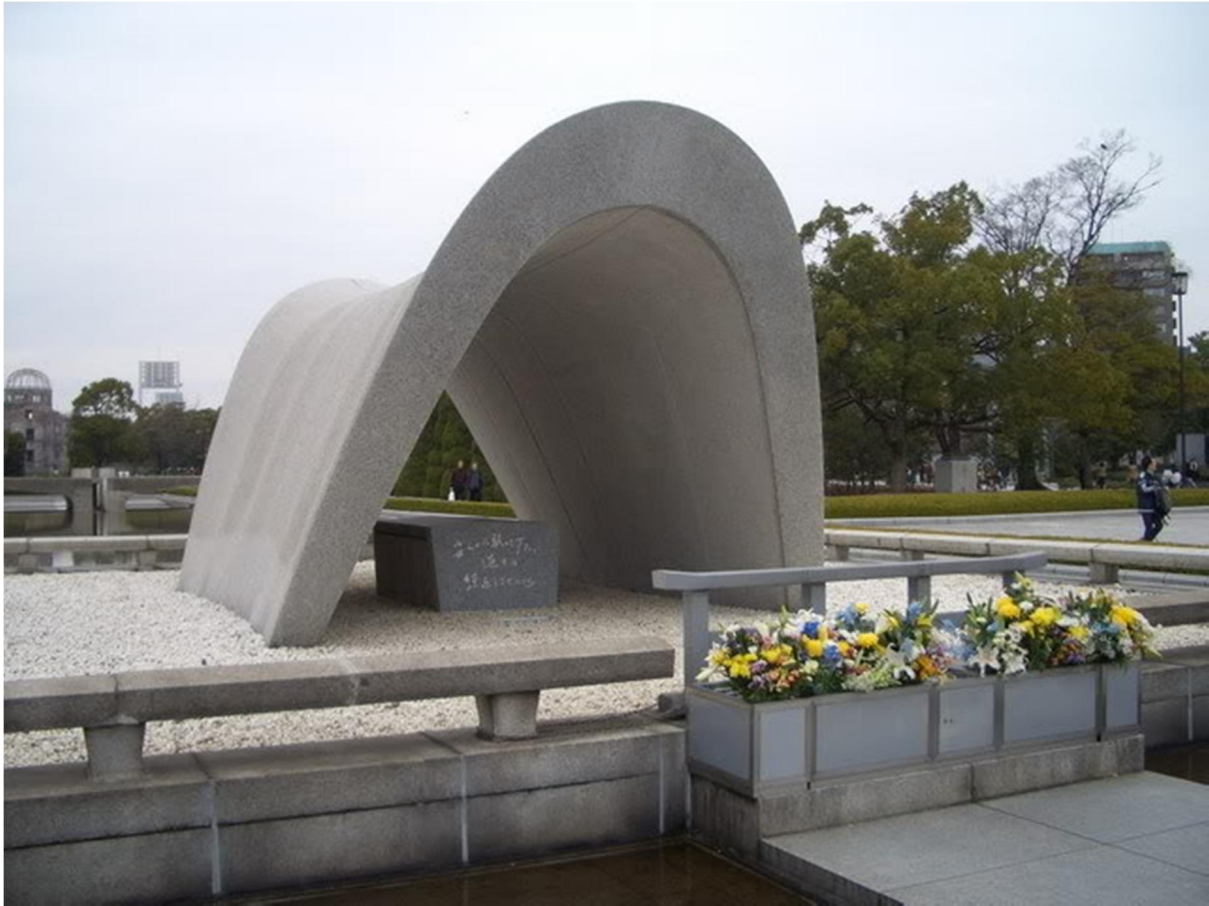
อนุสาวรีย์ทรงอานม้าในบริเวณ Peace Memorial Park

ตอนช่วงเช้าของวันที่ 25 มิถุนายน 2532 อาจารย์ก็บินชบาตอยู่ในตัวเมืองฮิโรชิมาแล้ว ทางสถานีโทรทัศน์ก็ตามมาถ่ายสารคดีด้วย วันนั้นมีโยมศรัทธามาใส่บาตรเยอะมาก ไม่นานอาหารก็ค่อนข้างจะเต็มบาตร ทีมถ่ายทำสารคดีบอกว่า เพราะชาวเมืองฮิโรชิมามีนิสัยชอบช่วยเหลือคนเดินทาง คู่กันเคยกับการอนุเคราะห์อาคันตุกะ