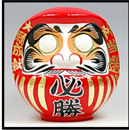
ตุ๊กตาดารูมะ