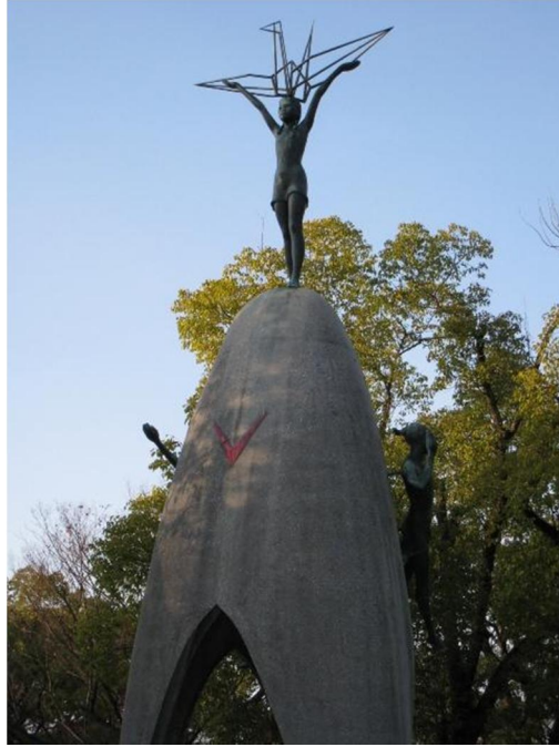
อนุสาวรีย์รำลึกถึง ซาดาโกะ ซาซากิ