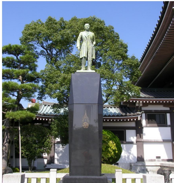
อนุสรณ์ขององค์รัชกาลที่ 5 ที่วัดนิทไทยจิ

ตัวเอง มีแต่เจ้าหน้าที่ดูแลรักษาความปลอดภัยอยู่เท่านั้น อาจารย์เลยสวมมณฑัสการะพระบรมสารีริกธาตุ สั้นๆ ก่อนออกหาที่พักสำหรับคืนนี้ต่อ