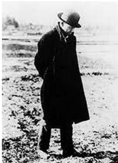
มियाซาว่า เคนจิ

สารคดียาว 1 ชั่วโมง พอออกอากาศแล้วก็มียอดวิว 17 เปอร์เซ็นต์ คือจากคนดูที่วีร้อยกว่าล้านคน มีคนดูสารคดีนี้ 17 ล้านคน ยอดวิวสูงมากพอสมควร