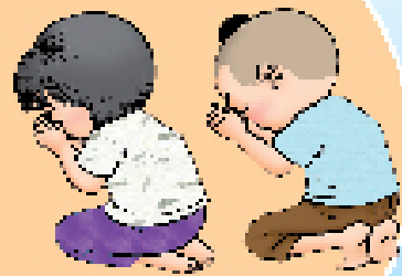
๘๓ สวดมนต์นันทนักรรณ ช่างาพิตเป็นสุา