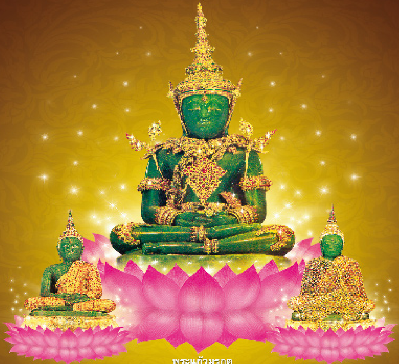
พระแก้วมรกต ทรงเครื่องประจำฤดูฝน