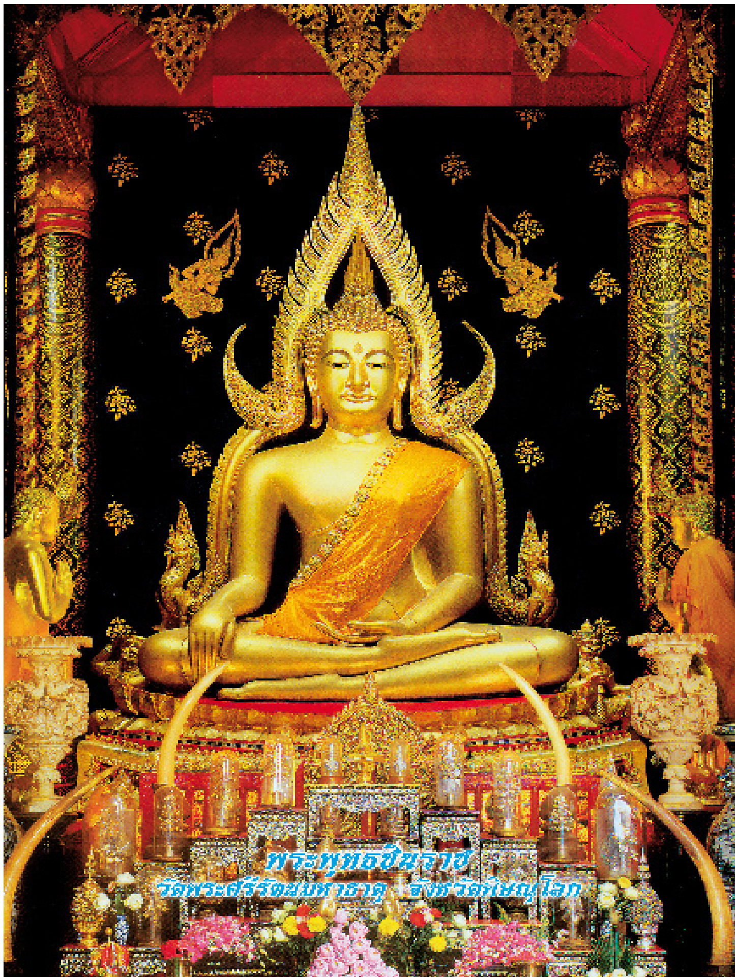
พระพุทธรูปชัยราชัย วัดพระศรีรัตนศาสดาราม กรุงเทพมหานคร จังหวัดพระนครศรีอยุธยา