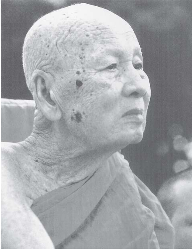
หลวงปู่เทศก์ เทสรังสี (พ.ศ. ๒๔๔๕-๒๕๒๗)