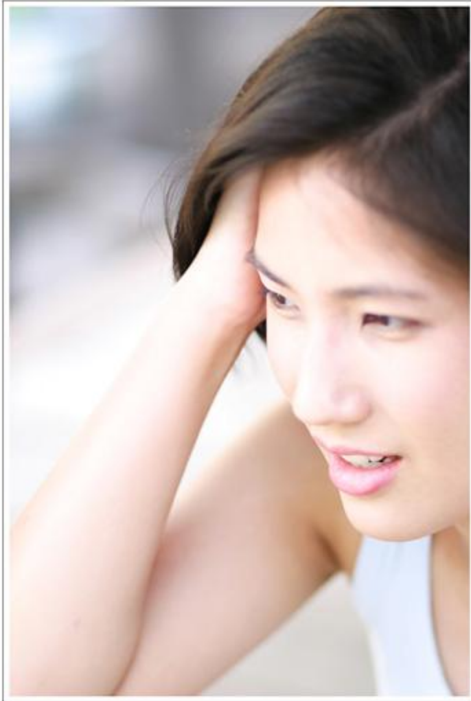
デジタル一眼レフカメラで撮る。 SAENGBOON SAENGBOON ISLAND