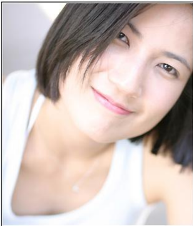
CANON 10D THE ART OF DIGITAL PHOTO IN YOUR HAND EF 85 mm f1.8 USM