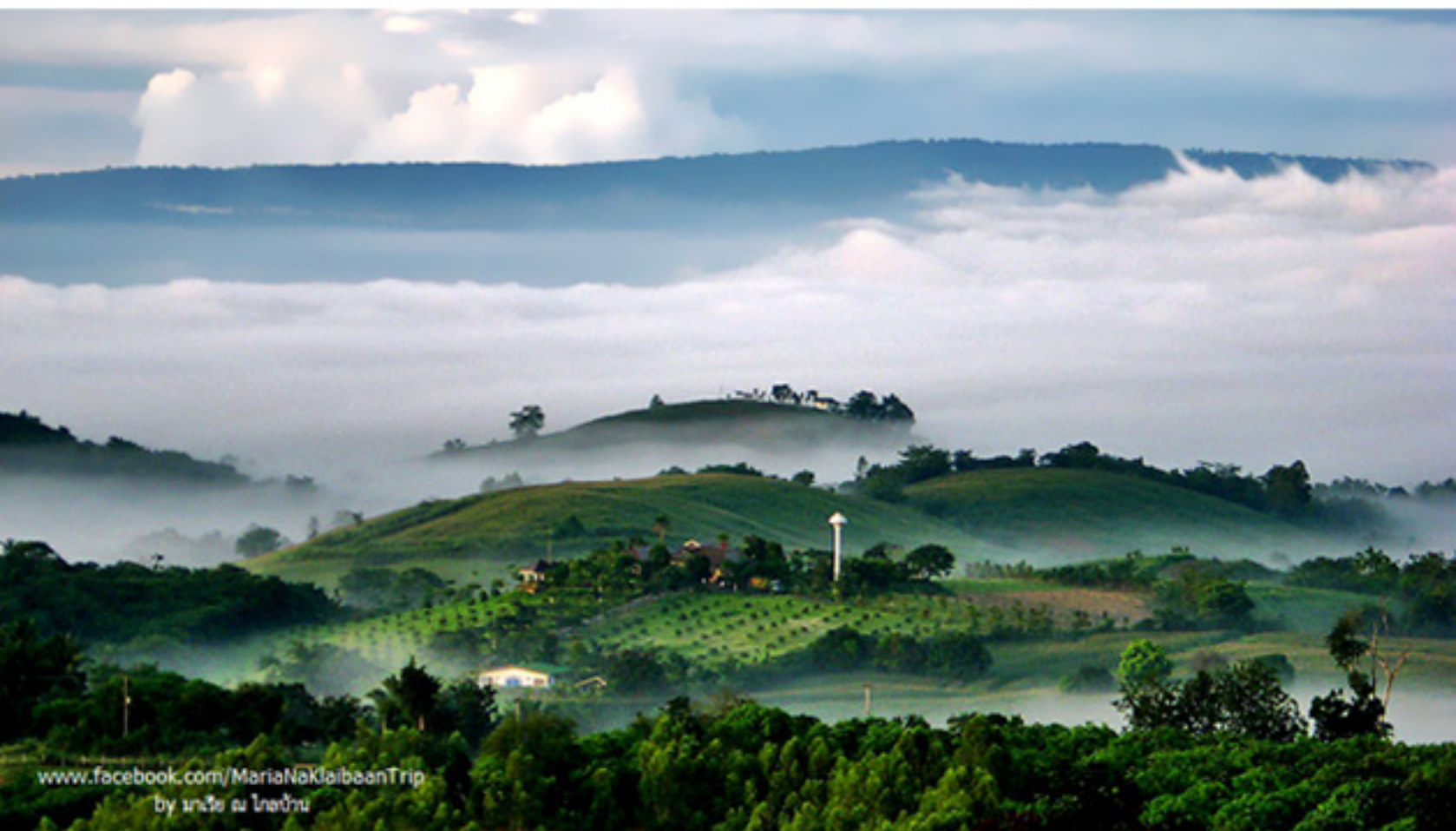
www.facebook.com/MariaNaKlaibeanTrip by มาเรีย ณ ไนบ้าน

รูปนี้ถ่ายจากกล้องคอมแพ็คตัวเก่า เป็นไฟล์รูปที่ไม่สวยเนียนเหมือนรูปจากกล้องตัวใหญ่ แต่เป็นรูปที่เก็บความทรงจำที่สวยงามเอาไว้ เต็มกระปุกอมสินแห่งความทรงจำของตัวเองตลอดมา ทริปสุขสันต์ธรรมชาติของครอบครัวมี พ่อ แม่ ลูก มีความรัก รอยยิ้ม เสียงหัวเราะ ความสดชื่น ความตื่นตาตื่นใจกับภาพหมอกลอยอ้อยอิ่ง กลางหุบเขาใกล้เมืองหลวง ณ บ้านภูรินทร์ เขาใหญ่ ไม่เคยคิดว่าจะเห็นภาพที่สวยงามตรงหน้าแบบนี้ ได้ใกล้กรุงเทพฯขนาดนี้ และที่พิเศษ คือ เป็นทริปที่เป็น จุดเริ่มต้นของการรีวิวในท้อง Blue Planet ในพันทิป และเพราะรีวิวนี้เอง ที่เป็นจุดเริ่มต้นของมิตรภาพออนไลน์ ที่สวยงาม กับการได้พบเจอเพื่อนพี่น้องที่น่ารักในเวลาต่อมา