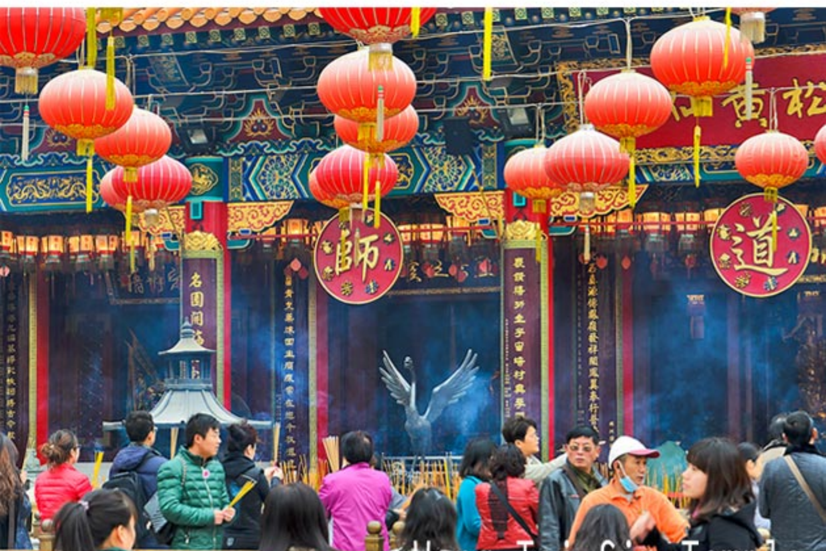
Wong Tai Sin Temple