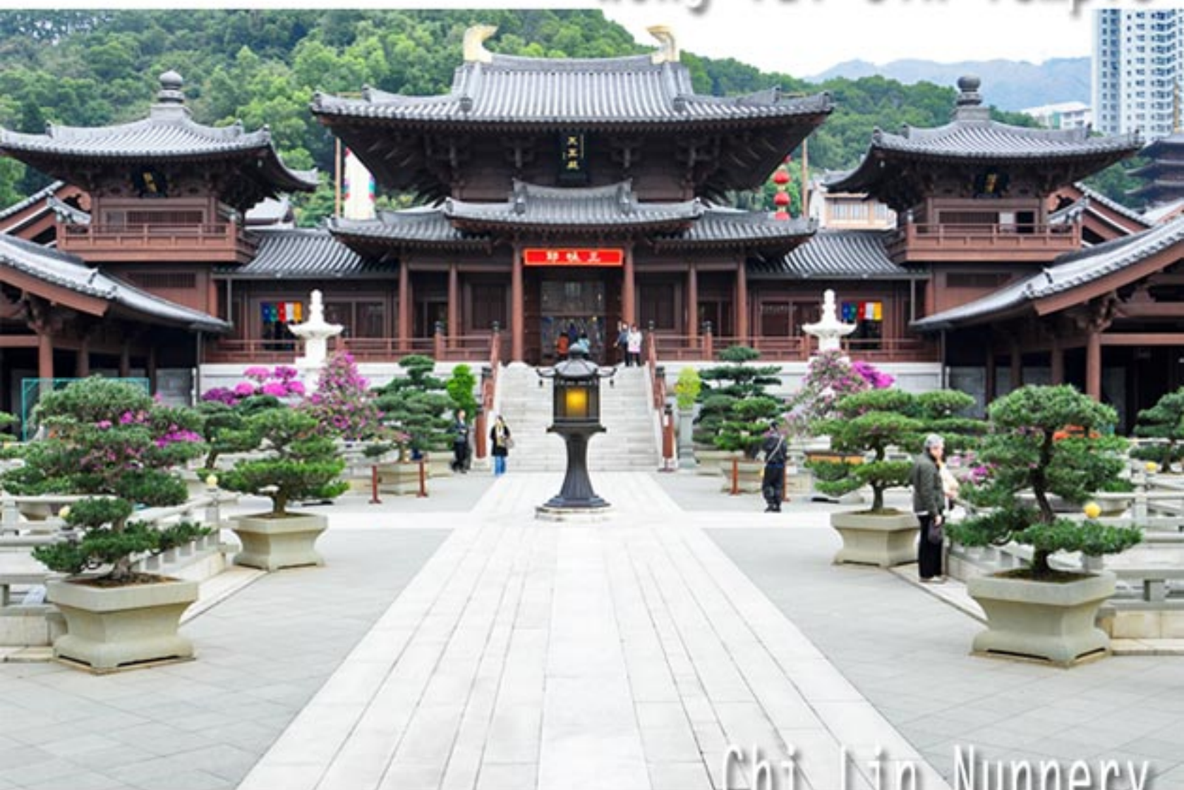
Chi Lin Nunnery