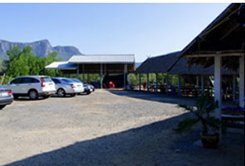
ลานจอดรถกว้างพอสมควร จอดรถสบาย

64 ม.7 (นาทุ่งบางปู) ต.สามร้อยยอด อ.สามร้อยยอด จ.ประจวบคีรีขันธ์ (พิกัด N12.19420° E99.99381°)