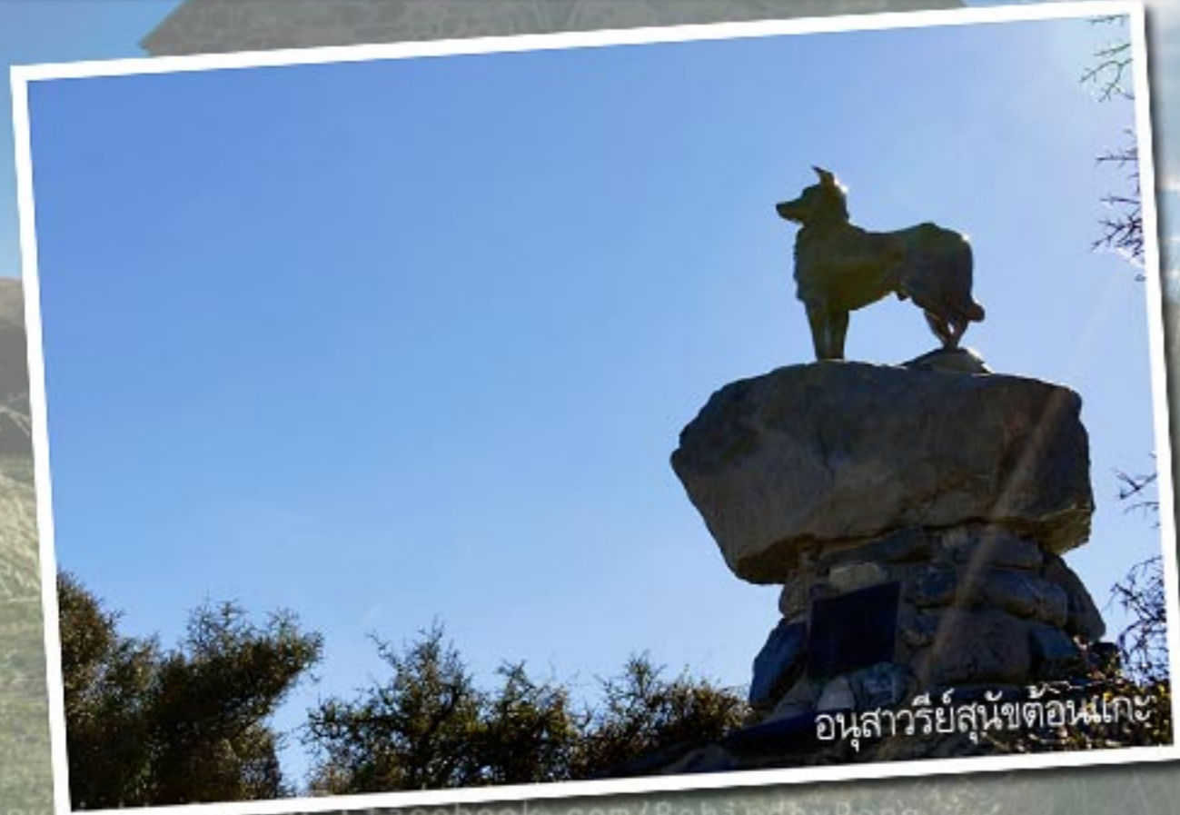
อนุสาวรีย์สุนัขต้อนแกะ