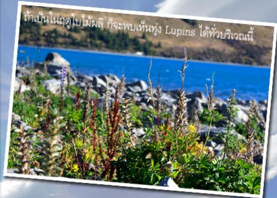
ถ้าเป็นในฤดูใบไม้ผลิ ก็จะพบเห็นทุ่ง Lupins ได้ทั่วบริเวณนี้