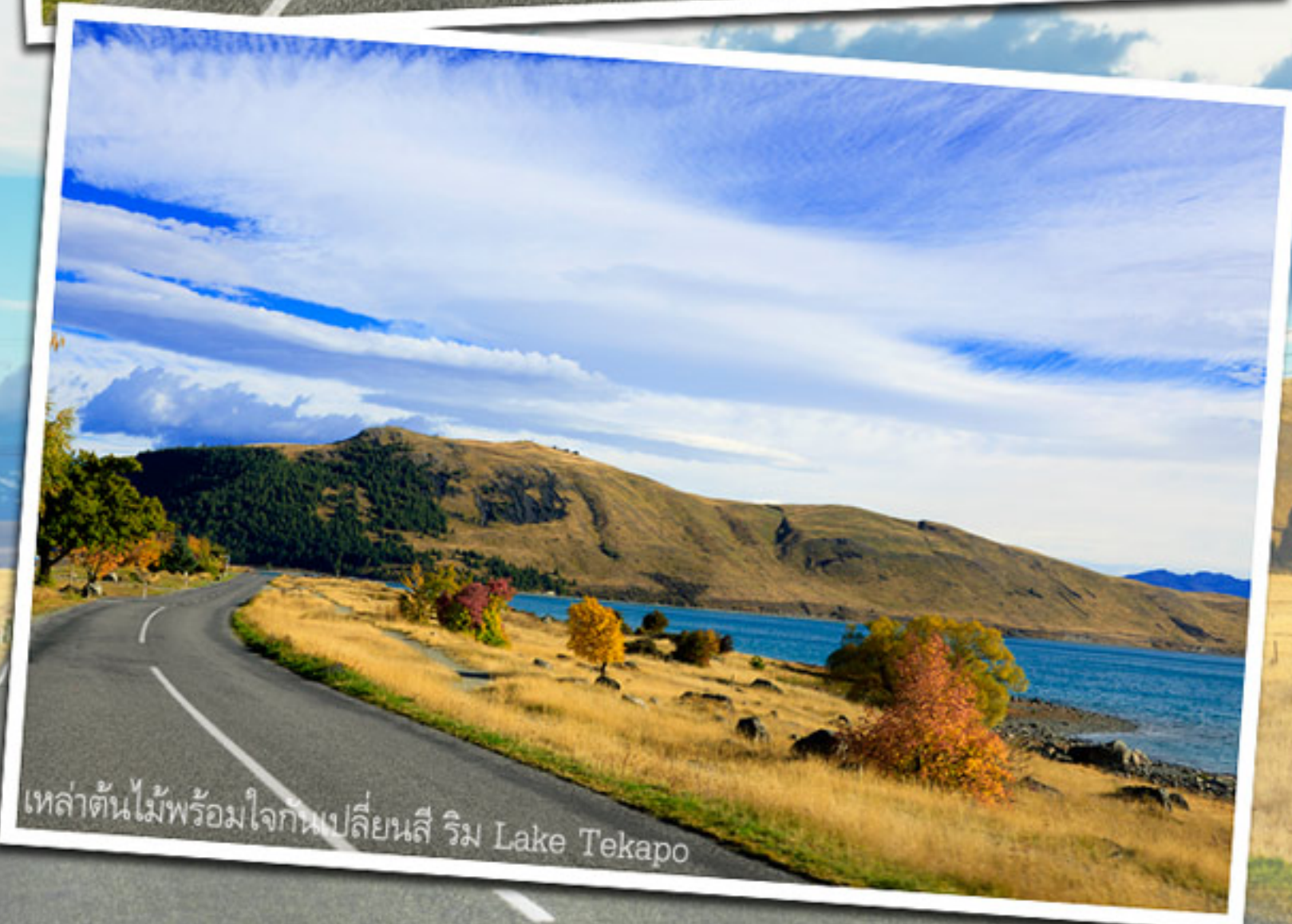
เหล่าต้นไม้พร้อมใจกันเปลี่ยนสี ริม Lake Tekapo