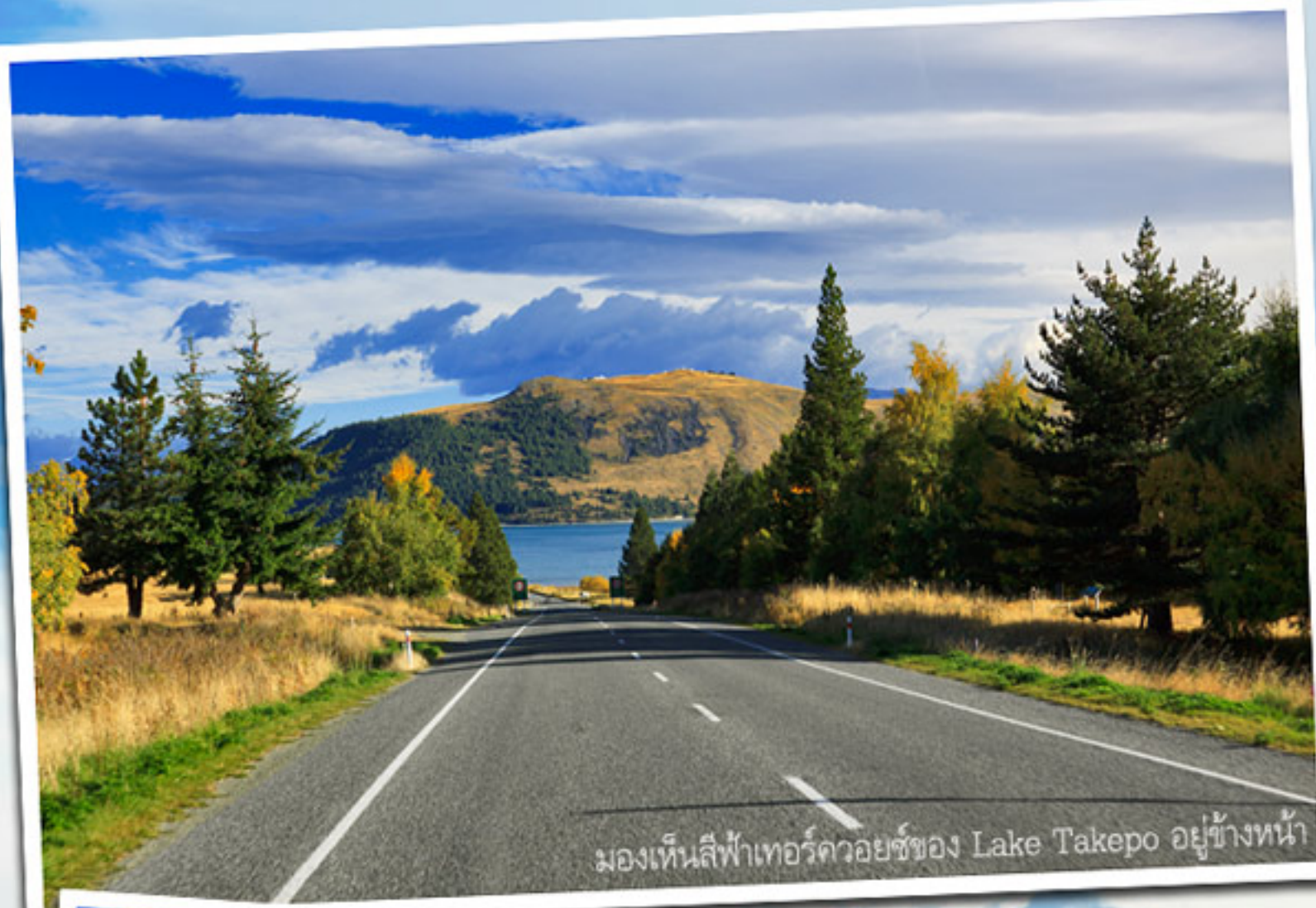
มองเห็นสีฟ้าเทอร์ควอยซ์ของ Lake Tekapo อยู่ข้างหน้า