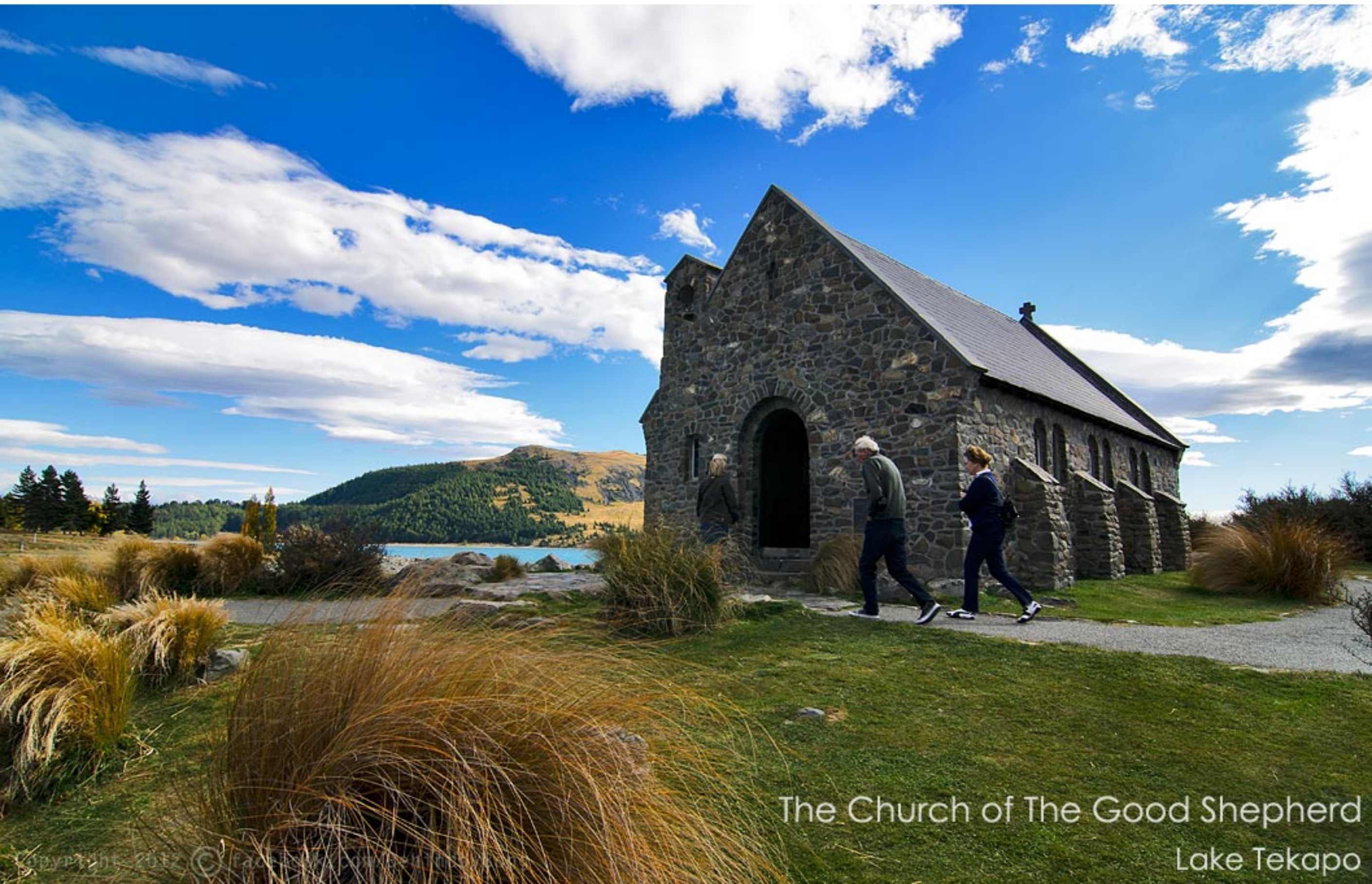
The Church of The Good Shepherd