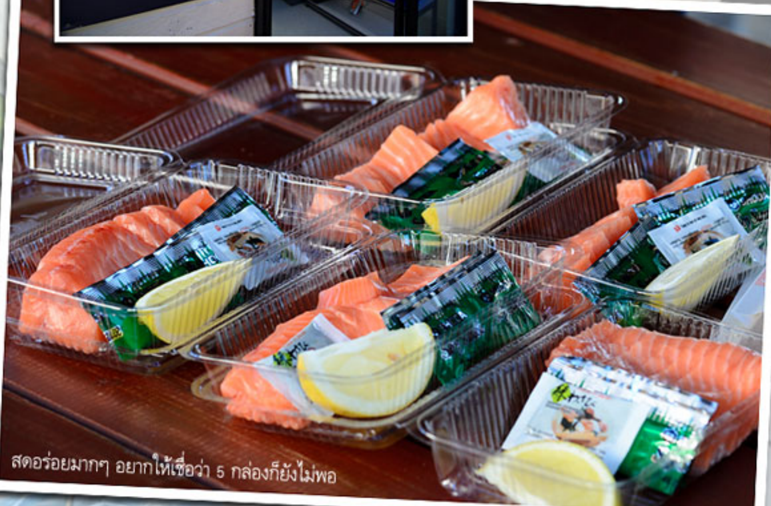
สตอร์รี่มากๆ อยากให้เชื่อว่า 5 กล่องก็ยังไม่พอ