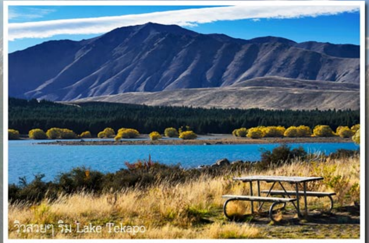
วิวสวยๆ ริม Lake Tekapo