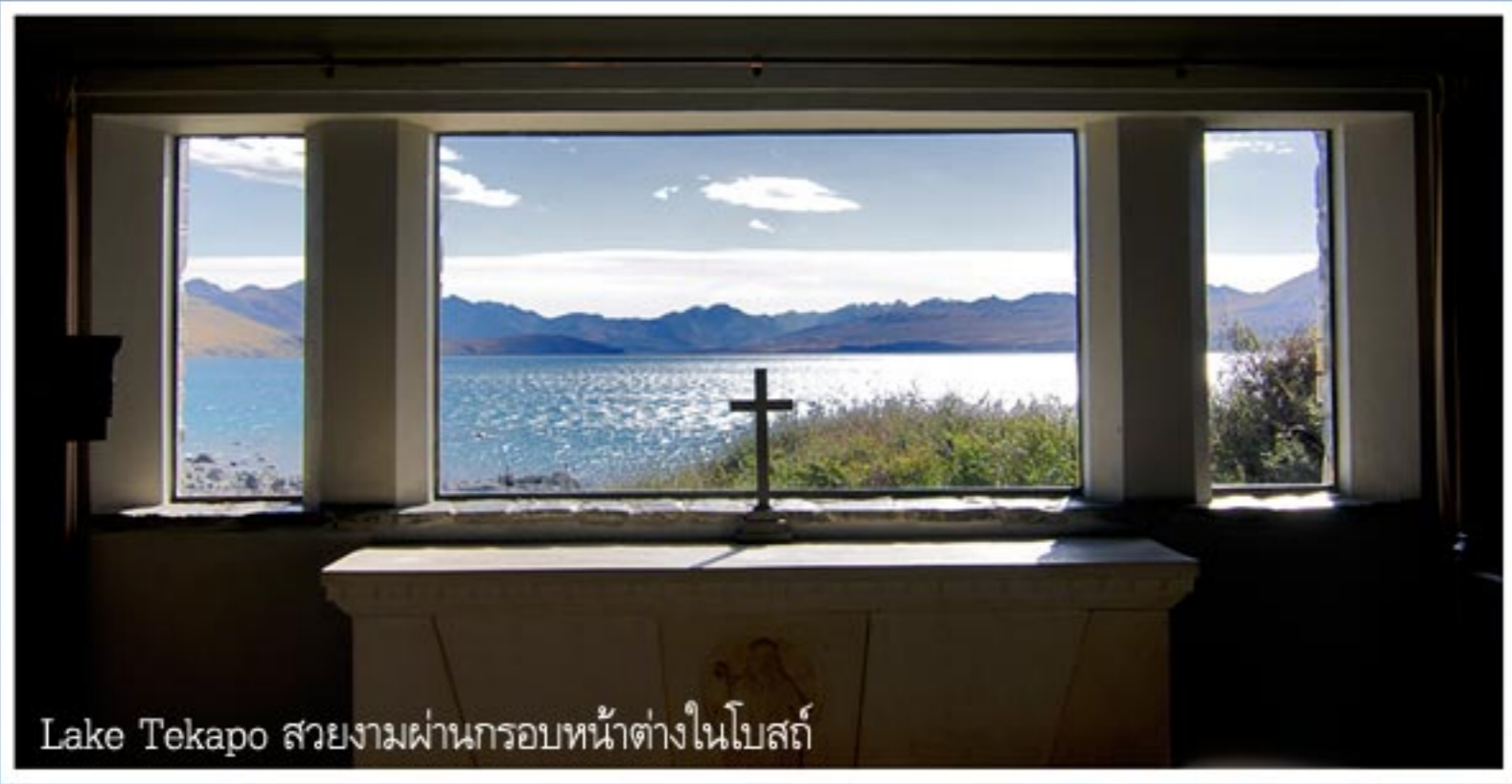
Lake Tekapo สวยงามผ่านกรอบหน้าต่างโบสถ์