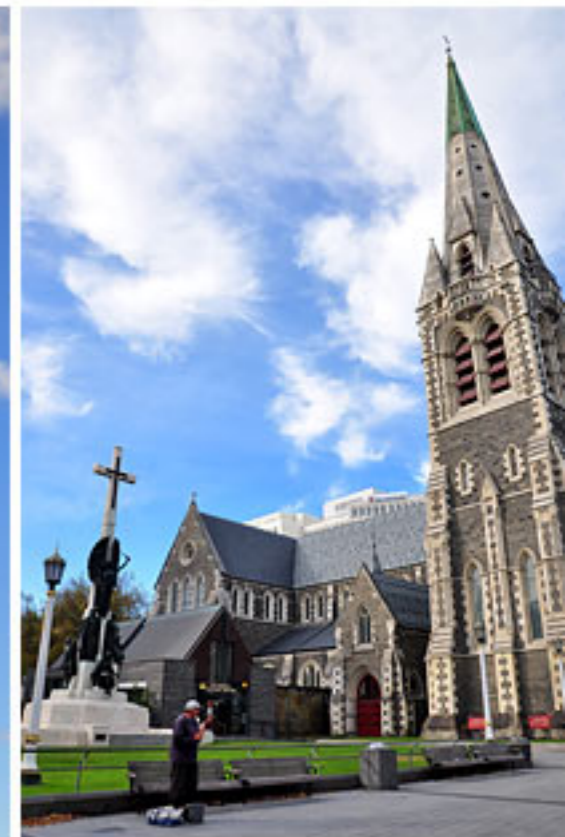
“ Christchurch Cathedral ” โบสถ์คู่เมือง Christchurch ที่ กลายเป็นอดีตไปแล้ว