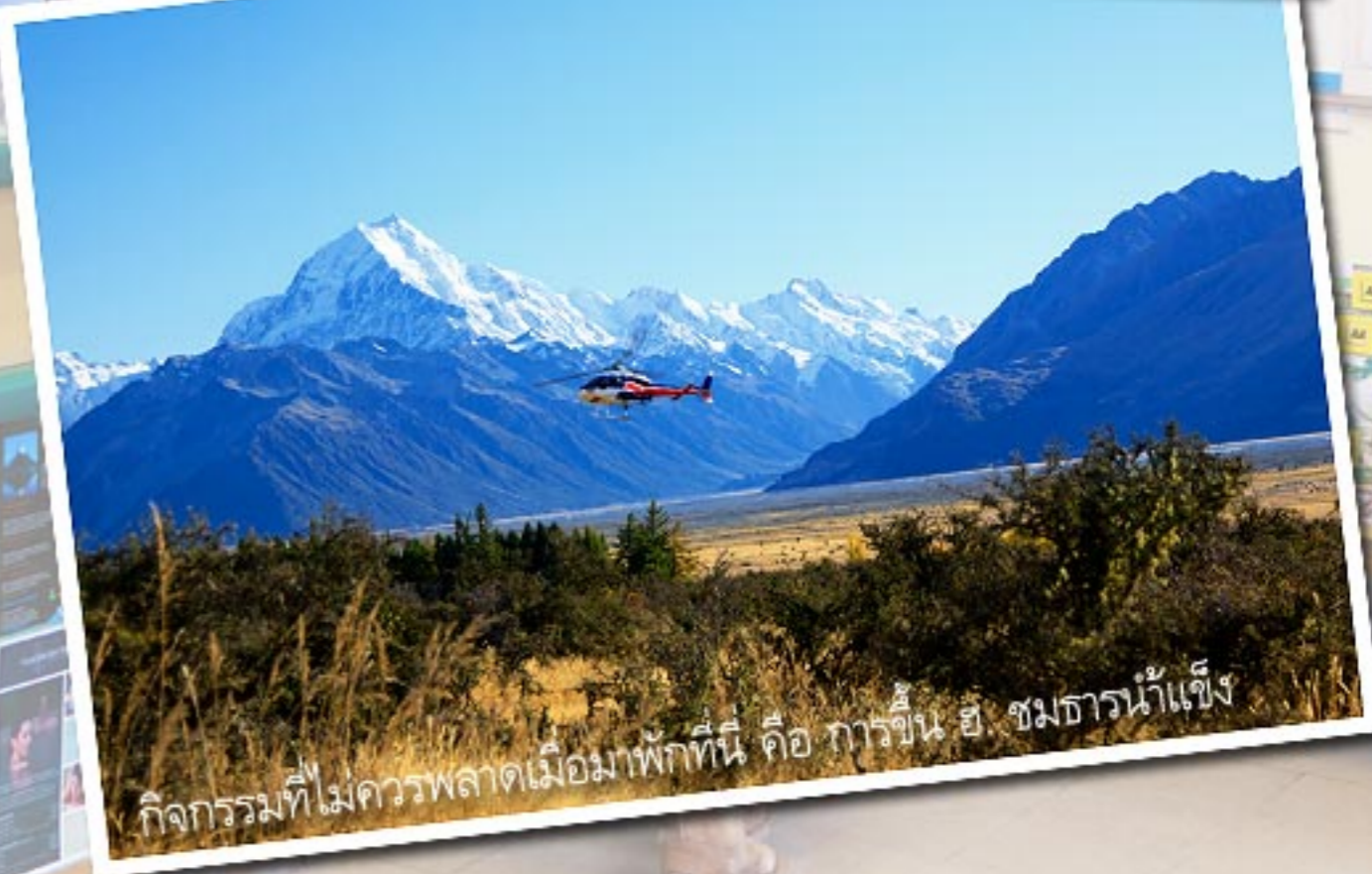
กิจกรรมที่ไม่ควรพลาดเมื่อมาพักที่นี่ คือ การขึ้น ฮ ชมธารน้ำแข็ง