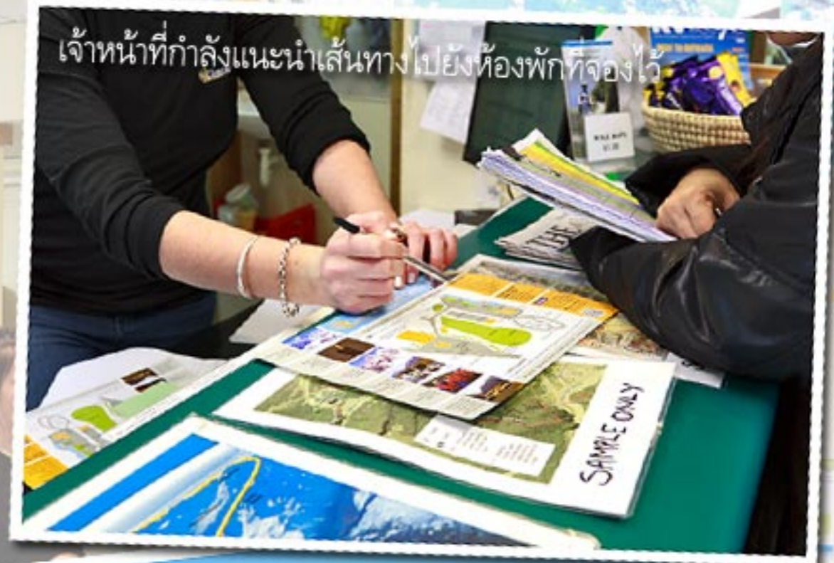
เจ้าหน้าที่กำลังแนะนำเส้นทางไปยังห้องพักรักที่จองไว้