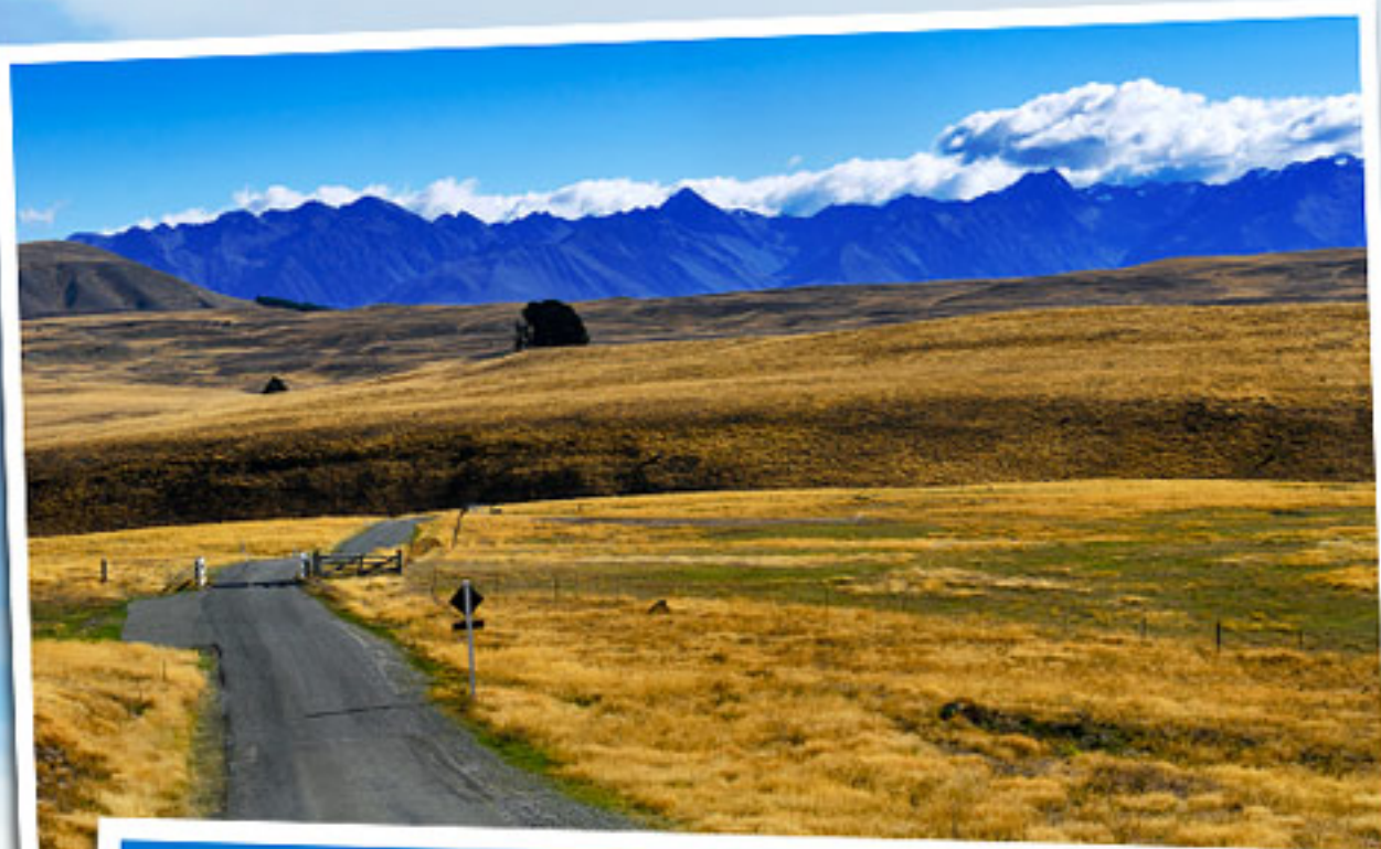
วิวทัศนระหว่างทางขึ้นและลง Mt John Observatory สวยงามเกินคำบรรยาย