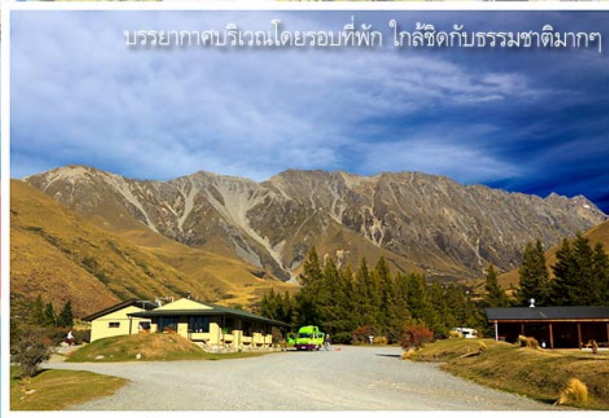
บรรยากาศบริเวณโดยรอบที่พัก ใกล้ชิดกับธรรมชาติมากๆ