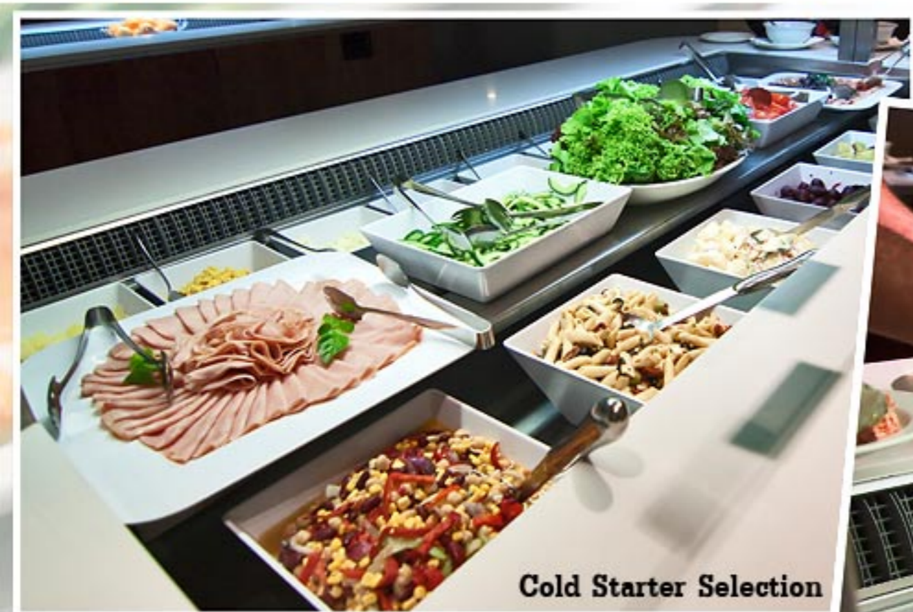
Cold Starter Selection