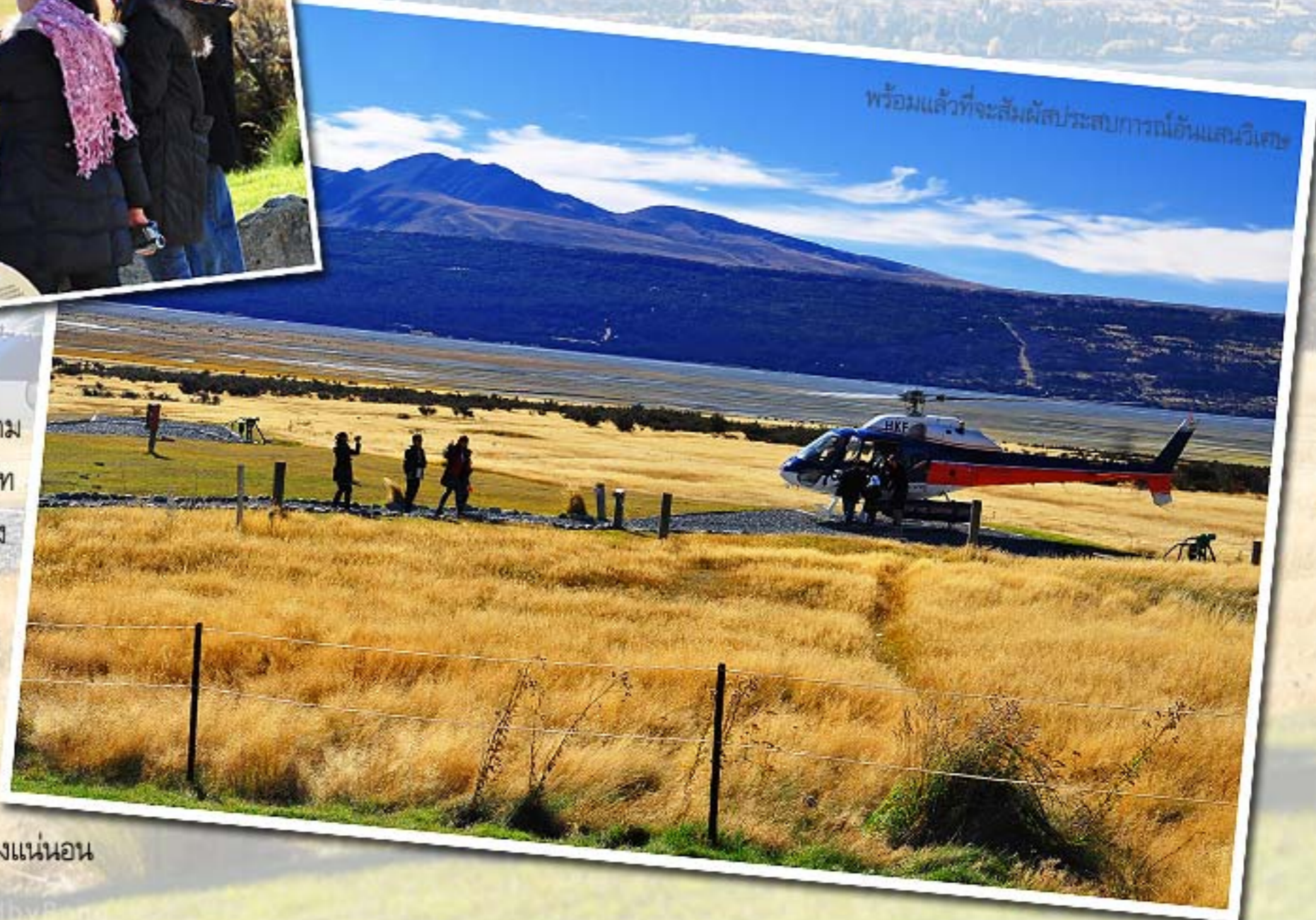
พร้อมแล้วที่จะสัมผัสประสบการณ์อันแสนวิเศษ

เวลาของเที่ยวบิน คือ 11.00 น. พวกเราจะต้องมาเตรียมความพร้อมก่อนล่วงหน้าประมาณ 15 นาที โดยเจ้าหน้าที่ของบริษัทจะอธิบายถึงกฎข้อบังคับและข้อควรปฏิบัติระหว่างการขึ้นลงและอยู่บนเฮลิคอปเตอร์ให้เราทราบ ซึ่งแน่นอนว่าเราจะต้องปฏิบัติตามอย่างเคร่งครัด ทั้งนี้เพื่อความปลอดภัยของตัวเราเอง โดยเฉพาะเรามีเด็กร่วมเดินทางด้วย จึงจำเป็นต้องดูแลอย่างใกล้ชิด และถือเป็นโชคดีของ Behind และคณะหลายๆ ที่อากาศแจ่มใส ท้องฟ้าปลอดโปร่งเป็นใจอย่างมาก มั่นใจว่าเราจะต้องได้ภาพสวยๆ ของวิวมุมสูงมาฝากคุณผู้อ่านอย่างแน่นอน