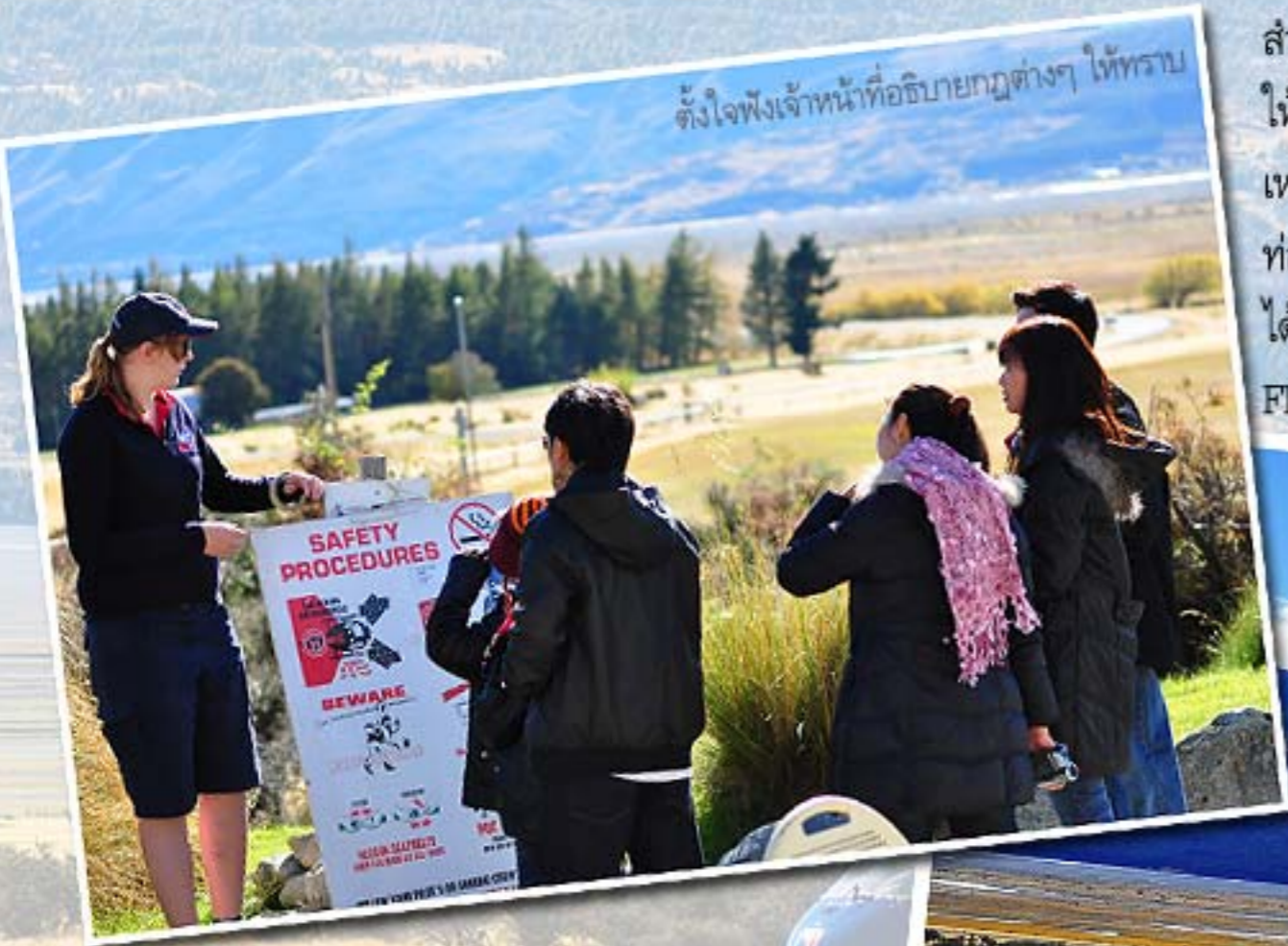
ตั้งใจฟังเจ้าหน้าที่อธิบายกฎต่างๆ ให้ทราบ

สำหรับการมาเที่ยวนิวซีแลนด์ สิ่งที่ไม่ควรพลาด คือ กิจกรรมสนุกๆ นำตื่นเต้นมากมายหลากหลายให้เลือกสรร และในครั้งนี้เองที่ Behind มีโอกาสอันแสนพิเศษได้เข้าร่วมสัมผัสประสบการณ์การบินเหินน่านฟ้า เมฆหมอก ขุนเขาและธารน้ำแข็ง กับ The Helicopter Line หนึ่งในผู้นำด้านการท่องเที่ยวโดยเฮลิคอปเตอร์ของนิวซีแลนด์ โดยเที่ยวบินนี้ถูกจัดขึ้นเพื่อเป็นรางวัลให้กับ Behind ที่ได้เข้าร่วมประกวดภาพถ่าย Mt Cook และได้รับรางวัลชนะเลิศเป็นแพ็กเกจ 45 Minutes - Heli Flight for 2 โดยในการบินครั้งนี้มีเหล่าคณะซื้อแพ็กเกจเพิ่มเพื่อร่วมเที่ยวบินด้วยอีก 4 คน