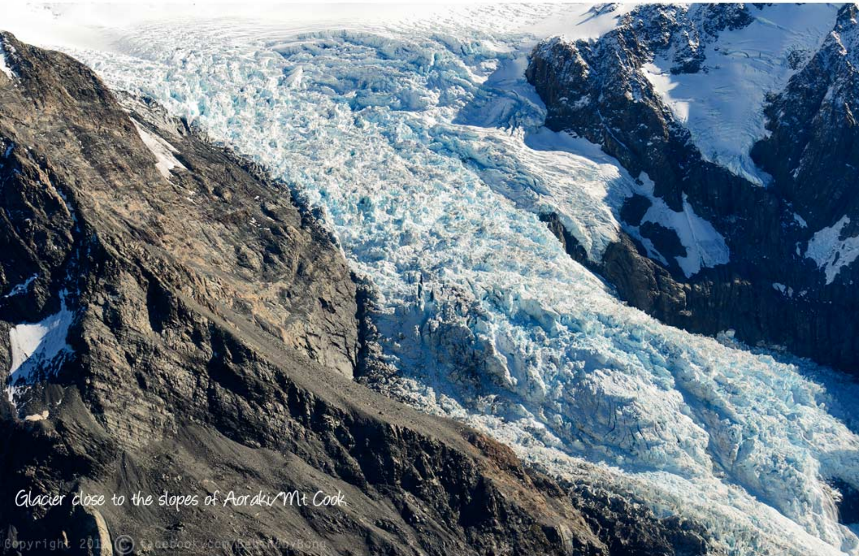
Glacier close to the slopes of Aoraki/Mt Cook