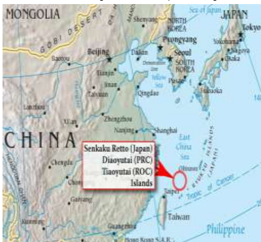
ภาพที่ 1 หมู่เกาะเซนกากุ/เตียวหยู

หมู่เกาะเซนกากุ (尖閣諸島) หรือชื่อในภาษาจีนว่าหมู่เกาะเตียวหยู (钓鱼岛) เป็นหมู่เกาะที่ไม่มีคนอาศัยอยู่ อยู่ในทะเลจีนตะวันออกทางตะวันออกเฉียงเหนือของไต้หวัน ใกล้กับหมู่เกาะริวกิวและเกาะโอกินาวาของญี่ปุ่น ตามประวัติศาสตร์ หมู่เกาะเซนกากุ/เตียวหยู เคยอยู่ภายใต้การปกครองของหลายประเทศ ไม่ว่าจะเป็นจีน อังกฤษ ญี่ปุ่น และสหรัฐอเมริกา ตามลำดับ หมู่เกาะเซนกากุ/เตียวหยู มีทั้งสิ้น 8 เกาะ มีพื้นที่รวม 6.27 ตารางกิโลเมตร โดยคาดว่ามีความสำคัญ คือ น้ำมันดิบ ซึ่งเป็นปัจจัยสำคัญในความขัดแย้ง