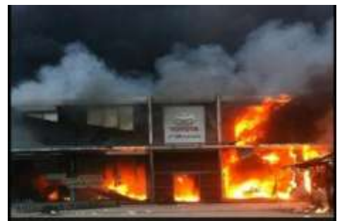
ภาพที่ 6 เหตุเพลิงไหม้โรงงานรถยนต์โตโยต้า จากการชุมนุมประท้วงของชาวจีน

- อย่างไรก็ตาม ความขัดแย้งระหว่างจีนและญี่ปุ่นอาจส่งผลกระทบต่อบรรยากาศการค้า และการลงทุนในภูมิภาคเอเชีย โดยเฉพาะความคืบหน้าในการเจรจาในกรอบ ASEAN+3