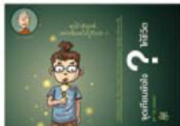
ตอน จุดเทียนอย่างไรให้ชีวิต?