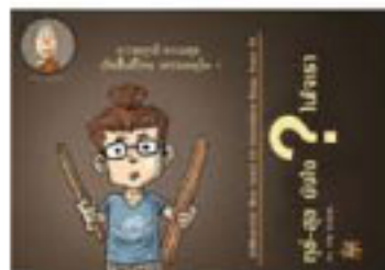
ตอน ทุกข์-สุขอย่างไรในใจเรา?