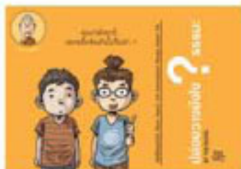
ตอน ปล่อยวางอย่างไรดี?

A THING BOOK ขอเชิญร่วมแบ่งปันธรรมะให้สังคม ในหนังสือชุด ธรรมะธรรมทาน ของ The Duang