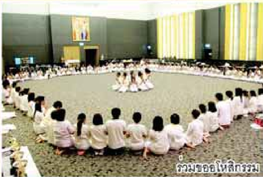
รวมขออโหสิกรรม