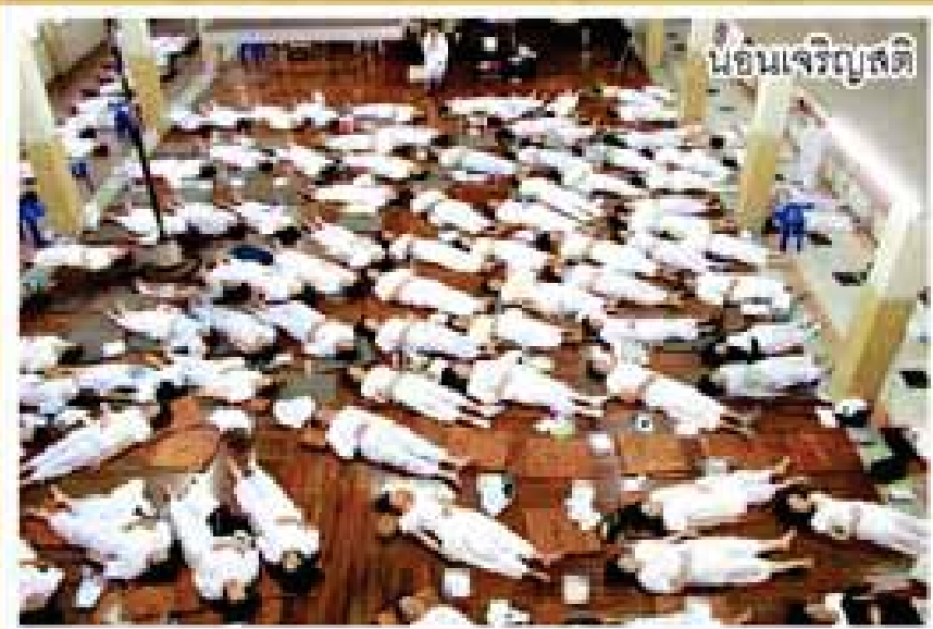
น้อมเจริญสติ