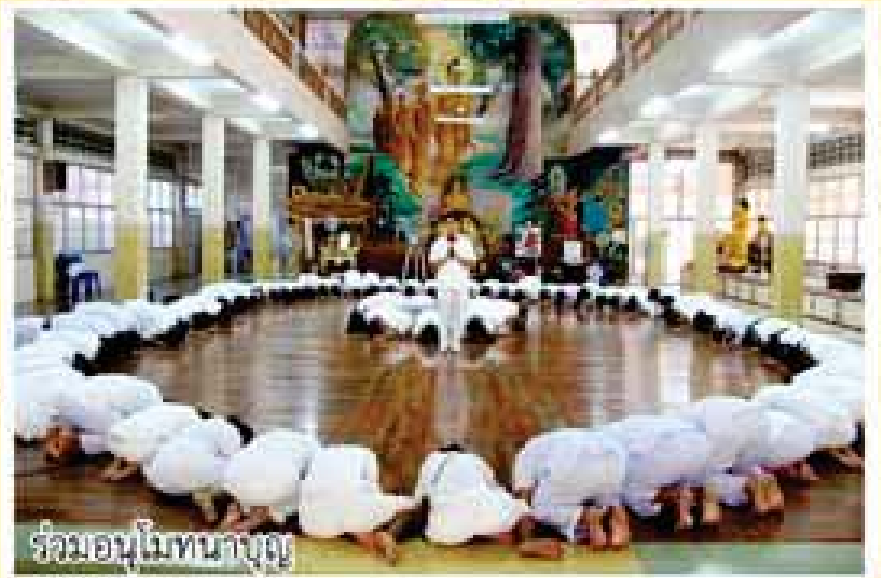
ร่วมอนุโมทนาบุญ