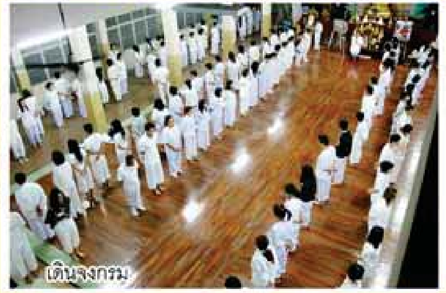
เดินจงกรม