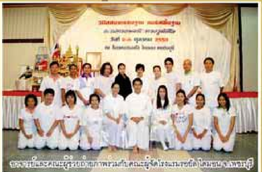
คณะผู้บริหารและบุคลากรของศูนย์จิตตปัญญาศึกษา โรงพยาบาลศิริราช