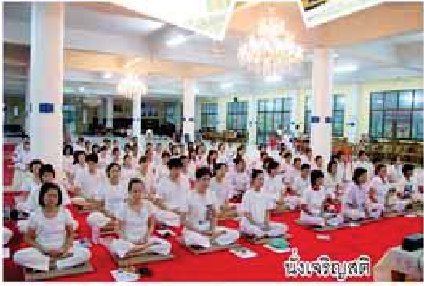
นั่งเจริญสติ