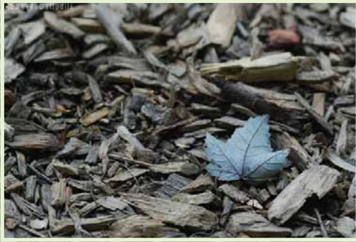
(ขอขอบคุณภาพประกอบโดยฝีมือและความเมตตาของคุณ SevenDaffodils ครับ)

ในบรรดาสิ่งที่ชาวพุทธเรียกกันว่าวัตถุมงคล พระเครื่องน่าจะเป็นของยอดนิยมอันดับหนึ่ง เพราะหาง่ายที่สุด