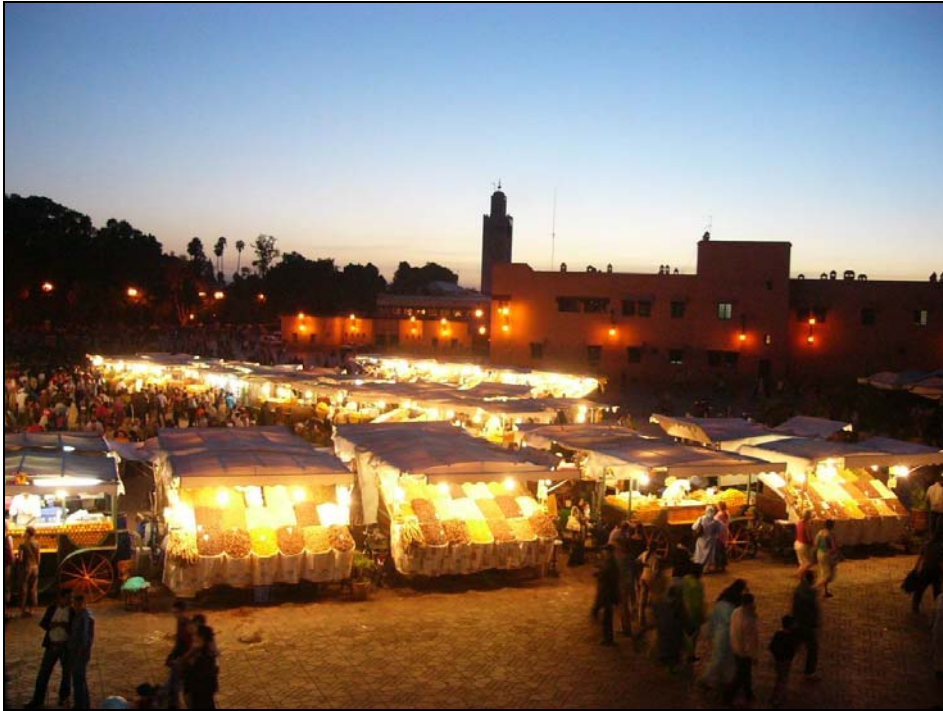
จัตุรัสเจมา เอล์ฟนา (Jemaa el-Fna) มีหอคอยกูดูเบียเป็นทิวทัศน์เบื้องหลัง ที่เมืองมาร์ร่าเกช