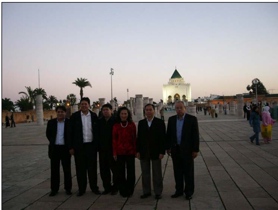
นายจริยวัฒน์ สันตะบุตร รองปลัดกระทรวงการต่างประเทศ (คนที่ 2 จากขวา) และคณะ ระหว่างการเดินทางเยือนโมร็อกโก เบื้องหลังคือสุสานของกษัตริย์โมฮัมหมัดที่ 5 ที่นครราบัต