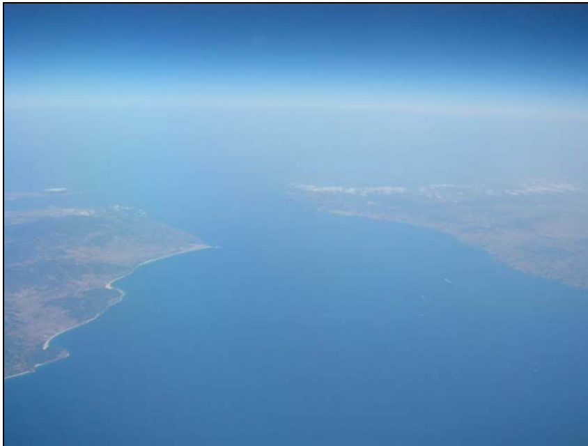
ช่องแคบยิบรอลตาร์ระหว่างสเปน (ด้านซ้ายของภาพ) กับโมร็อกโก (ด้านขวาของภาพ) มีทะเลเมดิเตอร์เรเนียน (ด้านบนของภาพ) ออกสู่มหาสมุทรแอตแลนติก (ด้านล่างของภาพ)

ในแอฟริกาเหนือมีการต่อต้านอาหรับโดยชนพื้นเมืองเบอร์เบอร์ของแอลจีเรีย (Berbers of Algeria) แต่ในที่สุดปีค.ศ. 680 กองทัพอาหรับนำโดย อักบา อิบิน นาฟี (Oqba Ibn Nafi) มาจากตะวันออก เข้ามายังแอฟริกาเหนือ ขับไล่การปกครองของอาณาจักรไบแซนไทน์ (Byzantine) ออกจากตูนิเซีย นำทัพเดินทางต่อมาจนถึงโมร็อกโก เป็นอันสิ้นสุดอำนาจของอาณาจักรไบแซนไทน์ในโมร็อกโกด้วย พวกอาหรับตั้งหลักแหล่งมั่นคงอยู่ที่ไครวาน (Kairouan) (ปัจจุบันอยู่ในประเทศตูนิเซีย) อย่างไรก็ตามไม่ปรากฏแน่ชัดว่าการเข้ายึดครองของอักบา อิบิน นาฟี ทำให้เกิดการเปลี่ยนแปลงศาสนาในกลุ่มชนพื้นเมืองเบอร์เบอร์ในโมร็อกโกและแอฟริกาเหนือ นอกจากนี้อักบา อิบิน นาฟีไม่ได้จัดตั้งป้อมปราการใดไว้ในโมร็อกโกเลย ตัวเขาเองได้ถูกฆ่าตายในแอลจีเรีย ระหว่างการเดินทางกลับไปยังไครวาน