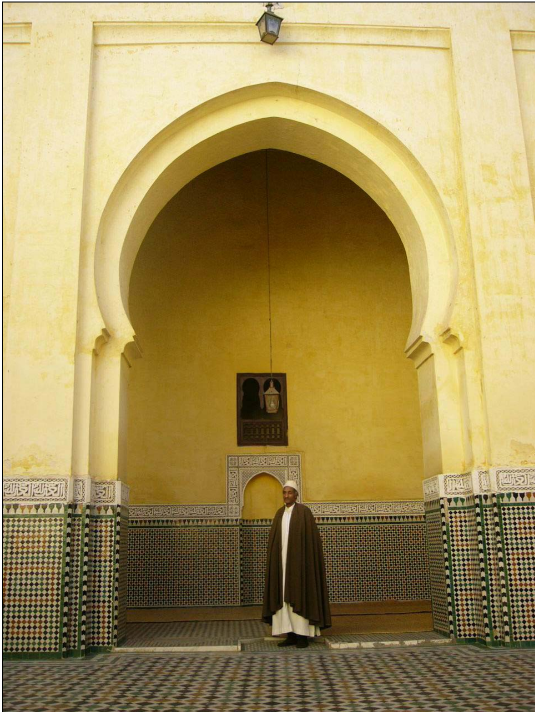
ภายในบริเวณสุสานของสุลต่านมูเลย์ อิชมาอิล