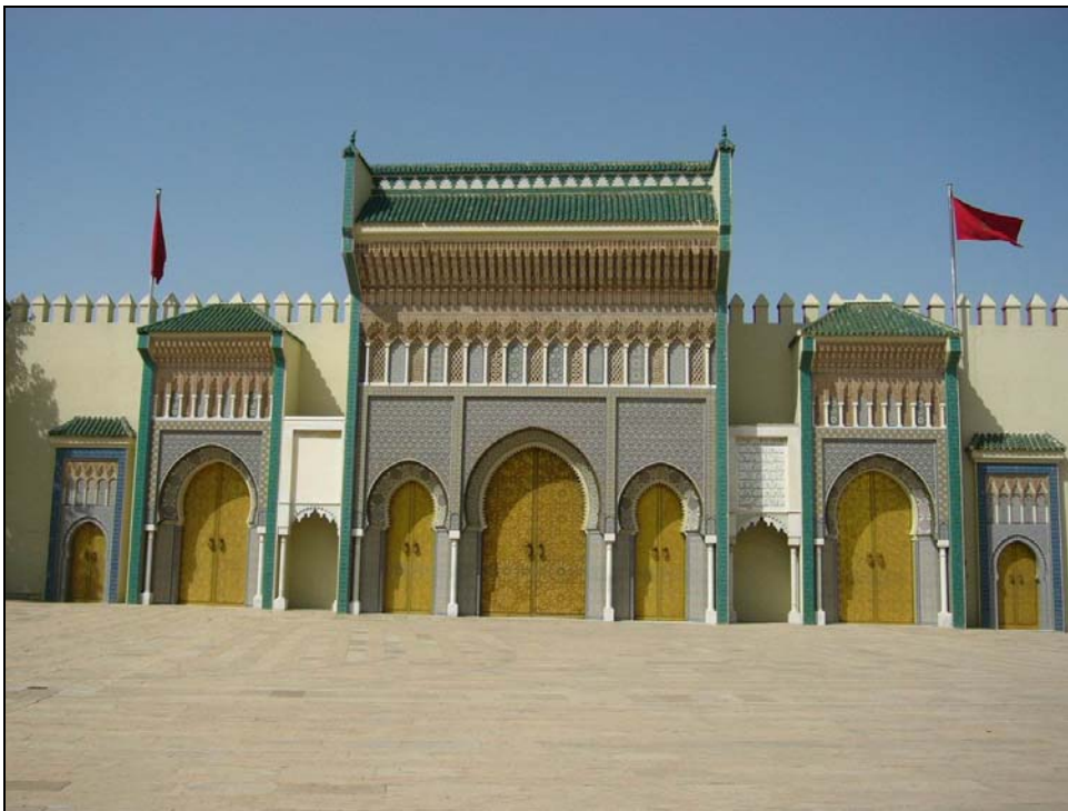
พระราชวังที่เมืองเฟส