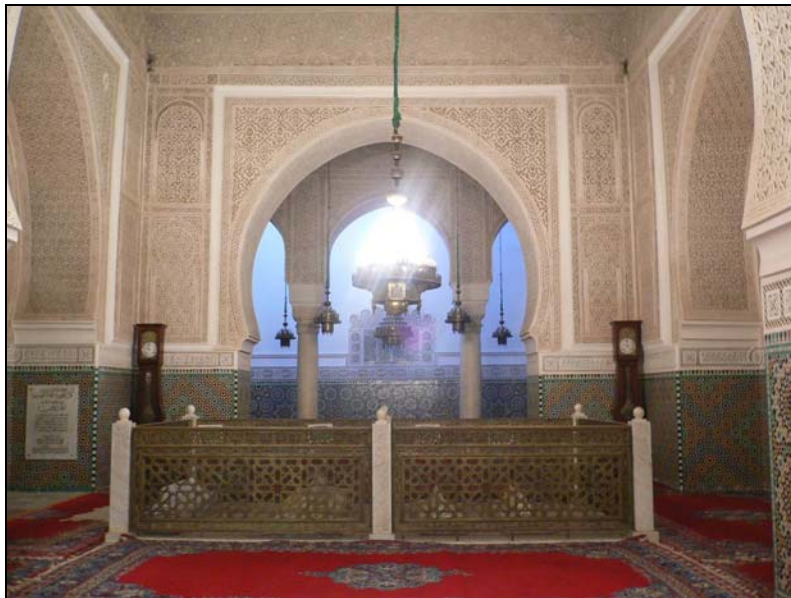
สุสานของสุลต่านมูเลย์ อิชมาอิล ที่เมืองเมกเนส

ต่อมามีพวกเชรีฟ (Shereefs) ผู้ซึ่งเชื่อว่าสืบเชื้อสายจากศาสดามูฮัมหมัด และเริ่มจัดตั้งกลุ่มของตนในฐานะผู้นำทางศาสนา ได้เข้ายึดอำนาจตามเมืองสำคัญ ในปีค.ศ. 1666 ภายใต้การนำของสุลต่านมูเลย์ ราซิด (Moulay Rashid) สามารถเข้ายึดเมืองมาร์ราเกชได้ เป็นการเริ่มต้นแห่งราชวงศ์ออลาวิต (The Alaouites : ปีค.ศ. 1666 - ปัจจุบัน) เป็นราชวงศ์ที่ 6 แห่งราชอาณาจักรโมร็อกโก แต่สุลต่านมูเลย์ ราซิด ถูกลอบสังหารในปีค.ศ. 1672 เมื่อบุตรชายคือ มูเลย์ อิชมาอิล (Moulay Ismail) ขึ้นปกครอง สามารถคุมโมร็อกโกได้อย่างแท้จริง ปกครองนานถึง 55 ปี พระองค์ย้ายเมืองหลวงจากเฟสไปอยู่เมืองเมกเนส (Meknes) ถือเป็นราชธานีแห่งที่ 3 ของโมร็อกโก มูเลย์ อิชมาอิล เป็นสุลต่านที่ยิ่งใหญ่ที่สุดพระองค์หนึ่งในประวัติศาสตร์ราชวงศ์ของโมร็อกโก ในยุคนี้อิทธิพลของฝรั่งเศสได้นำทาสผิวดำ (จากมอริเตเนียและทางใต้ของทะเลทรายซาฮารา) ประมาณ 140,000 คนมาเป็นทหารในกองทัพของโมร็อกโกด้วย เรียกว่า The Black Guard นอกจากนี้มีการสร้างป้อมปราการ (Kasbah) ไว้ทั่วประเทศ รวมทั้งสร้างพระราชวังที่เมืองแทนเจียร์ และราบัต ส่วนพระราชวังที่สร้างที่เมืองหลวงเมกเนสนั้น ถือว่ายิ่งใหญ่งดงามไม่แพ้พระราชวังแวร์ซายของฝรั่งเศสเลยทีเดียว พระองค์ยังได้นำโมร็อกโกให้อยู่ทัดเทียมกับประเทศยุโรปอื่นๆ ด้วย ปัจจุบันสถานที่สำคัญของเมืองเมกเนส คือ พระราชวัง และสุสานของสุลต่านมูเลย์ อิชมาอิล