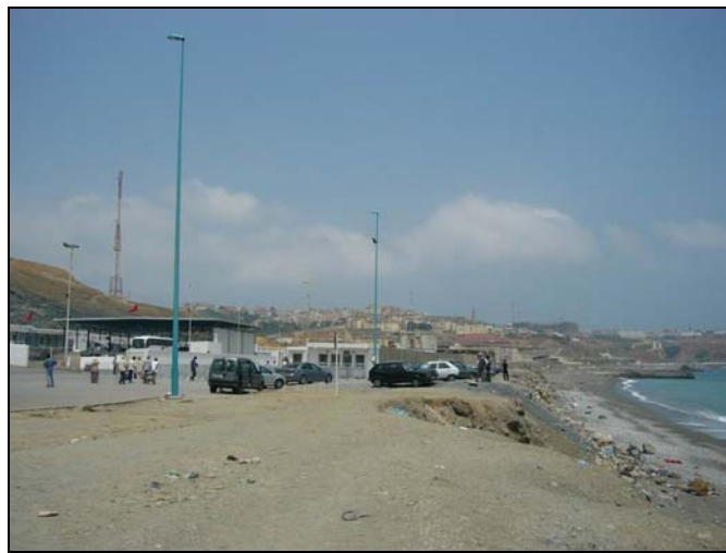
ด่านตรวจคนเข้าเมืองเซปต้าซึ่งเป็นเมืองบนฝั่งโมร็อกโก แต่อยู่ใต้การปกครองของสเปน

ในปีค.ศ. 1956 ฝรั่งเศสยอมถอนตัวออก และโมร็อกโกได้รับเอกราชโดยสมบูรณ์ โดยสเปนได้ยอมถอนตัวออกจากโมร็อกโกด้วย (ยกเว้นเมืองเซปต้าและเมืองเมลิลลา (Melilla) ที่อยู่ในโมร็อกโกและยังคงเป็นของสเปน)