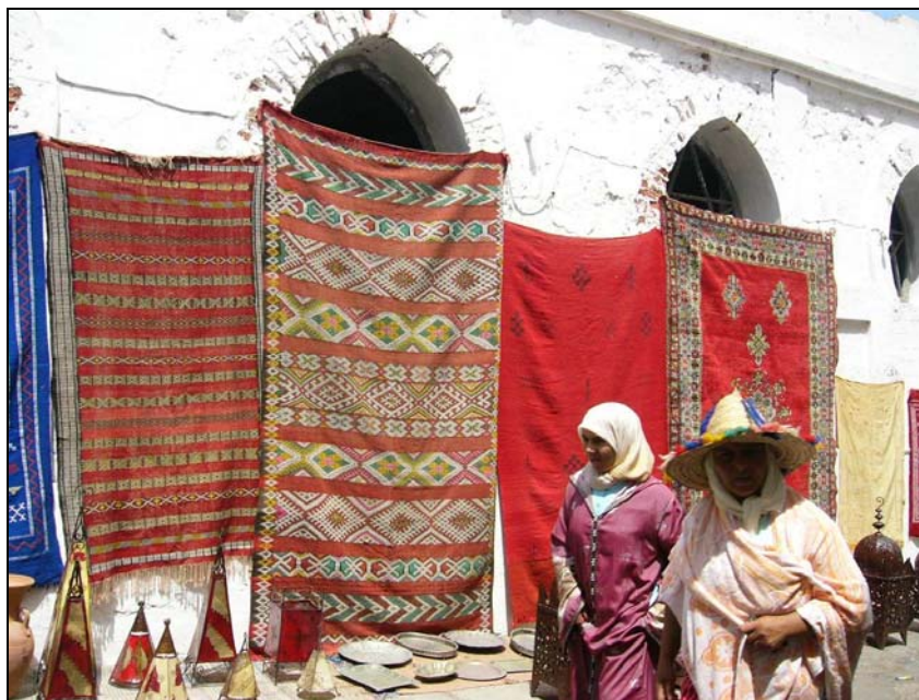
หญิงชาวอาหรับและเบอร์เบอร์ (คนสวมหมวก) มีงานหัตถกรรมพื้นเมืองทั้งดงาม หลากหลายอยู่เบื้องหลัง