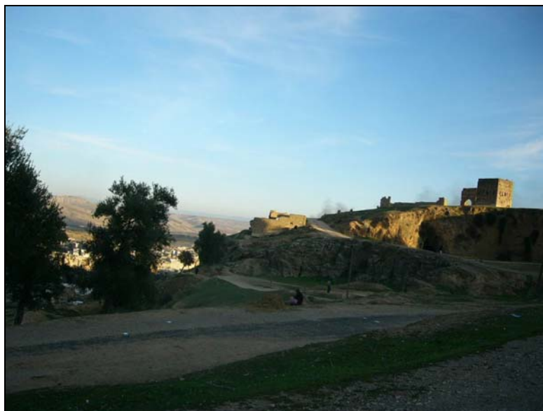
วังโบราณและสุสานของราชวงศ์เมอร์นิด ที่เมืองเฟส

จากนั้นมาในศตวรรษที่ 16 โมร็อกโกอยู่ภายใต้การแข่งขันอำนาจระหว่างสองอาณาจักร คือ วาตาซิด (The Wattasids) ที่เมืองเฟส และซาเดียน (The Saadians) ที่เมืองมาร์ราเกช