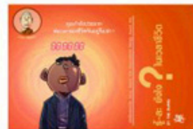
ตอน รู้-ละยังไงในเวลาชีวิต