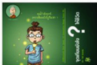
ตอน จุดเทียนยังไงให้ชีวิต