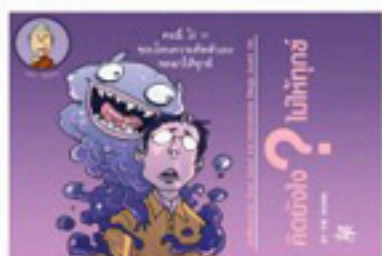
ตอน คิดยังไงไม่ให้ทุกข์