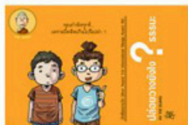
ตอน ปล่อยวางยังไงดี?