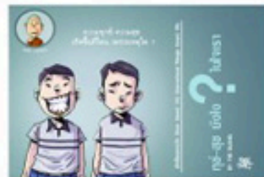
ตอน ทุกข์-สุขยังไงในใจเรา