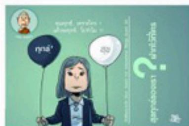
ตอน สุขทุกข์ของเราฝากไว้ที่ใคร