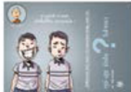
ตอน ทุกข์-สุขยังงใจใจเรา