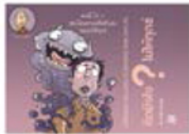
ตอน คิดยังไงไม่ให้ทุกข์