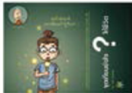
ตอน จุดเทียนยังไงให้ชีวิต