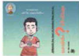
ตอน มองยังงใจให้ใจเป็นสุข