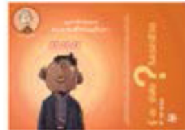
ตอน รู้-ละยังงใจในเวลาชีวิต