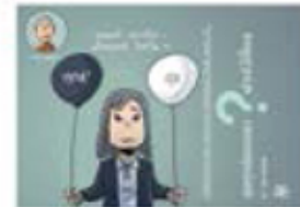
ตอน สุขทุกข์ของเราฝากไว้ที่ใคร