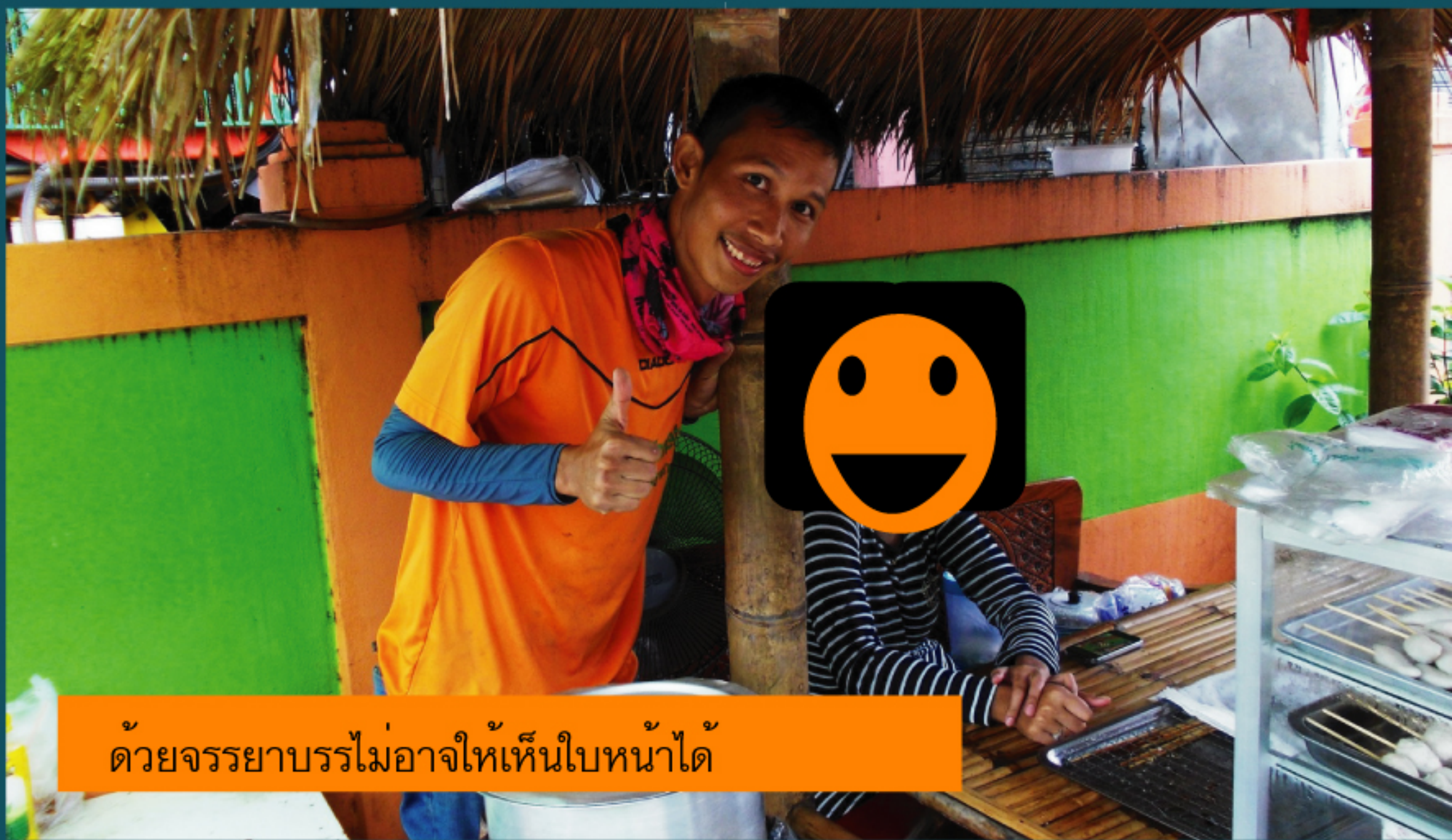
ด้วยจรรยาบรรณไม่อาจให้เห็นใบหน้าได้

สองเสือกินลูกชิ้นทอดไป ตากันไป คุยถึงเรื่องที่บ้านจรรย์านมาเมื่อเช้าแล้วก็คุยกับแม่ค้าตาคมที่นั่งตากลมฝนเป็นเพื่อน จะบายสองแล้วฝนก็ยังไม่หยุด สองเสือจึงสั่งลูกชิ้นกินอีกรอบ รอบนี้ไม่เปื้อนน้ำโคลน