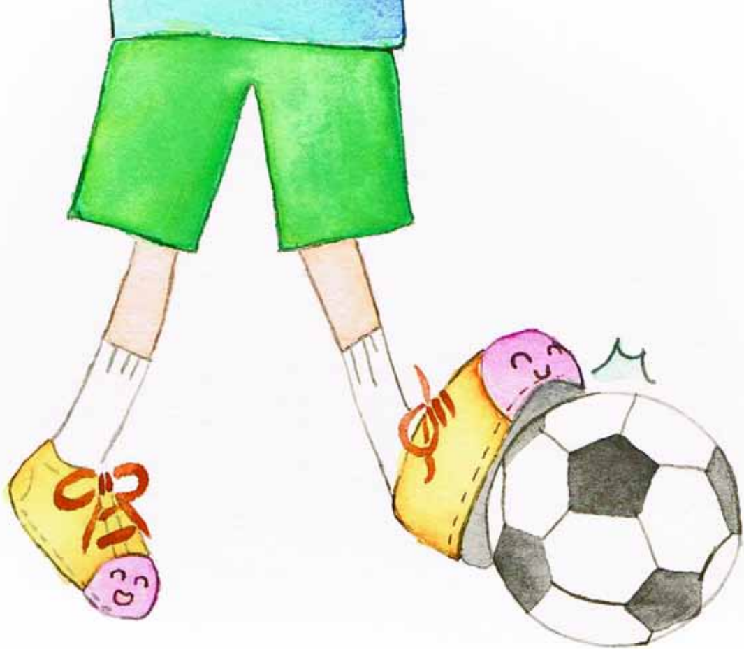
เตะฟุตบอล