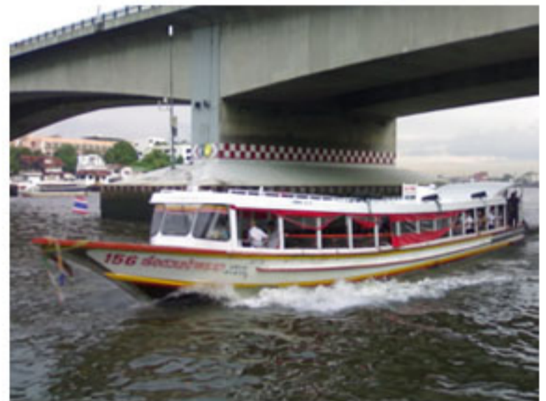
เรือข้ามฟาก